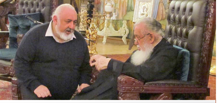
მაისტრო გელა ფარჩუკიძემ სტუმრად მის უშიშროებას, საქართველოს კათოლიკოს კატრიარქ ილია II-სთან