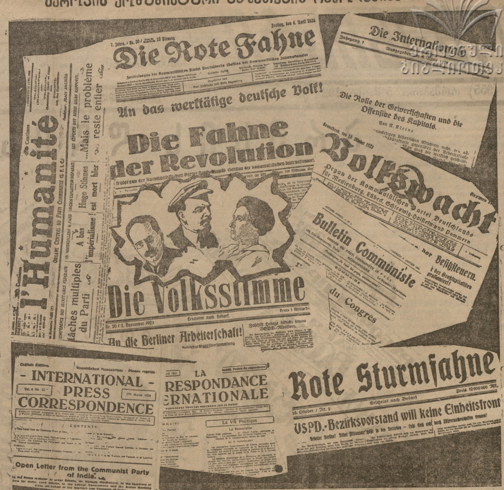
საერთაშორისო კომუნისტური პრესის ნიმუშები...