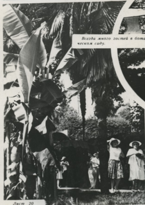
Всегда много гостей в ботаническом саду.