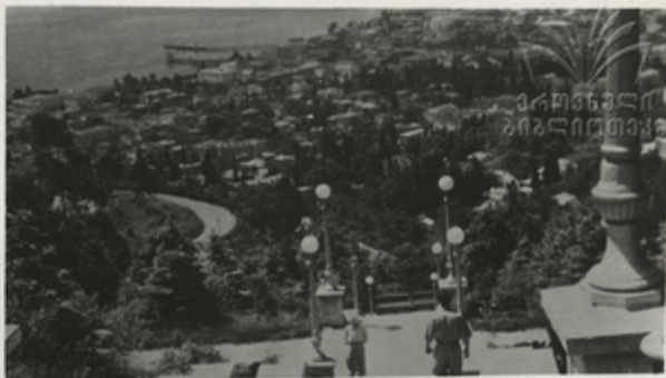
Вид на город с Сухумской горы.