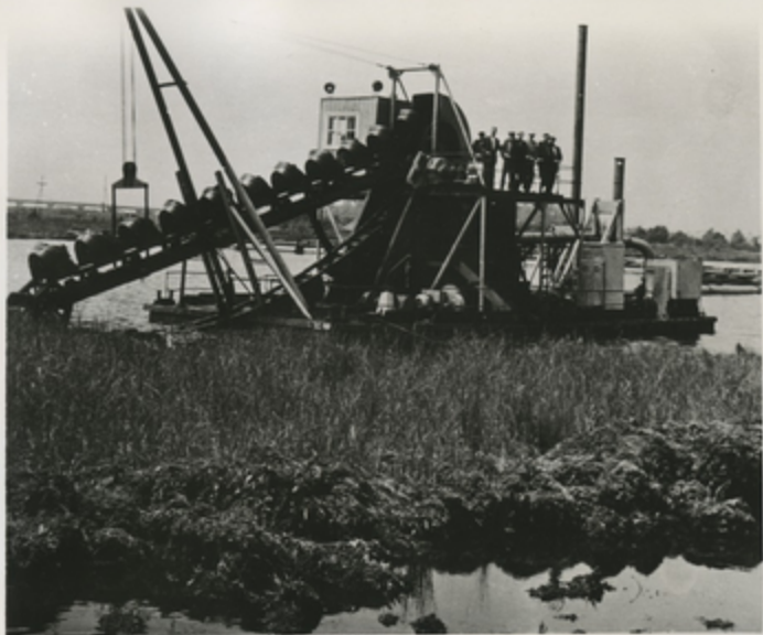
Новый торфодобывающий экскаватор ведет добычу торфа со дна озера Палиастоя.

Широко известна продукция Потийского завода гидромеханизмов. Предприятием освоено выпуск, единственного в стране многоковшового торфодобывающего плавучего экскаватора, производительность которого 300 кубических метров торфа в час.