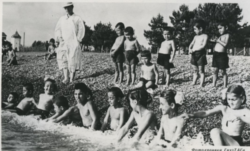
В Кобулетском детском санатории.

Кобулет — один из популярных приморских курортов Грузии. Купальный сезон здесь продолжается восемь-девять месяцев. Известен Кобулет и как детский курорт. В Кобулетском районе развито чаеводство, цитрусоводство. Здесь, близ курорта Цихисдзир, находится известный по всей стране Лимонарий.