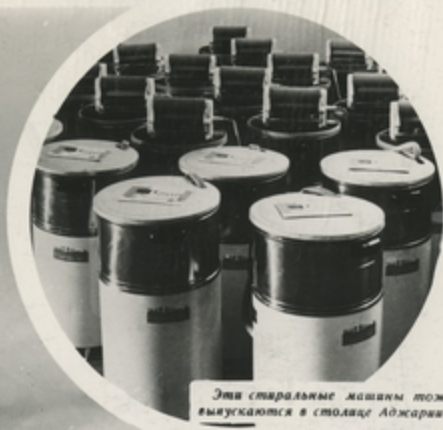
Эти стиральные машины тоже выпускаются в столице Абджария.

Более 40 наименований высокопроизводительных машин для чайной, консервной, рыбной, винодельческой и других отраслей пищевой промышленности выпускает Батумский машиностроительный завод. Небольшие теплоходы, прогулочные катера, катера на подводных крыльях сходят со ступеней Батумского судостроительного завода.