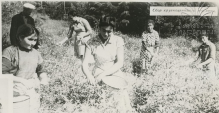
Сбор кружков герани

Во многих хозяйствах черноморского побережья республики возделываются ценные эфиромасличные культуры: герань, казанлыкская роза, пачули и другие. Эфирные масла поставляются для вновь созданной парфюмерной промышленности Грузии и в другие республики.