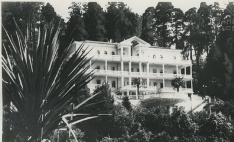
Санаторий „Аджария“ на Зеленом мысе.

В девяти километрах от Батуми расположен курорт Зеленый мыс. Отроги Аджаро-Имеретинских гор, покрытые лесными зарослями, спускаются к морю, оставляя для курорта небольшую береговую полосу с пляжем. Морские волны, разбиваясь о громадные каменные глыбы у мыса, образуют тысячи изумрудных, сверкающих на солнце брызг.