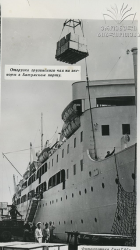
Отгрузка грузинского чая на экспорт в Батумском порту.