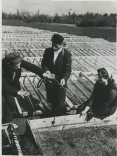
В теплицах колхоза имени Жданова Очамчарского района.

Укладка лаярос на Сухумской табачной фабрике.