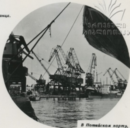
В Потийском порту.

Поти—морские ворота республики. Через них Грузия поддерживает экономические связи с РСФСР и Украинской ССР, с европейскими странами народной демократии, другими зарубежными государствами.