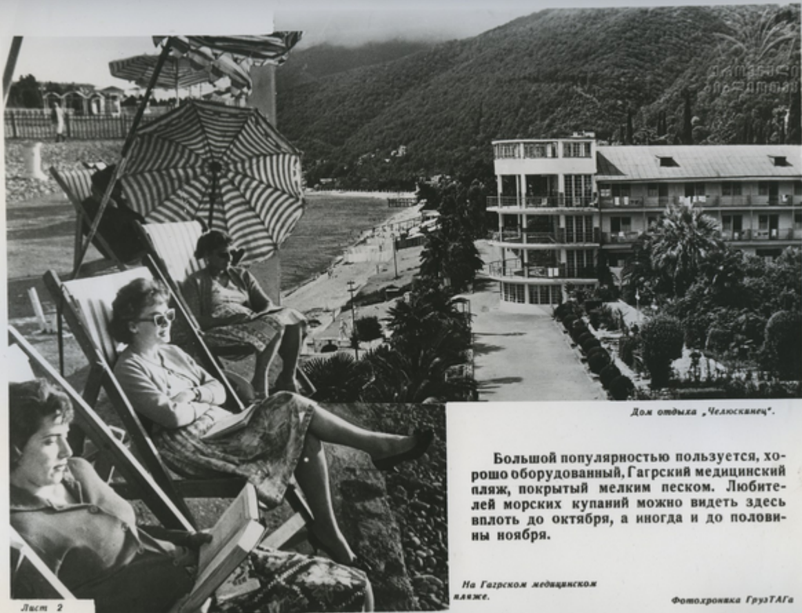
Дом отдыха „Челюскинец“.

Большой популярностью пользуется, хорошо оборудованный, Гагрский медицинский пляж, покрытый мелким песком. Любителей морских купаний можно видеть здесь вплоть до октября, а иногда и до половины ноября.