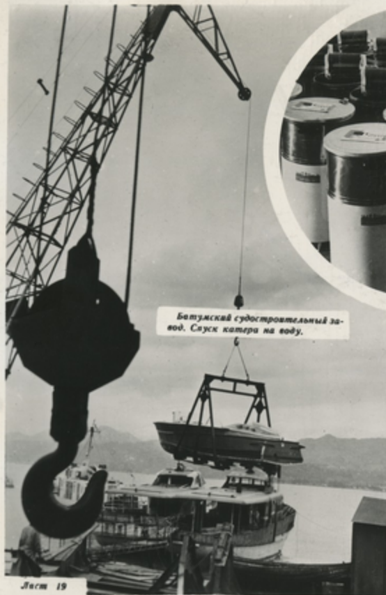
Батумский судостроительный завод. Спуск катера на воду.