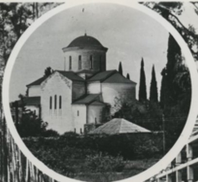
Монастырь в Пицунда.