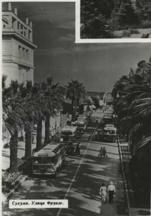
Сухуми. Улица Фрунзе.

Чудесные природные и климатические условия принесли Сухуми славу первоклассного приморского курорта. Средняя годовая температура здесь — плюс 14,9 градуса. Морские купания продолжают вплоть до ноября. Мимозы, магнолии, другие теплолюбивые растения цветут даже зимой.