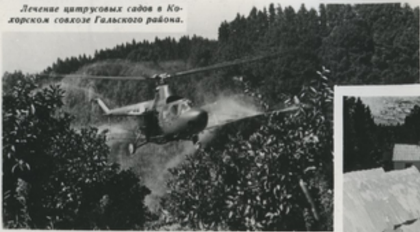
Лечение citrusовых садов в Ко- хорской совхозе Гальского района.