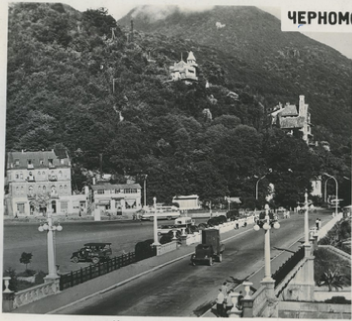
Один из уголков Гагра.

На узкой прибрежной полосе черноморского побережья расположен курорт Гагра. Он с суши словно прикрыт подступающим к самому берегу моря одним из отрогов Кавказиони—Гагрским хребтом, склоны которого щедро покрыты южной растительностью. Сквозь пышную зелень виднеются здания санаториев и домов отдыха.