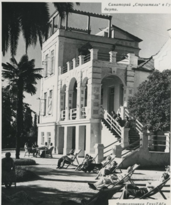
Санаторий „Строитель“ в Гу- даута.