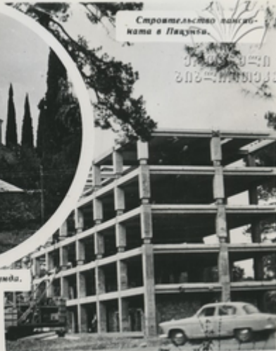
Строительство санатория в Пицунде.