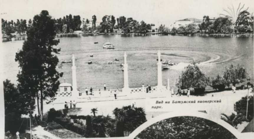
Вид на Батумский пионерский парк.