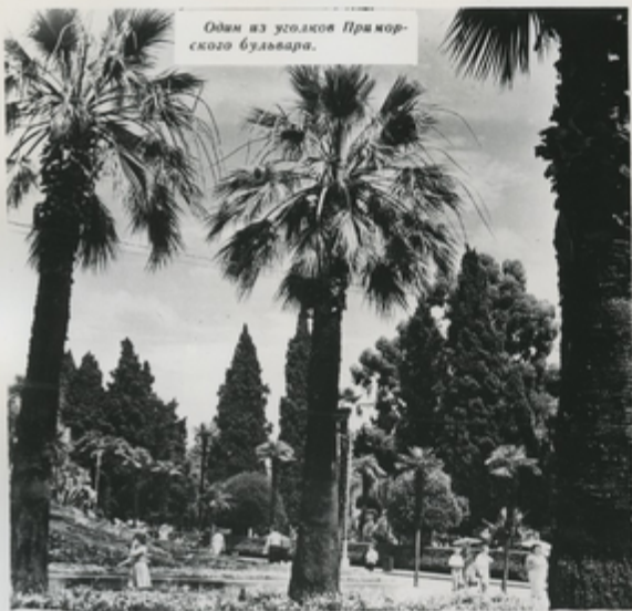
Один из уголков Приморского бульвара.