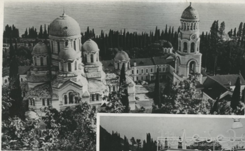
Дом отдыха „Псырцха“.

Недалеко от Сухуми во второй половине XIX в. возник крупнейший монастырь, который, по идее его основателей, должен был стать вторым Афоном. Отсюда и получили название монастырь и селение — Новый Афон. Старый Афон — знаменитый центр грузинской культуры за рубежом, — как известно, находится в Греции. В белокаменных зданиях монастыря размещался Дом отдыха „Псырцха“.