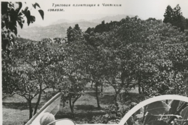
Тунговая плантация в Чанкском совхозе.