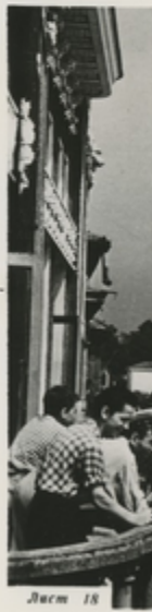
В Батумском морском порту.