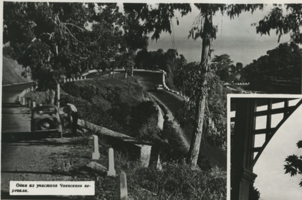
Один из участков Чукяского парка.

Живописная природа Черноморского побережья Грузии, красота его курортов, городов и сел привлекают тысячи экскурсантов и туристов со всех концов нашей Родины и из за рубежа. Их встречают радушно, с искренней грузинской гостеприимностью.