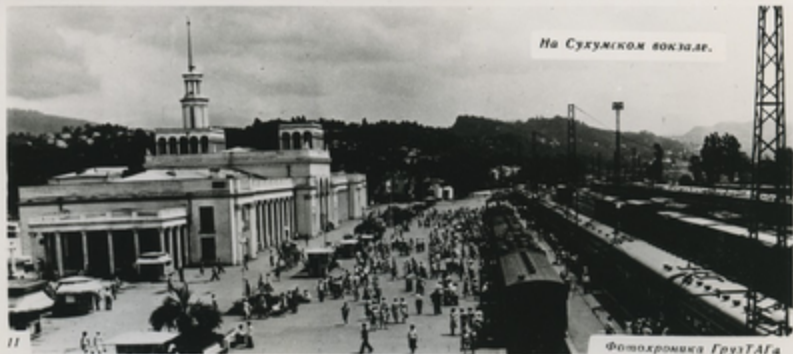
На Сухумском вокзале.

Железнодорожные экспрессы, автобусы, морские корабли и воздушные лайнеры в течение всего года доставляют в Сухуми курортников и экскурсантов со всех концов нашей Родины. В их распоряжении — гостиницы, туристские базы, пансионаты. В городе широкая сеть культурно-просветительных учреждений-клубов, домов культуры, кино-театров. Работают драматический театр с абхазской и грузинской труппами, государственная филармония.