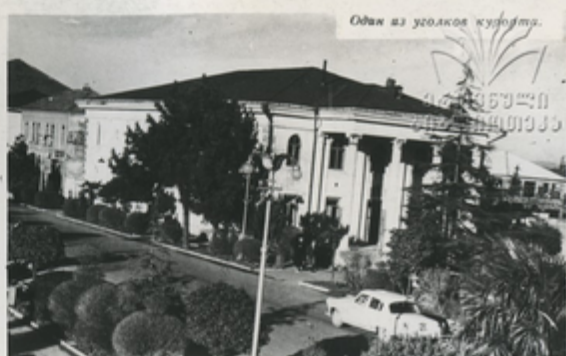
Один из уголков курорта.

Кобулет — один из популярных приморских курортов Грузии. Купальный сезон здесь продолжается восемь-девять месяцев. Известен Кобулет и как детский курорт. В Кобулетском районе развито чаеводство, цитрусоводство. Здесь, близ курорта Цихисдзир, находится известный по всей стране Лимонарий.