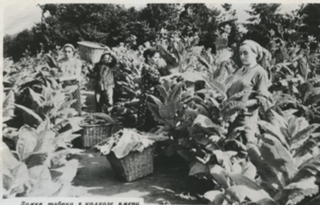
Ложки табака в колхозе имени Ленина села Окули Гальского рай- она.

Благодаря и щедря грузинская земля. Многие её дары приобрели всемирную известность. Грузинский табак, например, используется как купажное сырье для производства высококачественных табачных изделий, идет на сдабривание табаков, получаемых в других республиках страны. Абхазия — крупный производитель высококачественных табаков.