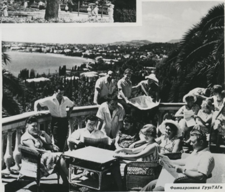
На веранде дома отдыха „Сухуми“.

Сухуми—столица Абхазской АССР—один из красивейших курортов всего черноморского побережья. Город-сад утопает в пышной зелени. Несколько парков находятся в самом его центре. На Приморском бульваре и в парках растут громадные пальмы, магнолии, олеандры и другие представители субтропической флоры.