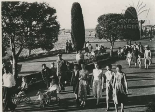
Приморский парк в Батуми.