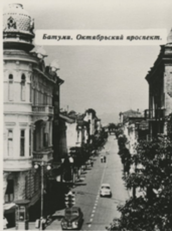
Батуми. Октябрьский проспект.