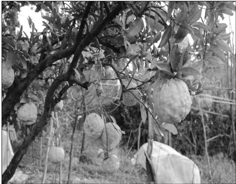
ჯახო მურაბის დამზადების წესს:

ნაყოფები ტექნიკურ სიმწიფეში შედიან ნოემბერ - დეკემბრის თვეში. ნაყოფები იკრება მარატული, ყუნწიანად ერთად. ეწობა გრილ სარდაფში +40-+50 ტემპერატურაზე, რაც ახანგრძლივებს ნაყოფების შენახვის უნარიანობას. ასევე მიზანშეწონილია საცხოვრებელ ბინებში „ოიუს“ ნაყოფების განლაგება, რაც სასიამოვნო არამატსა და სურნელებს შესძენს თქვენს ბინას. როგორც აღვნიშნეთ ციტრუს „ოიუ“-ს ნაყოფები საინტერესოა, როგორც პექტინის ნედლეული, რასაც ფართო გამოყენება აქვს ცუკატებისა და მურაბების დასამზადებლად. ჩვენი პრაქტიკიდან გამომდინარე მისგან დამზადებულმა მურაბამ ბევრი უცხოელი სპეციალისტის თუ მომხმარებლის განსაკუთრებული ყურადღება დაიმსახურა, რაც ერთხელ კიდევ მიუთითებს ამ კულტურის ნაყოფების ფართო სამრეწველო-საკონსერვო გამოყენების შესაძლებლობებზე. აქვე ქთავაზობთ ციტრუს „ოიუ“-ს ნაყოფებიდან საო-