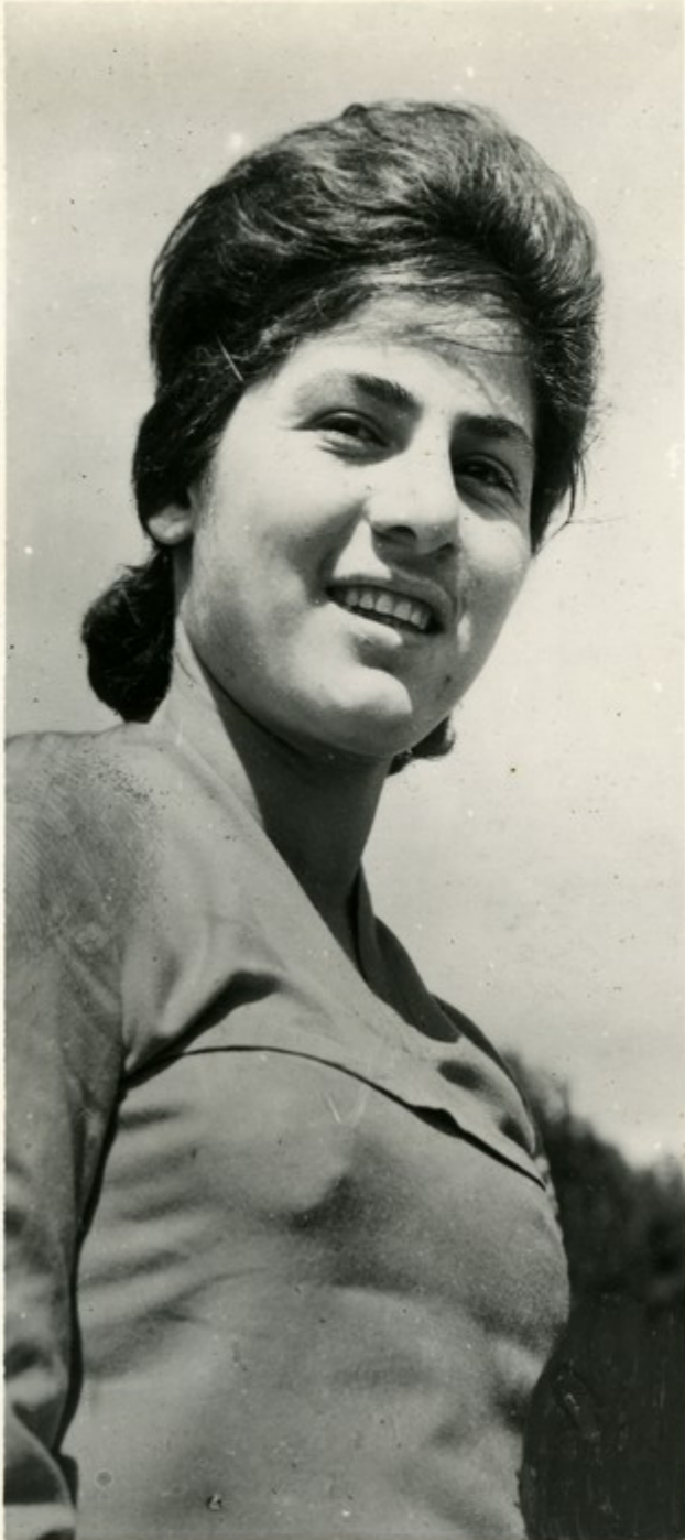
წყადგუბოს აგიონის სოჭად გულდუკის აღსთავების სახელოგის კოლმუხანათობის გუჩიერ დერი ანდრიაბუ.

მხუკვადე მოწონებით შეხვდნენ პლენუმის გარდაწყვეტილებებს საქართველოს მშრომელნი. საქართველოს პარტიული ორგანიზაციის აქტივისტების კაბაში, რომელიც ვი მაგისტრის განიხილა, განიხილა პლენუმის შედეგები და აღსკვბილის პარტიული ორგანიზაციის ამოცანები. სოჭლის მუხანათობის ყველა დაგვის მუშაობი ახად მიჯნებს სახავენი შვიდნდერის დაგამთავრებელი წინსათვის. სუკათუბ თქვენ ხედვთ ახადგუზრად შეჩიითა და შეთიგრუსეთა აღსკვბილუკი შეკრების მოწანიდებას სახადგანთქმულ მუხნიერ-სადექსიმონერ კვადეშიკოს ქსენიერ გუხვამქსთან ეკთარ. სოჭლის ახადგუზრად მშრომელბებ კონკრეტული ვადეგუდებანი აიღეს პლენუმის გარდაწყვეტილებათა საკანუხორ.