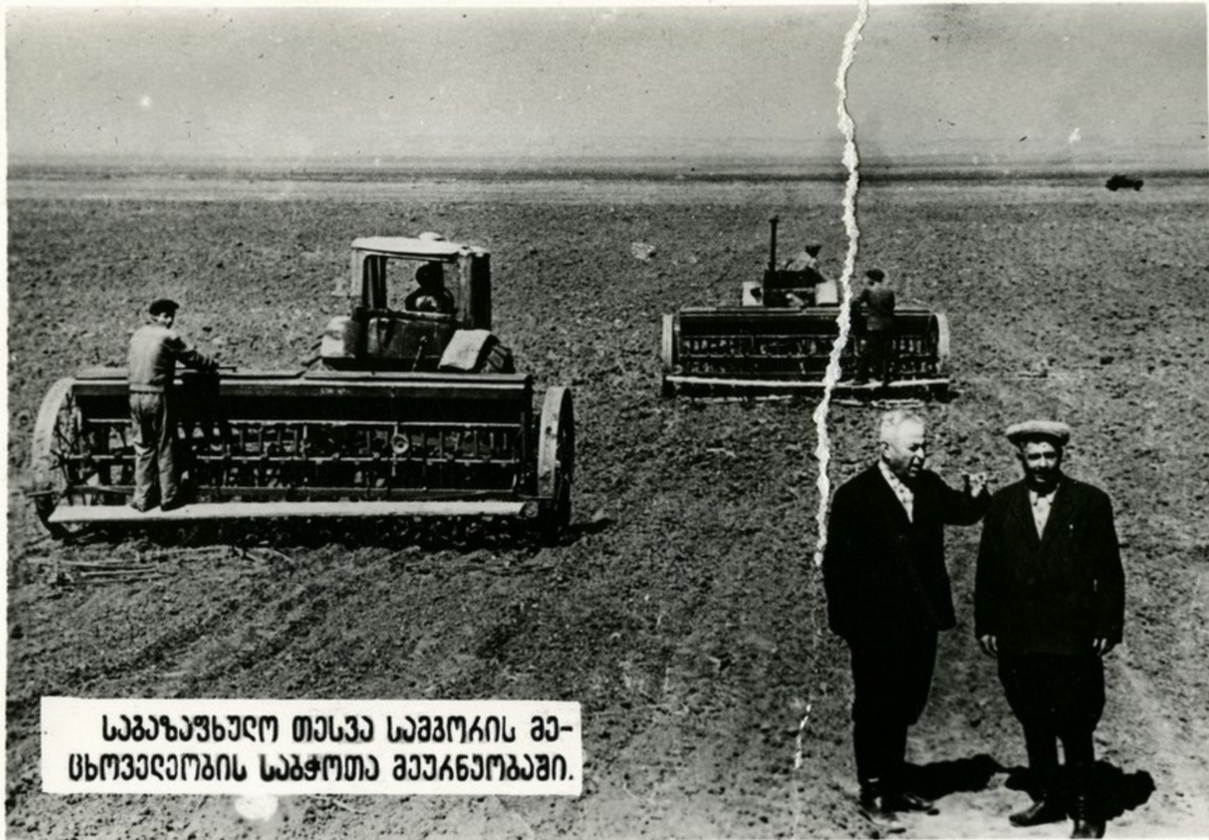
საბაზაუზხულო თესვა საბჭოების მე- სხოვედროების საჭოთა მეურნეობაში.

იგი ღლეებში, რომელიც მოსკოვში შეზღოვდა სკკს ტანგადალი კომიზავის პლანში, სა- ქათვედროს მხნად-მთესვედებმა გააჩაღეს ბაძოდა უხვი მოსავლისათვის. სასახელო შრო- მითი საქმეებით ვასუხოგან ისინი ვაჩვიისა და მთავრობის ზახუნას. მაკვდეული კდე- ჩების თესვა, მიუხედავად უაღასად სური ამინდებისა, მკგანიზებულად და მალად აკომგე- ნიკურ ღონეზე ჩავაჩდა.