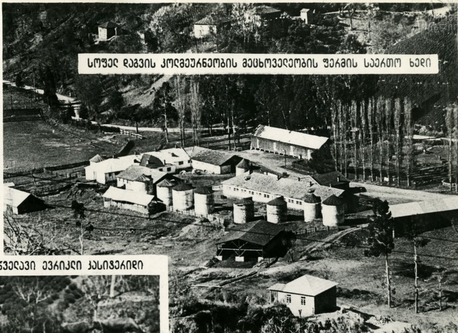
სოუად რაგვის კომბუარნობის მახსოვადომის უბანის საკათო ხადი

პაკვიის ტანჯაღუკი კომიზავის გაკვის კდნუბის გარანუვიღებება ელაუკომოვანეს, ახალი ქაღები უბა- გან ქომუღათის რიონის სოუად რაგ- ვის მახსოვადომის უბანის მხრობა- ღებს. მათ ახალი გარღებადი ვადღ- ბუღებანი აიღეს, რასახეს ღონისძი- ბანი მახსოვადომის კუღუკის აბაღ- ღებისათვის, საკამო სემონდის მოვ- ღა-პავრონობის გაუმჯობესებისათ- ვის. წდის ბოლომღა უბანის მწვად- ვებმა იკისრან მიიღონ 37 ჳონა ზა- გებმითი რბა.