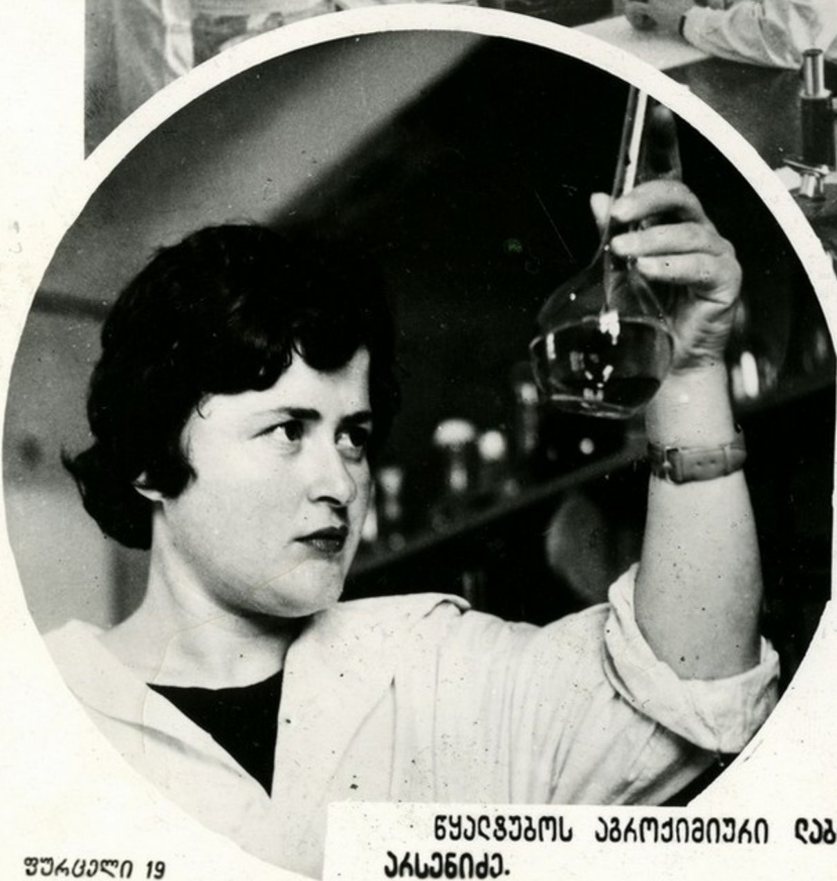
საქართველოს საკვდევ-სანდავლო ზომავაჟაინაჟული ინსჟინჟერ- ის ვეჟაინაჟულ კლინიკაჟი.

„სიუხვის საჟსახუას“ ეჟახინან სოჟდის ჟეუჟნეოჟის შჟაკოჟელაჟი აჟკოჟიჟიუჟა დაჟოკაჟოკიჟებს. ეს ვეჟაჟა საჟეჟსნიჟაკოჟ სენჟჟაჟი უკვე ჟესაჟე ნელიჟა დირ დახჟაჟაჟებს უნეჟან კოღჟეუჟნეოჟებსა და საბჟო- თა ჟეუჟნეოჟებს. ჟათ ჟიჟა ჟერჟენიღი აჟკოჟიჟიუჟი აჟეჟი საჟუაღ- ბან იჟღეჟინან სწოკარ გენისაჟღჟაკოს შინღჟაჟებსა და ვღანჟეჟიუჟი ჟესაჟანი სასუჟეჟის აოღენოღა და სახე, გეიჟუარღოს შინის ბაჟაჟა. გენეჟეჟეჟიღი უჟჟოგენღეჟა აჟკოჟიუჟე ვეჟაინაჟული საჟსახუაჟი, აო- ჟელიღს დგან სასოჟდო-საჟეუჟნეოჟ სხოჟელითა ჟანსაღოგის საღაჟა- ჟოჟე.