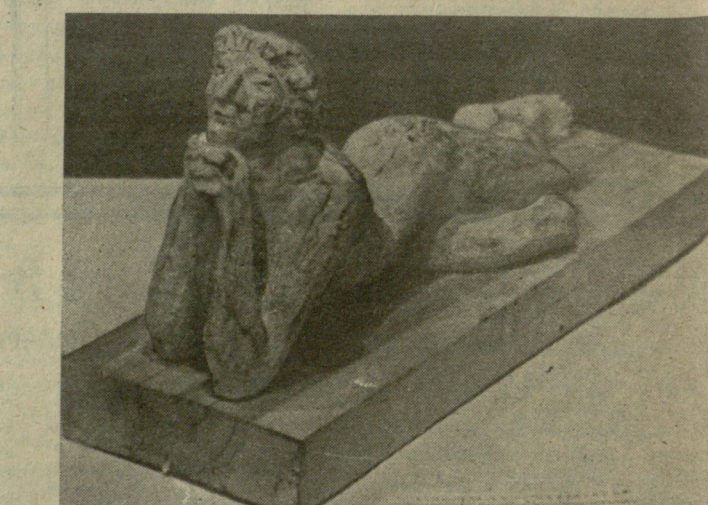
3. პაპინაშვილი — „ღრუბოა“ 2. ტომიძე — „ჩუღურეთი“ 1. მირზაშვილი — „კვიციანი“ 5. კვიციანი — შიშველი ქალის ფიგურა.