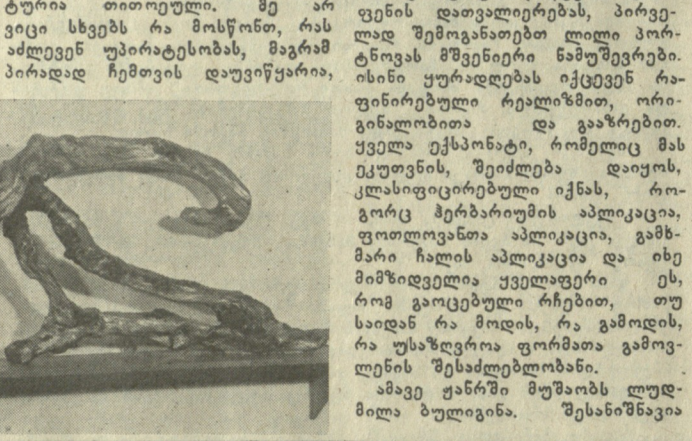
მეორე მხრივ, ბუნების ხელოვნების, აბსტრაქციის აქვს წინადადება...