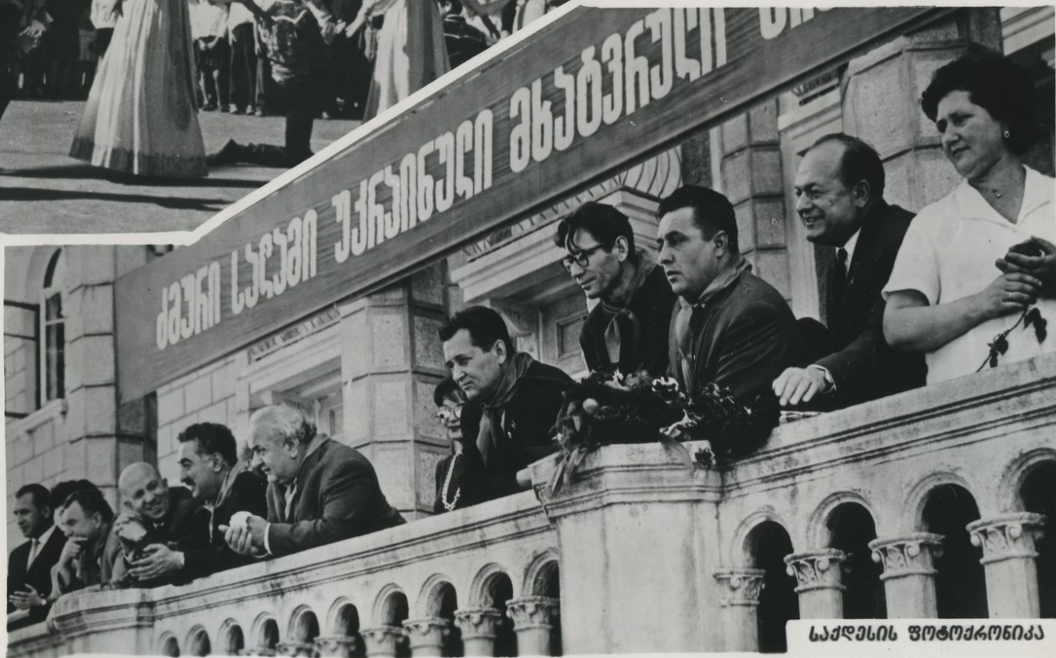
ქვეყნის მონაწილეთა ერთი ჯგუფი.

საზიარო იყო უკანონო მხარე- ბის შესვლა გუკიაში. შრომის კოლმე- ურნეობაში სკოლაებს შეხვედნენ ისა, როგორც საერთო სხვაობიან მთელს საქართველოში,—სიხარულით, გახილი გულით, სიბრძნავითა და სიყვარულით.