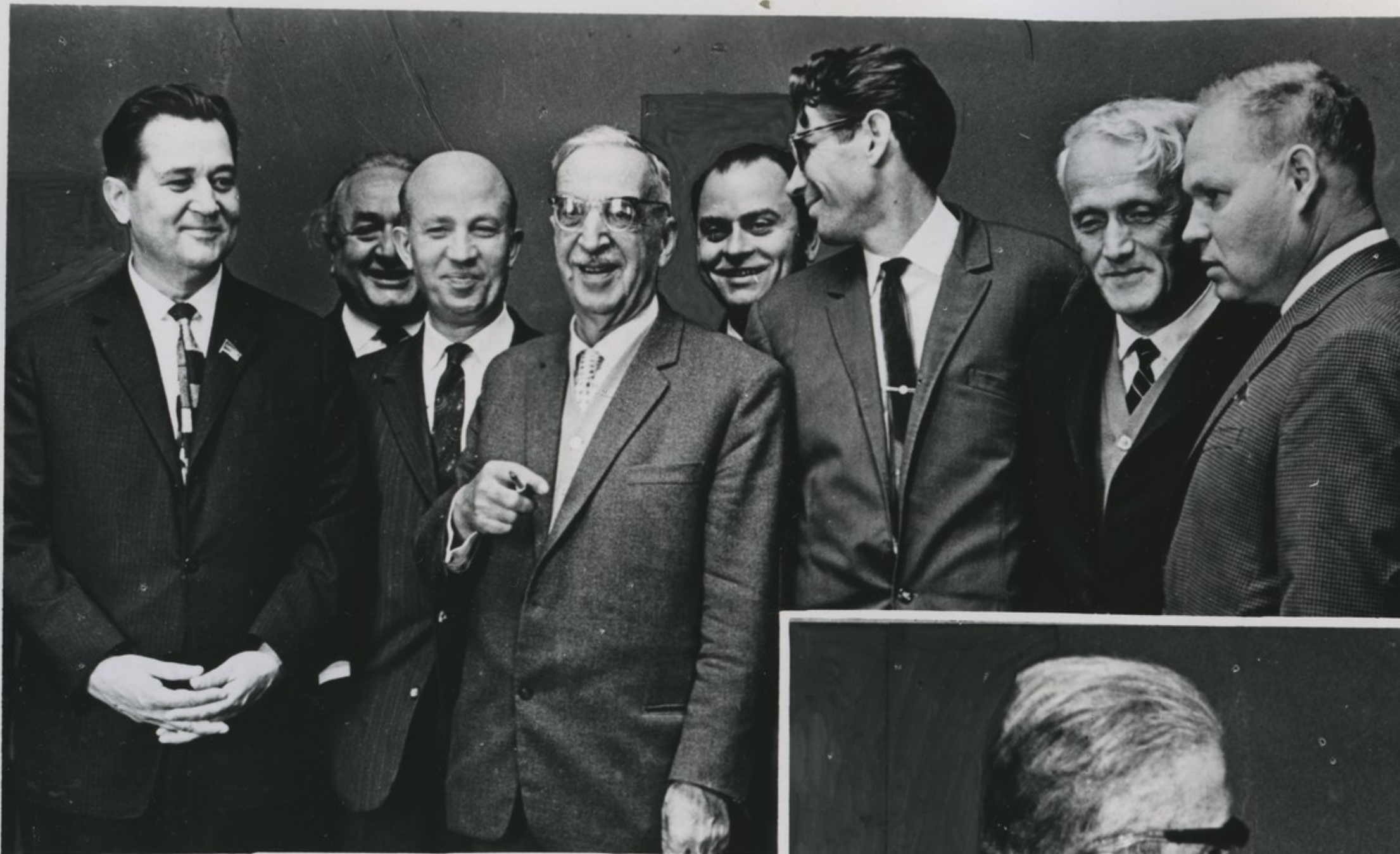
დეკანოზის მონაწილენი საქართველოს სსრ მუსიკარებათა აკადემიისში.

5 ოქტომბერს უკრაინელი მწერლები შეხვედრას ქართველ მუსიკარებს. კონსერვატორიის მუსიკარებათა აკადემიისში გაიმართა ვადტობილი საუბარი, რომელშიც მონაწილეობა მიიღო თბილისის გავრი სამუსიკარო-საკვლევო დაწესებულების ხელმძღვანელმა. სწავლებას მხარხვადურ მიქსაძემ აკადემიის პირმჯიღენი, აკადემიკოსი ნ. ი. მუსხელიშვილი.