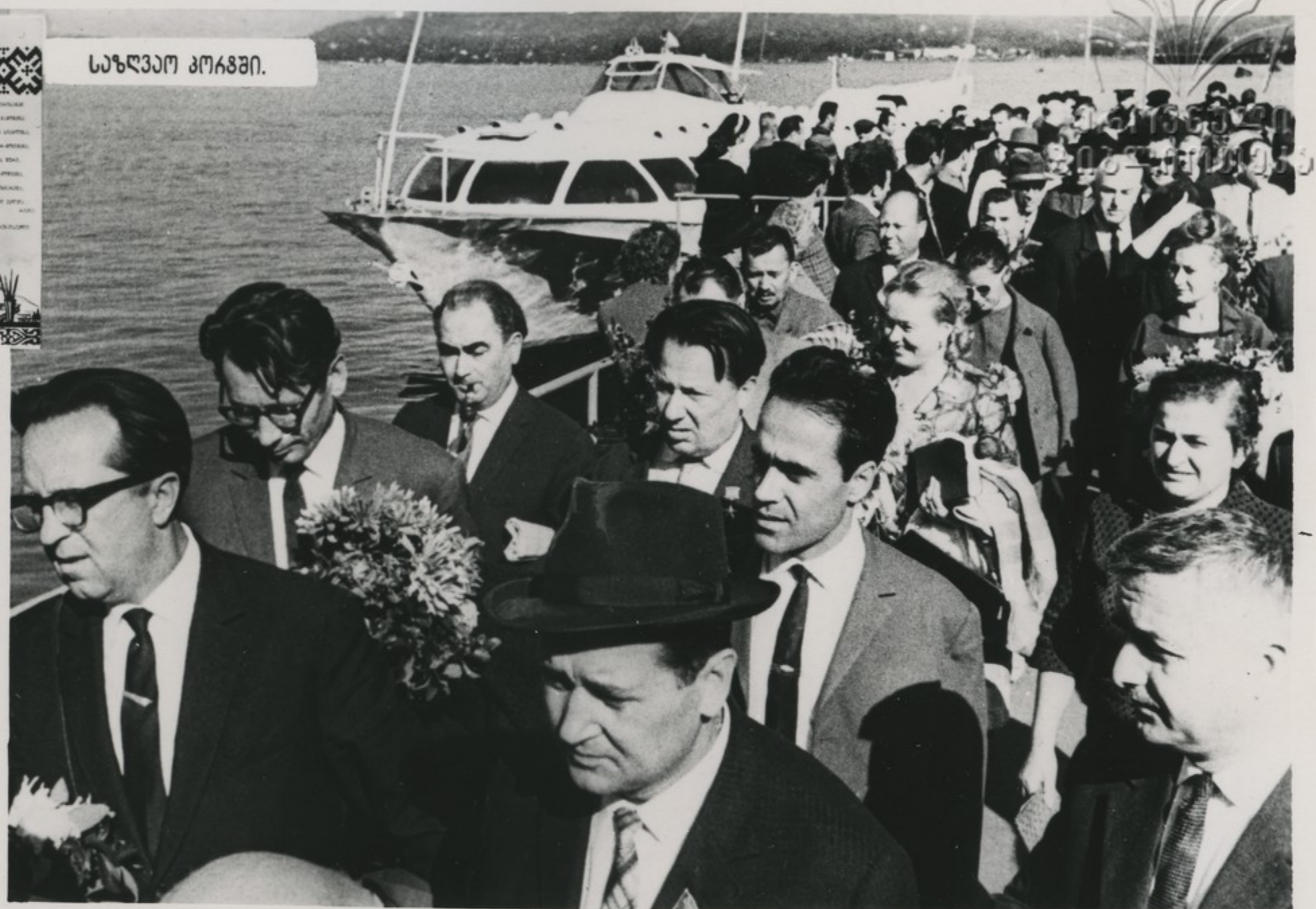
ქაღალის რეთვილიკების რაოს.