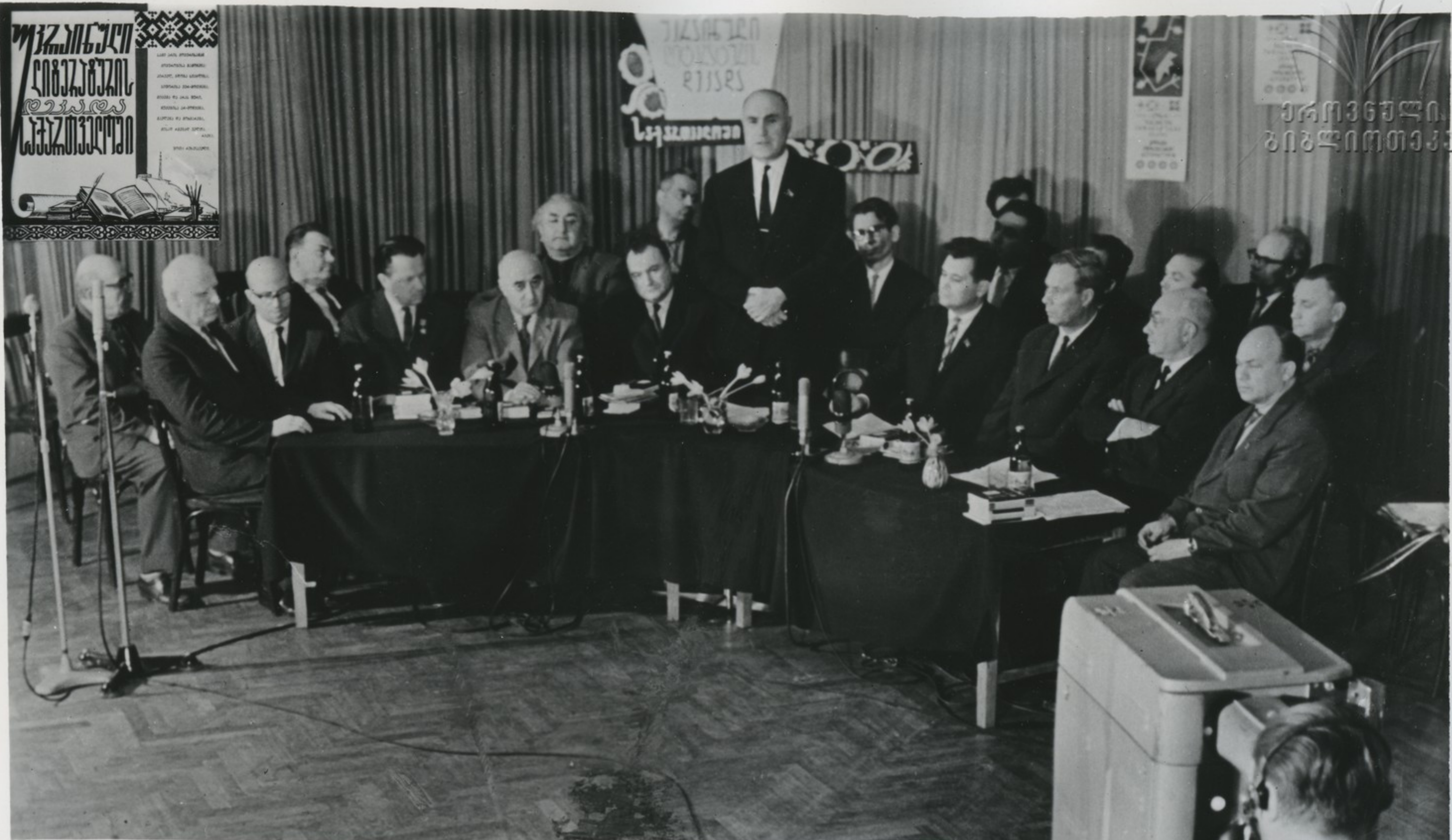
2 ოქტომბერს სულამოს უკრაინელი მხარდები შეხვედრას ყვარაზე მკავად- რიხსოვან პერიფორიას—ქართვად ვადამაყუარებდბს. ჩვენმა სვამარბმა იდაპე- რაკან თანამარკოვამ უკრაინულ დივარარვარაზე, თავიანთ შემოქმარებრით გებ- მებზე. შეხვედრაში მონანრილომა მიილან აბარათვა ქართვადმა დივარარვოარებმა. სუარათვა: უკრაინელი მხარდები თბირისის ვადანვარირაში.