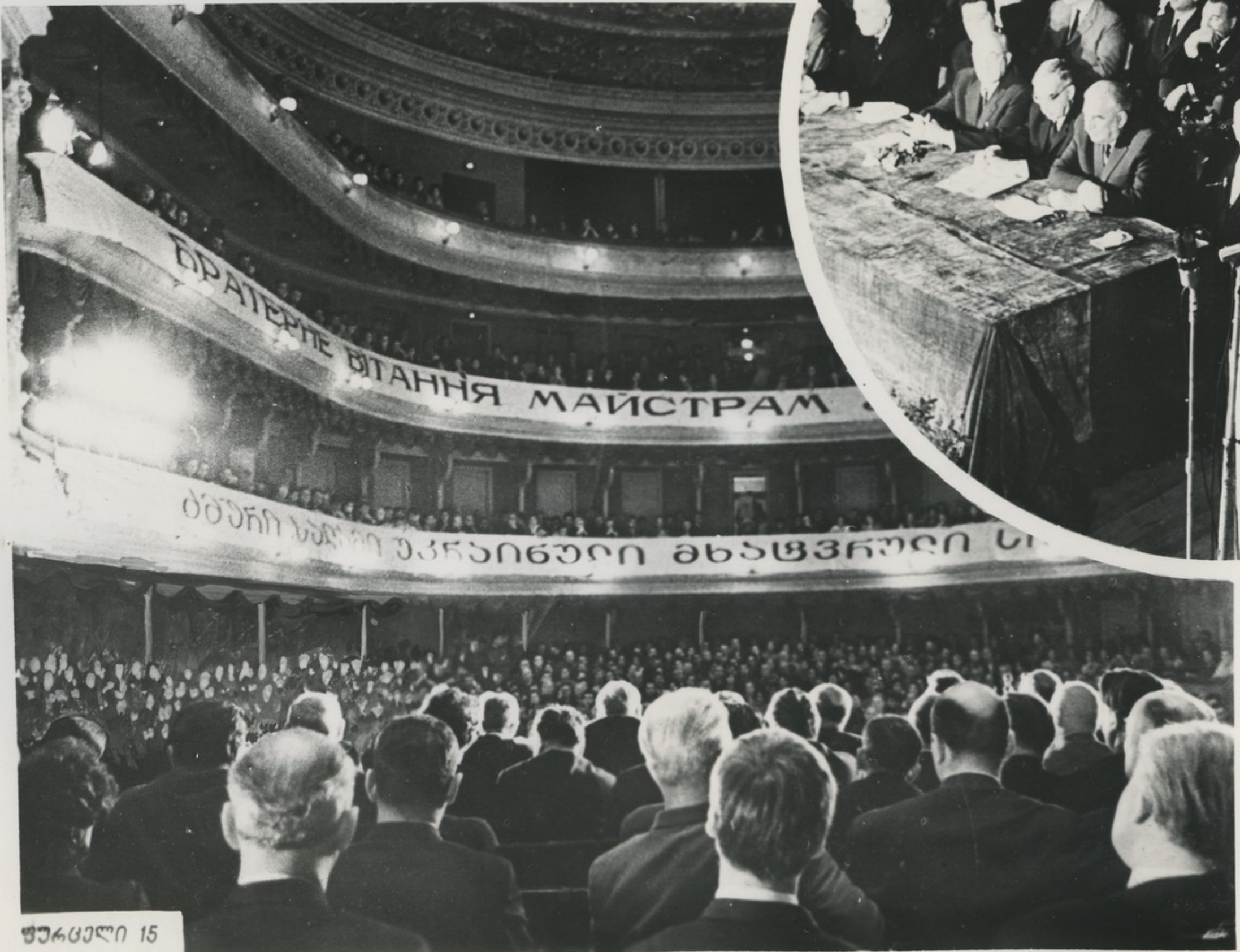
სავამომს ვაკვიღიღვი. ვაკიგუნაზა სავაკ-თვადოს კომპაკვიის ცანვკალაკი კომიგვის მღიწანი ამხ. ღ. ვ. სვაკა.