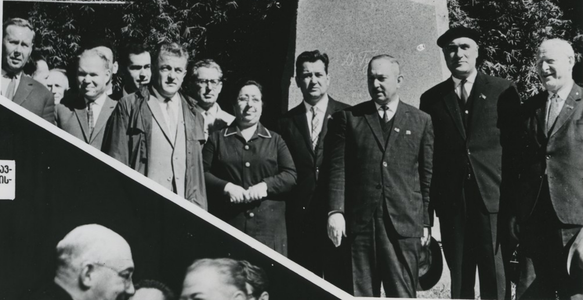
ეზუხეთის ასსკ მიწისკათა სკგჟოს თავ- მკდომეკა მ. ზ. დიქოვანი დებედების 60 ნდის- თევს უდოტევს მიკოდა გეჟანს.