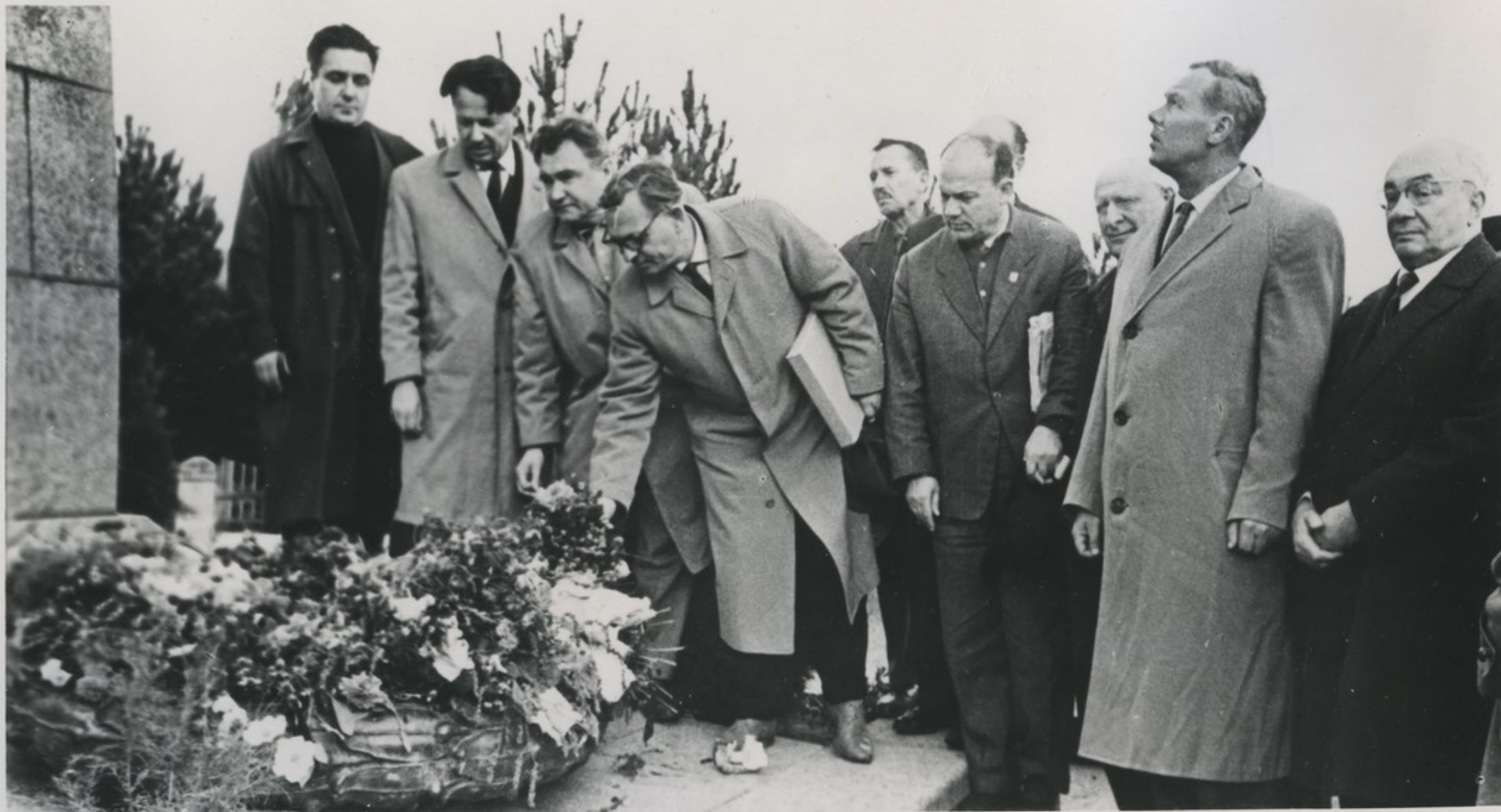
ლესია უკაინჯას ძეგლს მზიკვინებით აპოგან.

ღირი ხაღხაუღოგა იყო 6 ოქოგოგას სუაგოგი, სარაგ ზავირენან დეკარის ონანინდე- ნი. იქ, სარაგ აღგეათუღია უკ- აინჯადი ხაღხის გეგოგენიღი ქელიგვიღის დესია უკაინჯას ძეგლი, გეიგეათა ხაღხაუღადი მიგინგი. სგუგეგეა და გან- ვინგდეგეა ყვავიღებოთ გეგე- კეს ძეგლი.