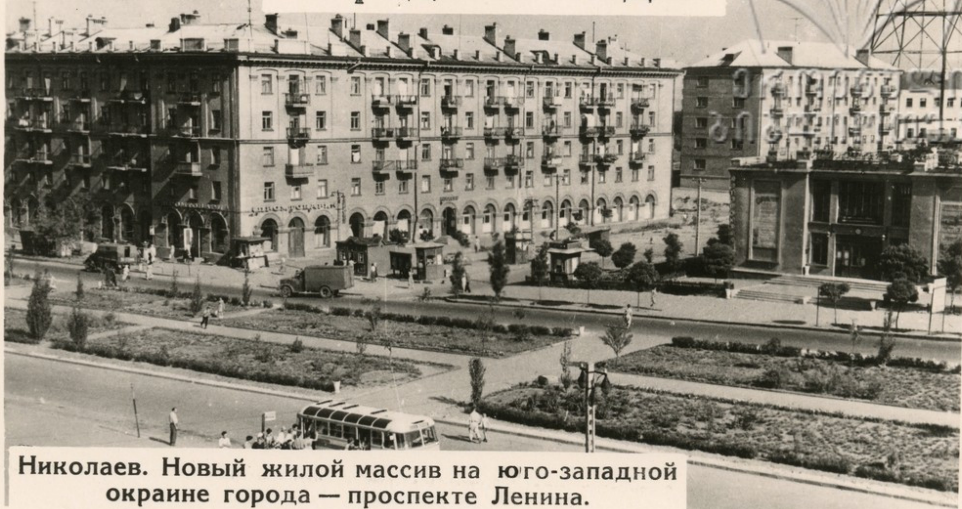
Николаев. Новый жилой массив на юго-западной окраине города — проспекте Ленина.

За последнее десятилетие в городах и рабочих поселках нашей страны построено более 17 миллионов квартир, а в сельской местности — около шести миллионов домов. В новые дома переехали и улучшили свои жилищные условия 108 миллионов человек — почти половина всего населения Советского Союза.