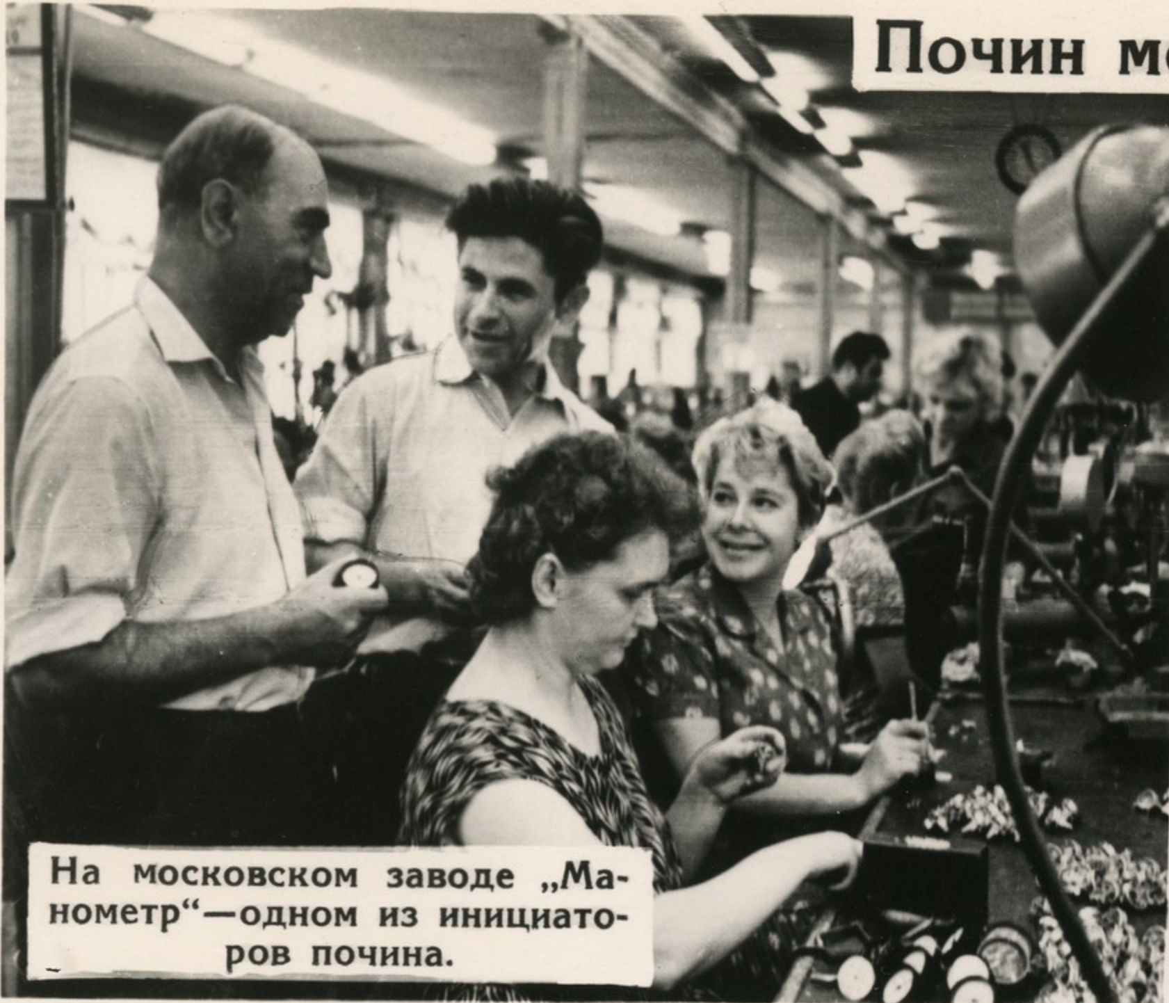
На московском заводе „Манометр“—одном из инициаторов почина.

Каждое изделие сделать безубыточным! Такой клич бросили коллективы пятнадцати предприятий столицы. Почин москвичей горячо поддерживают труженики нашей страны. Рабочие и специалисты выступают в большой поход за дальнейшее совершенствование производства, за его полную рентабельность.