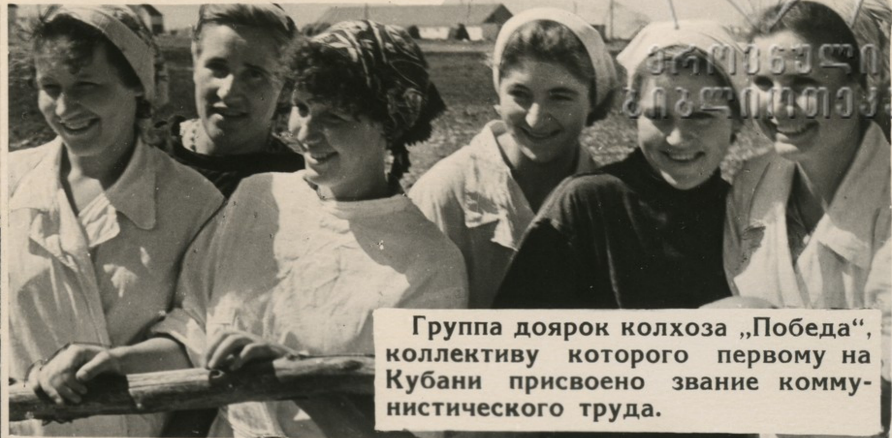
Группа доярок колхоза „Победа“, коллективу которого первому на Кубани присвоено звание коммунистического труда.

Все лучшие черты и качества советского человека проявляются во всенародном движении за коммунистический труд. Здесь и борьба за высокую производительность труда, за овладение новейшей техникой, за стремление к образованию. Здесь и новые отношения между людьми, утверждающие моральный кодекс строителя коммунизма.