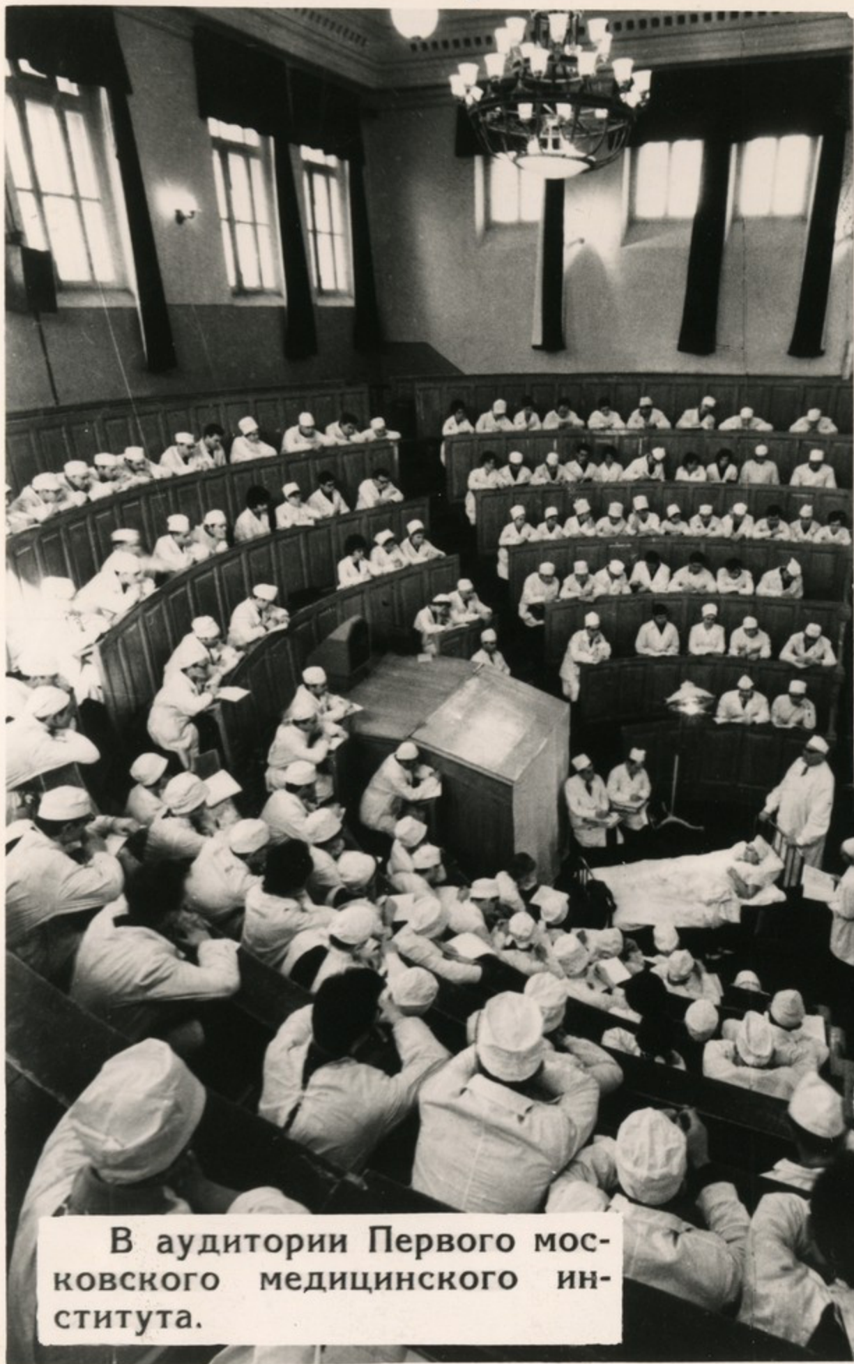
В аудитории Первого московского медицинского института.