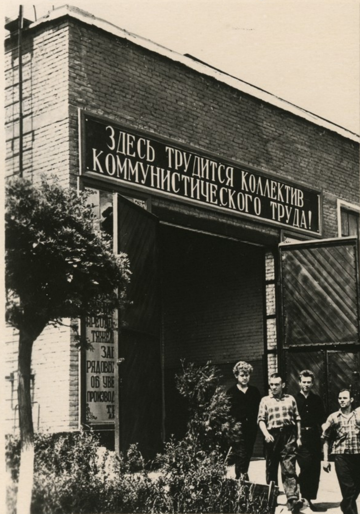
Группа рабочих механического цеха, завоевавшего звание коммунистического труда (Георгиевское арматурное производственное объединение Ставропольского края).