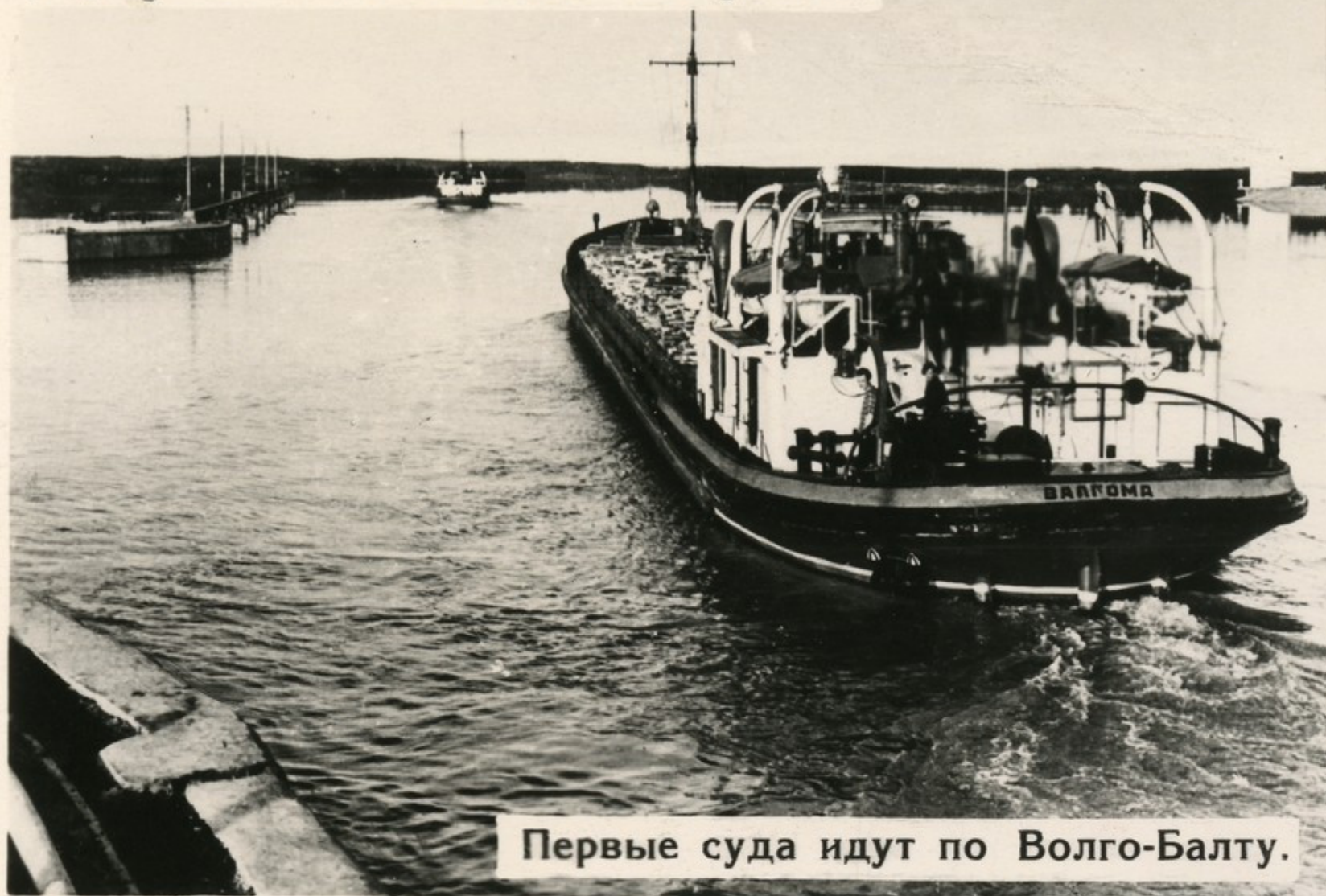
Первые суда идут по Волго-Балту.

Начал свою большую жизнь величайший транспортный конвейер — Волго-Балтийский судоходный канал протяженностью 361 километр. Новая глубоководная магистраль даст возможность организовать бесперевалочную транспортировку важнейших грузов между портами пяти морей — Белого, Балтийского, Каспийского, Черного и Азовского.