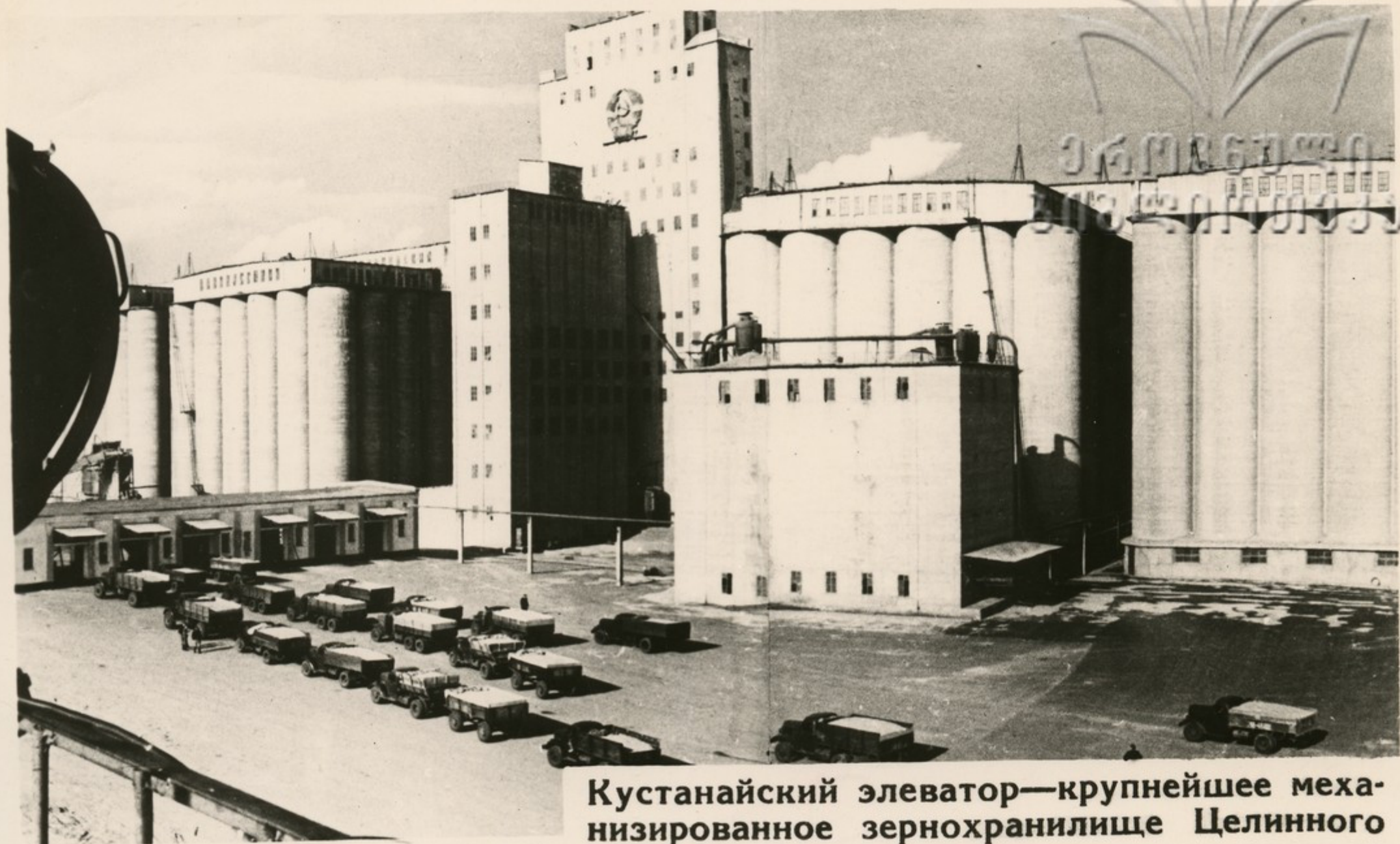
Кустанайский элеватор—крупнейшее механизированное зернохранилище Целинного края.

Это было в 1954 году. В те зимние и метельные дни по стальным магистралям нашей страны шли поезда на восток. Родина посылала своих лучших сынов и дочерей на освоение новых земель.