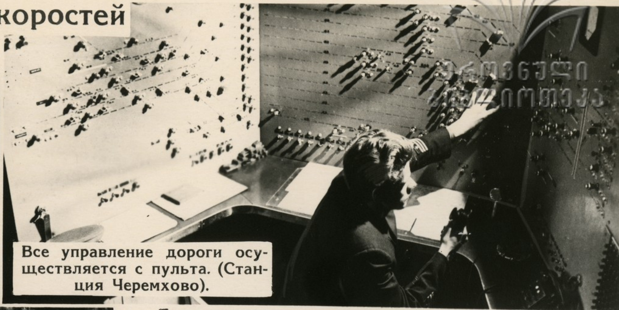
Все управление дороги осу- ществляется с пульта. (Стан- ция Черемхово).

Громадные изменения произошли и на транспорте. Если в 1953 году протяженность дорог, переведенных на электрическую и тепловую тягу, равнялась девяти тысячам километров, то сейчас—почти семьдесят тысячам.