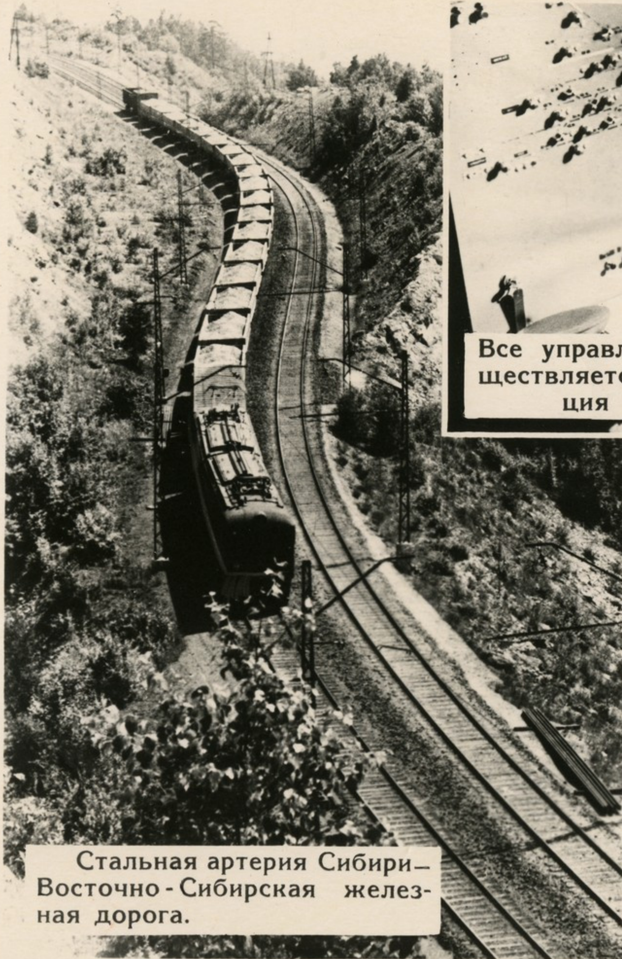
Стальная артерия Сибири— Восточно-Сибирская желез- ная дорога.