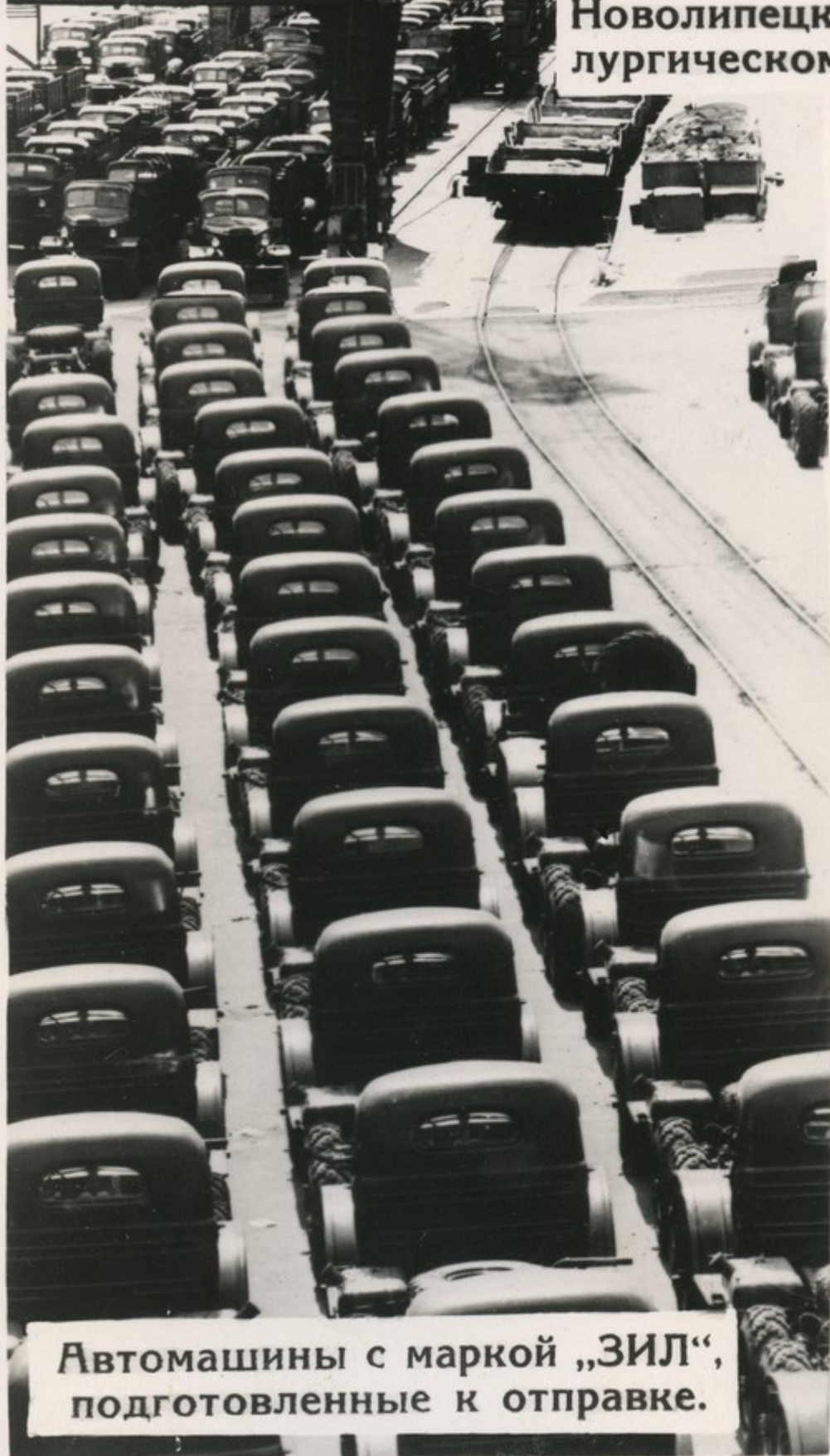
Автомашины с маркой „ЗИЛ“, подготовленные к отправке.

Наша партия проявляет неустанную заботу о развитии экономики, неуклонно руководствуется ленинскими указаниями о том, что „главное свое воздействие на международную революцию мы оказываем своей хозяйственной политикой“.