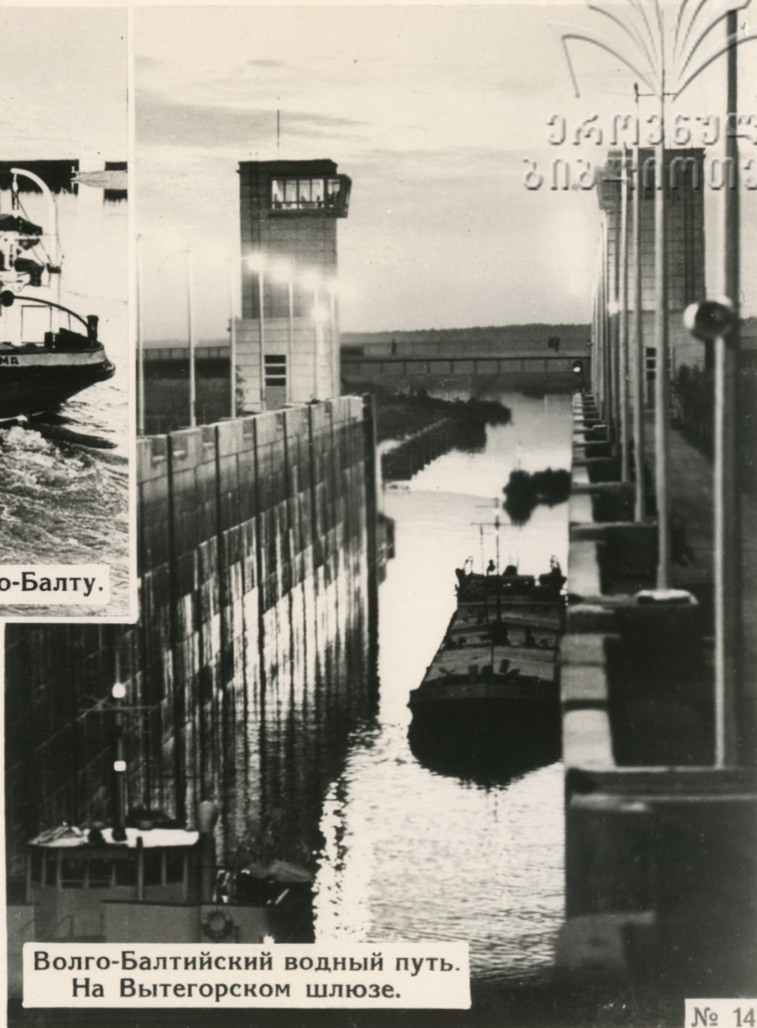
Волго-Балтийский водный путь. На Вытегорском шлюзе.

С начала навигации 1964 года по каналу уже проследовали тысячи судов.