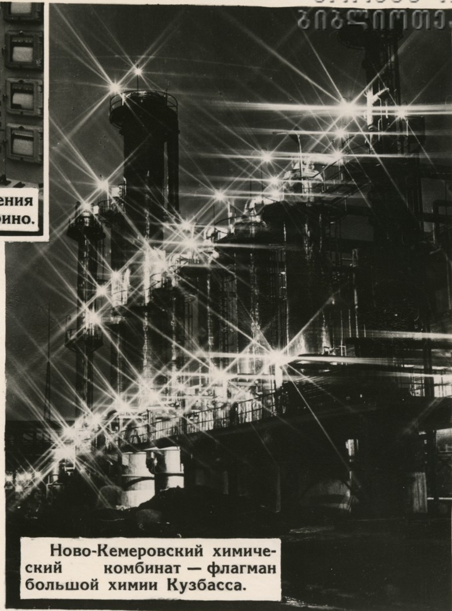
Ново-Кемеровский химический комбинат — флагман большой химии Кузбасса.

Осуществлена коренная реконструкция всех отраслей народного хозяйства на базе современной техники, произошли качественные изменения в структуре народного хозяйства, ускоренными темпами развивались наиболее прогрессивные его отрасли — энергетика, химия, электроника, машиностроение и другие.