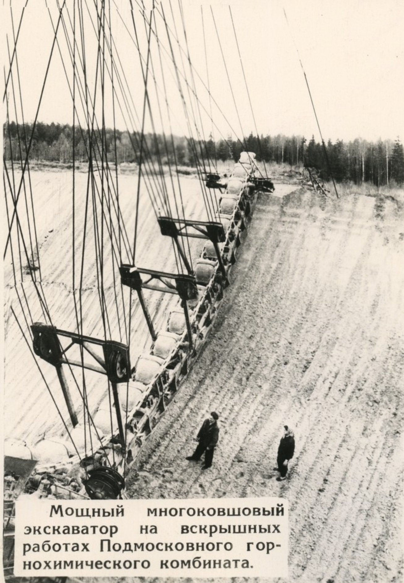
Мощный многоковшовый экскаватор на вскрышных работах Подмосковского горнохимического комбината.

На карте семилетки яркими значками отмечены стройки предприятий большой химии. За последние пять лет в эту отрасль вложены средства, почти в полтора раза превышающие капитальные затраты за все предшествовавшие этому 40 лет Советской власти.