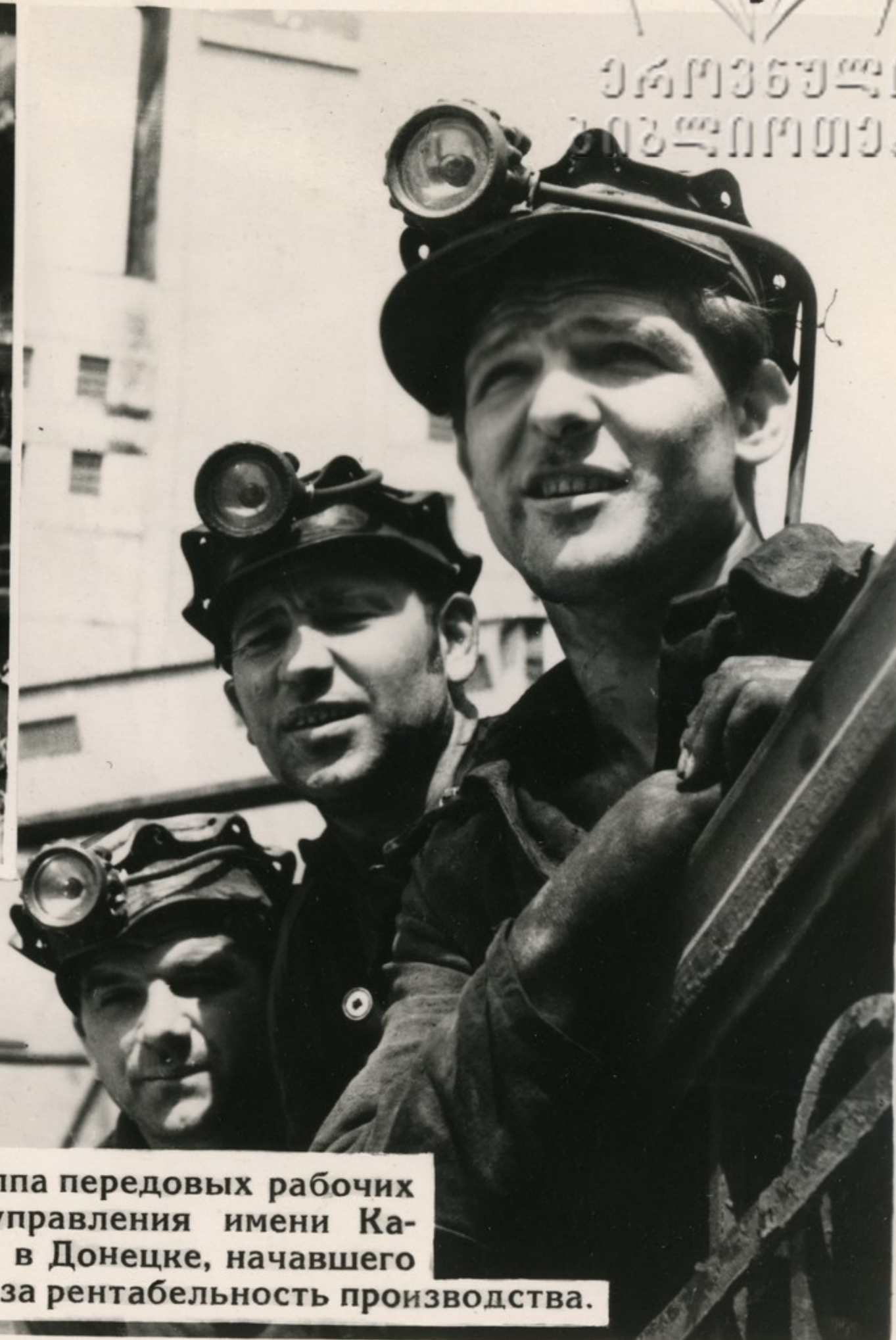
Группа передовых рабочих шахтоуправления имени Калинина в Донецке, начавшего поход за рентабельность производства.