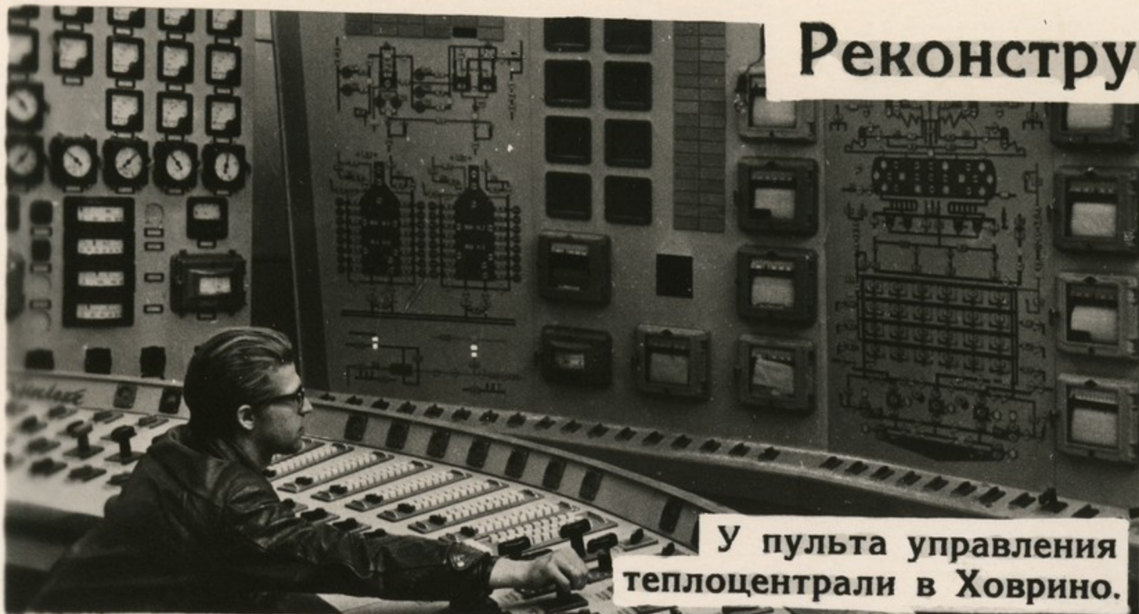
У пульта управления теплоцентрали в Ховрино.

Годы и десятилетия творческого созидательного труда возвеличили нашу Родину, подняли ее на небывалую высоту. Пройден огромный путь — от лучины до гигантских электростанций, от сохи до космических кораблей. Особенно отрадны итоги последнего десятилетия, отмеченного невиданным взлетом народной энергии.