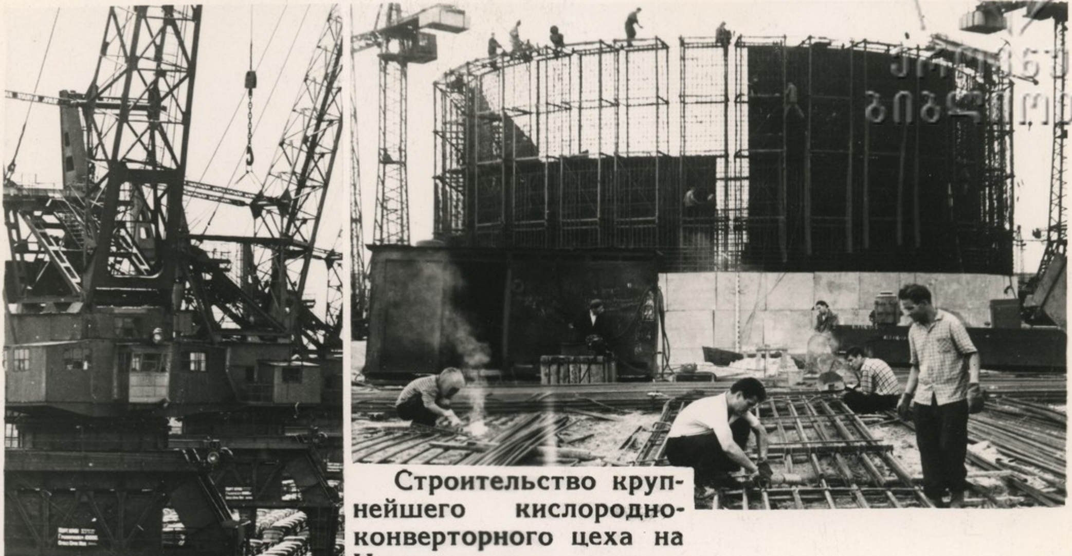
Строительство крупнейшего кислородно-конверторного цеха на Новолипецком металлургическом заводе.