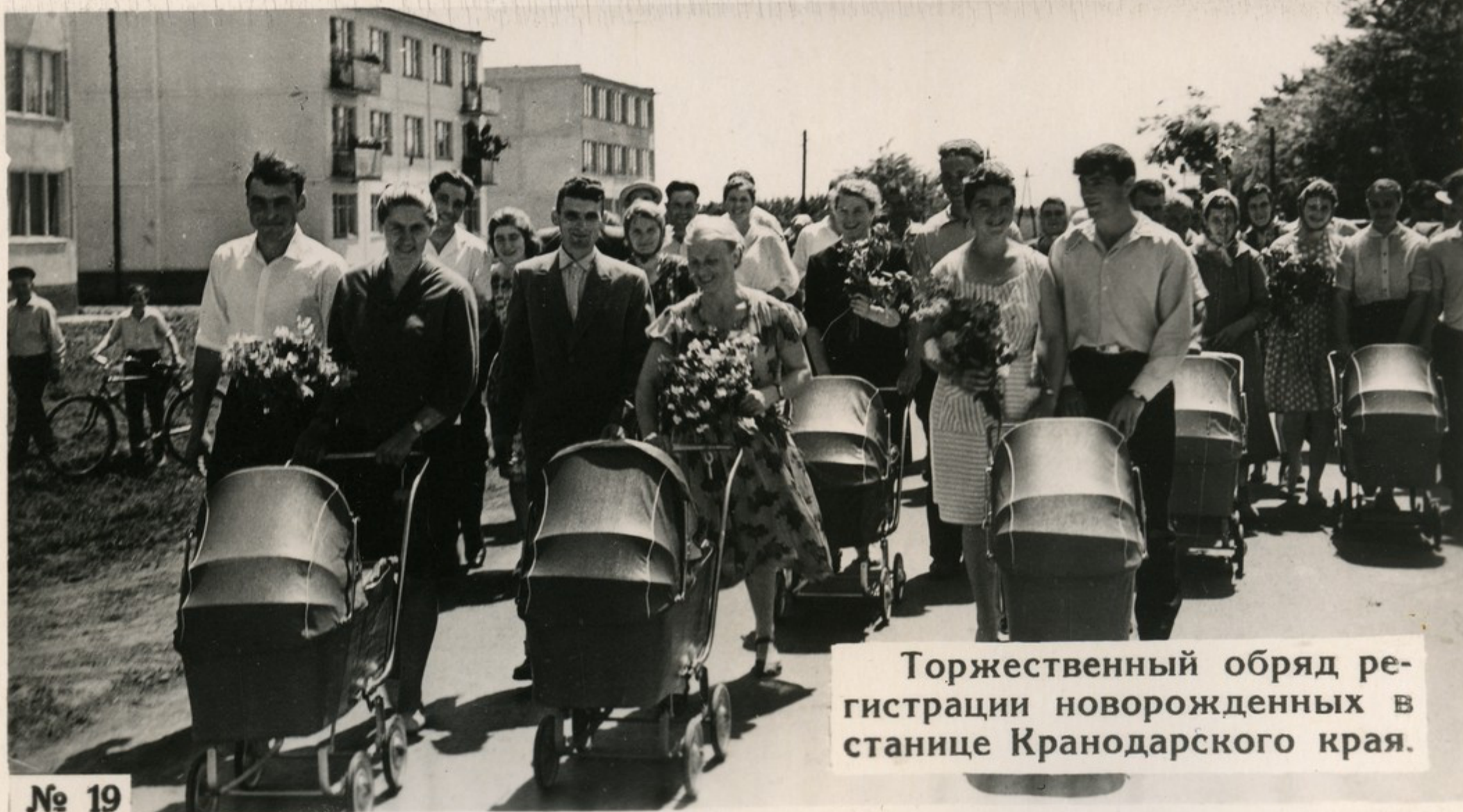
Торжественный обряд регистрации новорожденных в станице Краснодарского края.