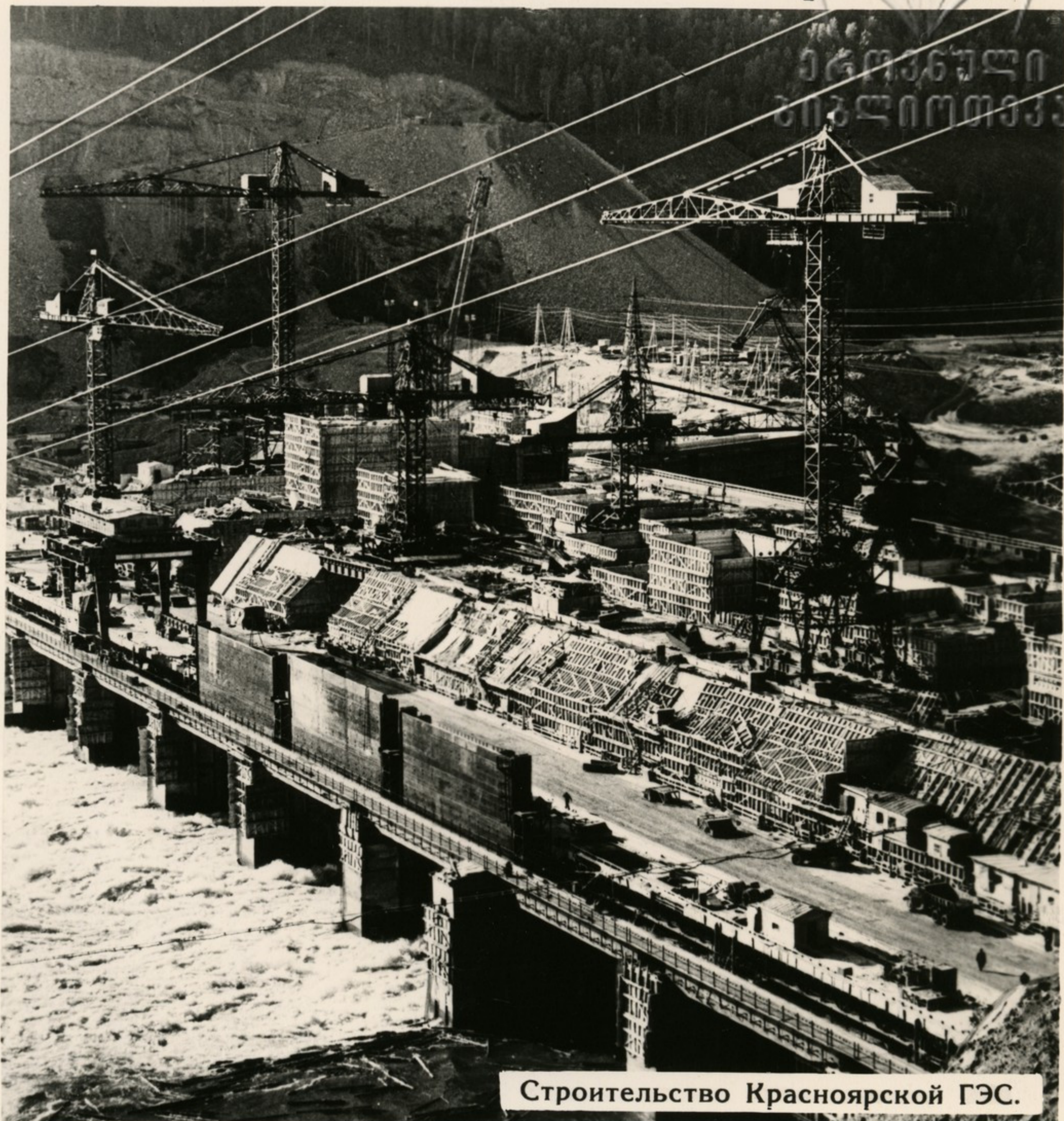
Строительство Красноярской ГЭС.

Претворяя в жизнь ленинскую идею электрификации, партия и правительство обеспечили ускоренное развитие энергетики на новой технической базе. Осуществляется курс на преимущественное строительство мощных тепловых электростанций и высокоэкономичных гидроэлектростанций. Только в 1963 году было выработано 412 миллиардов киловатт-часов электроэнергии, введено в действие более десяти миллионов киловатт новых мощностей, это больше, чем было введено за все годы довоенных пятилеток.