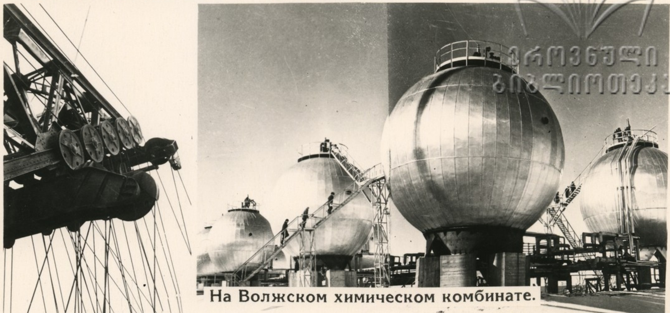
На Волжском химическом комбинате.