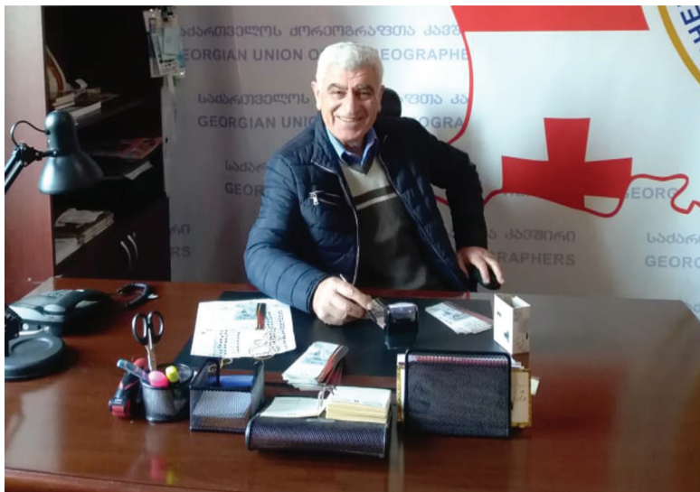
ცნობილ პიროვნებას, რაჭული ფოლკლორის უბადლო