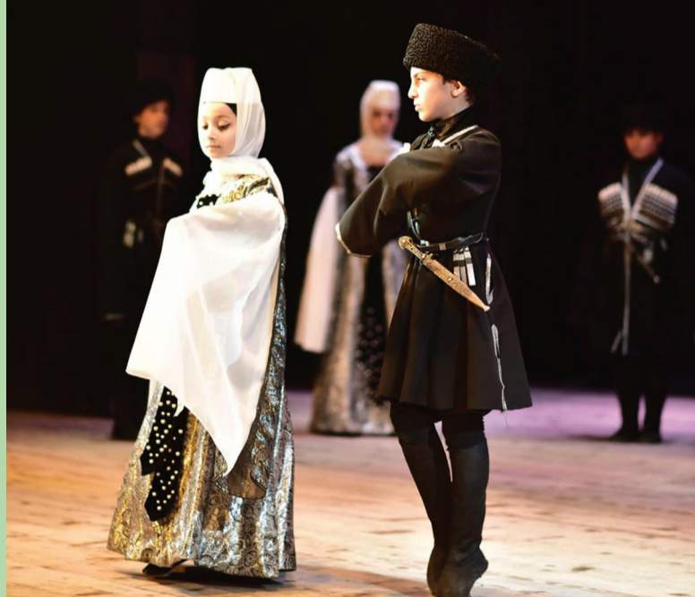
დეს ძალისხმევას ახმარს ცეკვა „ბერქალურის“ აღდგენა-დამუშავებას. 2003 წელს რ. ბერაძე საცხო-

პყვა ბავშვთა ქორეოგრაფიული ანსამბლის „ივერიელების“ ჩამოყალიბება. აღნიშნულმა ანსამბლმა დიდი წარმატებით მოია-