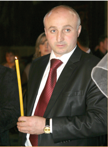
არიან ადამიანები, რომელთა საქმიანობა განუზომლად ამაყვებს ჩვენს ყოველდღიურობას. ამის გამო, რომ მათი გარდაცვალება და