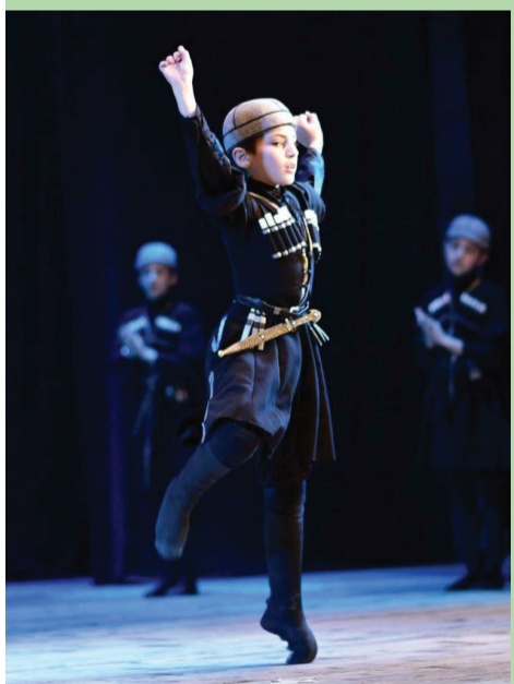
მცოდნეს, ქორეოგრაფთა და მოცეკვავეთა თაობების აღმზრდელ პედაგოგ-ორგანიზატორს, პოეტს, მუსიკოსს, ქვეყნის ბედ-