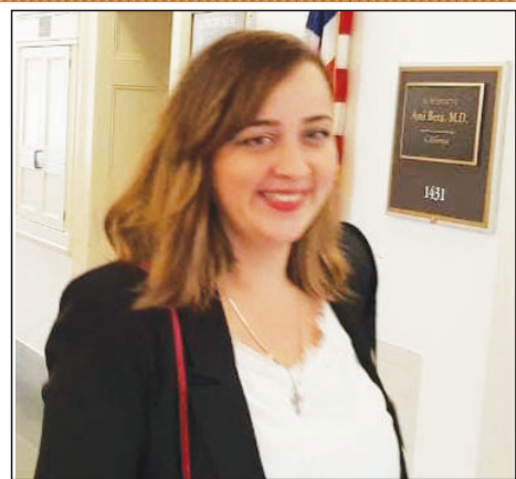
ბილოცავთ ახალ 2020 წელს და შობის ბრწყინვალე დღესასწაულს. ბისურვამთი ჯანმრთელობას, მშვიდობას, სისარულსა და ბედნიერებას. პატივისცემით, მარი ჩხიკვიფილი საკრებულოს „ქართული ოცნება-დემოკრატიული საქართველოს“ თავმჯდომარის მოადგილე