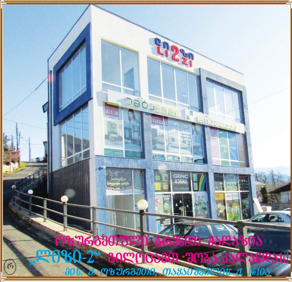
ოფიციალური გენდერული მკვლელობა „ლიზი-2“ გილდონაში - შობა-კალანდას! მის: ქ. ოფიციალური, თაყაიშვილის ქ. №105