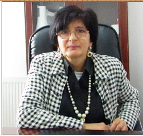
სურსათის გურიის რეგიონული სამმართველო ბილოცავთ შობა-ახალ წელს! ბისურვამთი მშვიდობას, სიყვარულს, წარმატებას ჩვენი მშენის სამეტილდემოდ. მანანა მრძობაიფილი, სურსათის მრეწველი სააგენტოს გურიის რეგიონული სამმართველოს უფროსი