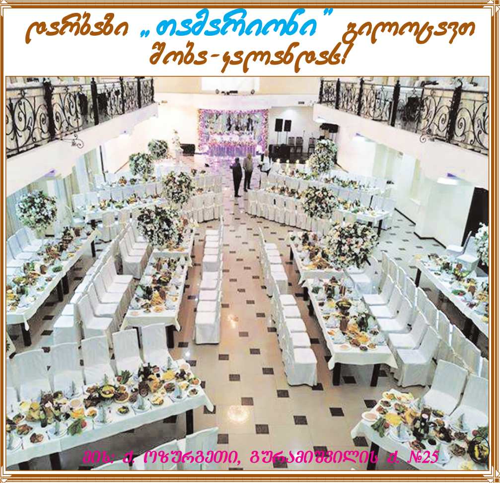
ქართული „თამარია“ გილდონაში შობა-კალანდას!