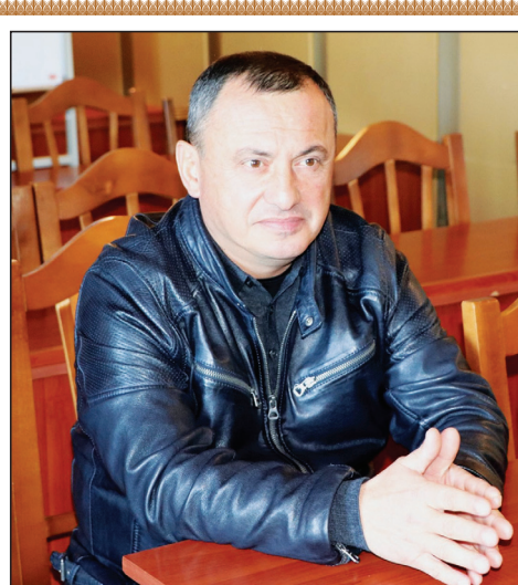
გულა (ტარიელ) არუშიძე ფრანცია „ქართული ოცნება-დემოკრატიული საქართველოს“ თავმჯდომარე