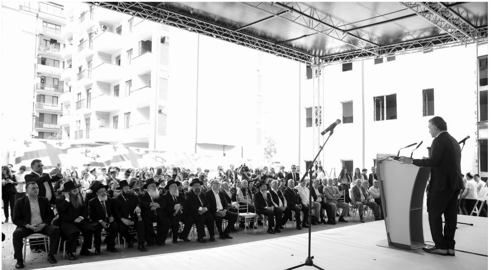
2019 წლის 2 მაისი, სკოლის მშენებლობის დამთავრებისადმი მიძღვილი ცერემონიალი.

გაზეთის გამოსვლის წინა დღეს — 26 სექტემბერს თბილისის ებრაულ სკოლაში სასწავლო წელი დაიწყო.