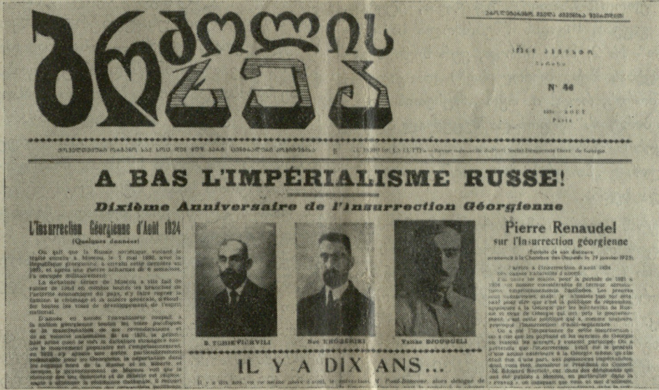
28 აგვისტოს აჯანყების ათი-წლის თავზე—1934 წ. სოც.-დემოკრ. „ბრძოლის ხმა“ (№ 46, იხ სურათი) აღიარებდა ბრძოლას ბოლშევიზმთან და ამავე დროს ეროვნულ ბრძოლას რუსულ იმპერიალიზმთან. ის დაადებდა: A bas l'Impérialisme Russe (გარტყლება იხ. მესამე გვერდზე)

ღარწმუნებულნი, რომ ასე უნდა იფიქ-როს, იქრძნოს და იმოქმედოს ყოველმა ქა-რთველმა, თამაზად ვიმეორებთ: „ქართავო დეილენდა ისტ“, რომ საქართველო - კავ-კასიამ, როგორც აკვანმა ცივილიზაციისა,