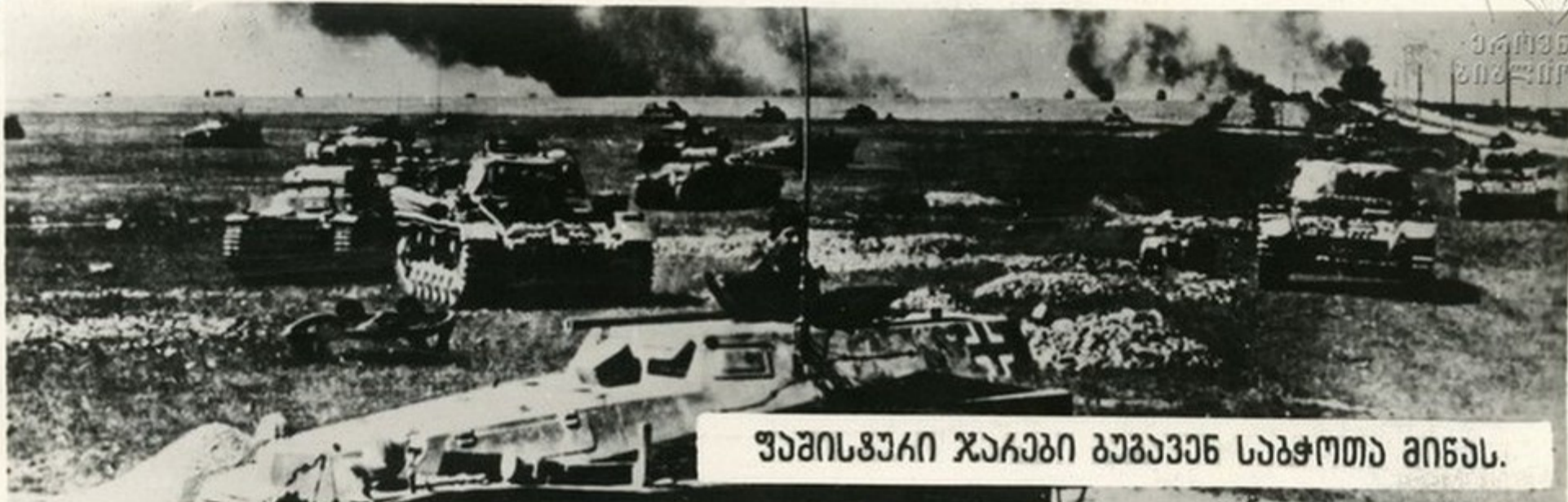
შაშისვუკი ჯაგები ბუგავენ საბჭოთა შინას.