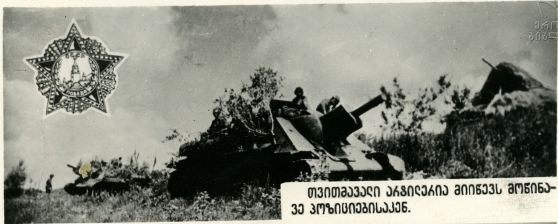
თვითმავალი ავიაციის მიმართ მონივრულად ვიზუალური მონიტორინგის უზრუნველყოფა.