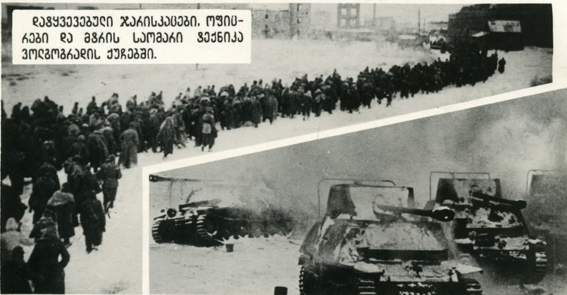
ღირს ბრძოლები, რომელიც გაჩაღებული იყო ვოლგაზე და მგის ვვო- ვასის აღყაბამოწყებითა და ლიკვირდებით დამთავრდა, სავაშითა აკიითა მიქალნი ძიკაულ გარდაცემან ღირს სამხარო და მთელი მყოფი მსოფლიო მთის მსვრდომებში.