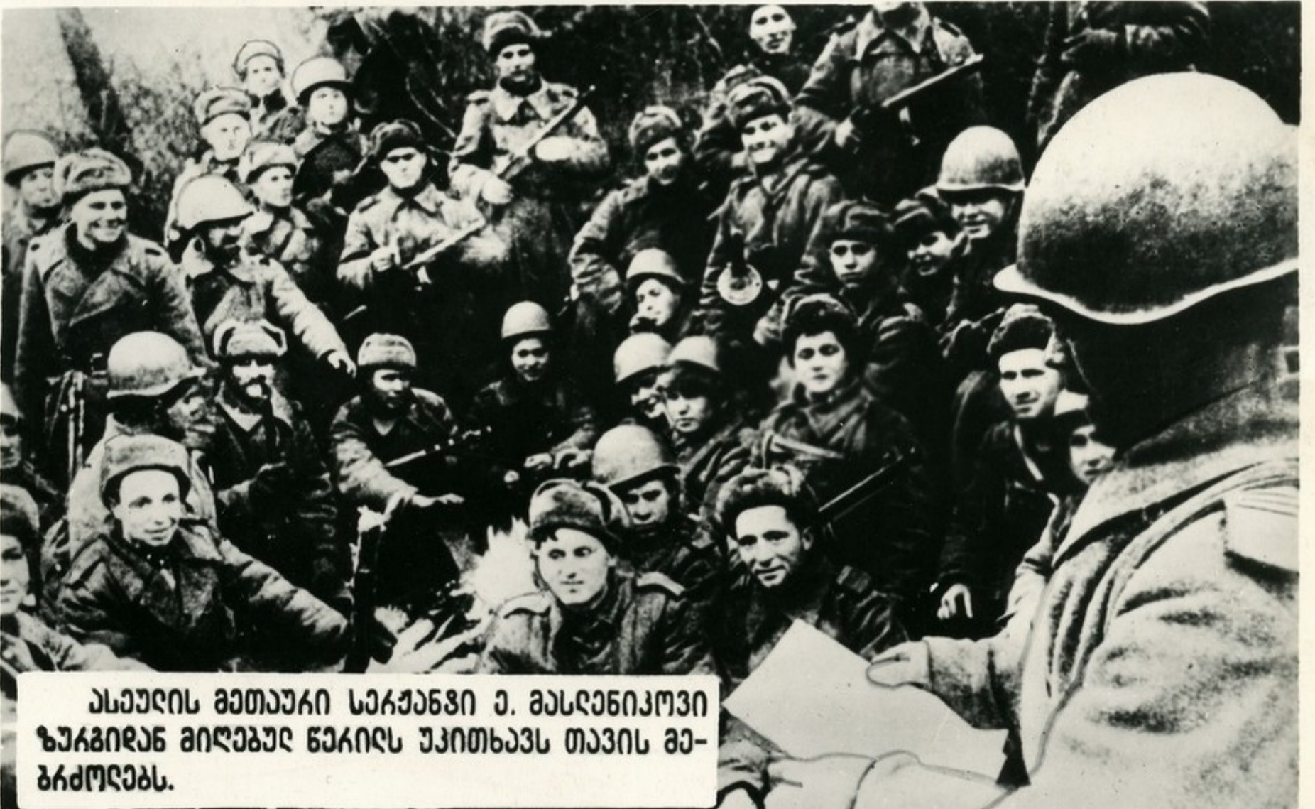
ანდრის მეთაური სეჩენი ე. მანდანიკოვი ზუგრიან მიღება ნაიღს უკითხავს თავის მე- ბრძოლებს.

სამხრეთის დასავლეთი პიკვი კიბეები მუდამ იყვნენ კომუნისგები და კომპანებიკა- ლები. თავისი პიკარი მებრძოთით ისინი გეიკომბასა და მებრძობას ნაკბავრნან მემბაკითა გებუი. საუკეთესო არებინანებს იღებრნან პაკვიის კიბეებუი. მთის პაკვიორუი 5300 ათას კასუბა მებუი იქნა მიღებუი პაკვიის ნებკომბის კანრიღავარ და 3600 ათასუბა მებუი პაკვიის ნებკარ.