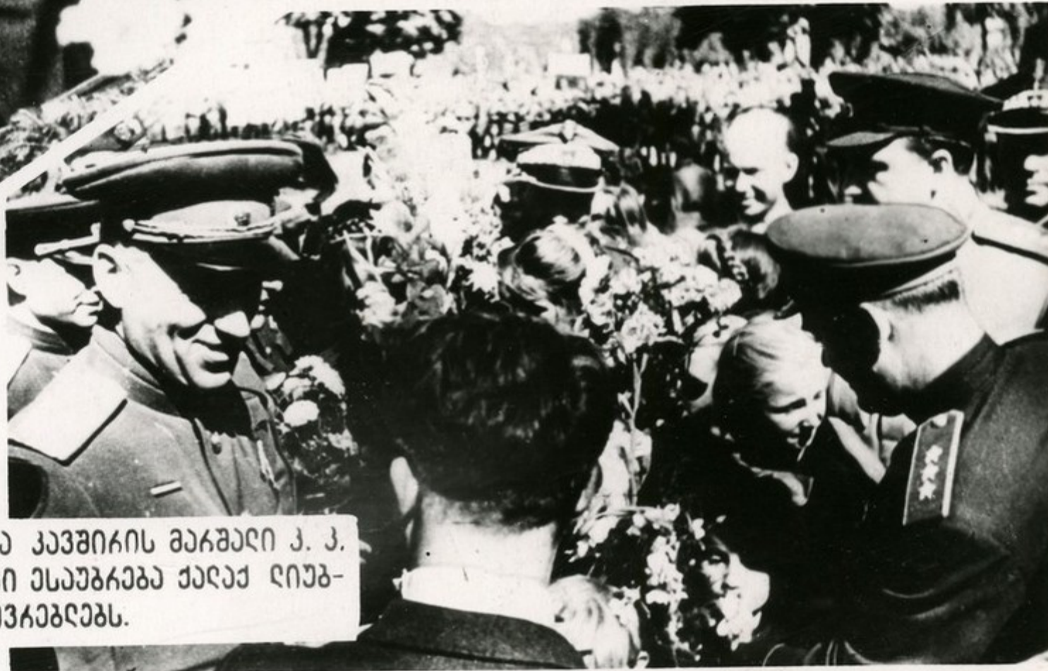
საბჭოთა კავშირის მთავარი ვ. ვ. კომანდირი ესაუბრება ქალაქ დიუბ- ლინის მცხოვრებლებს.

თმის მსვლელობები განუწყვეტლივ სრულდებიან ხდებოდა საბჭოთა სამხედრო ხელმძღვანელები. ჩვენმა სამხედრო კარგებმა, რომლებმაც კომანდირული პარტიის ხელმძღვანელებმა, აჩვენეს თავიანთი სიბრძნე და დიდი სამხედრო მუშაობის ხოცხუცხუცის უნარი.