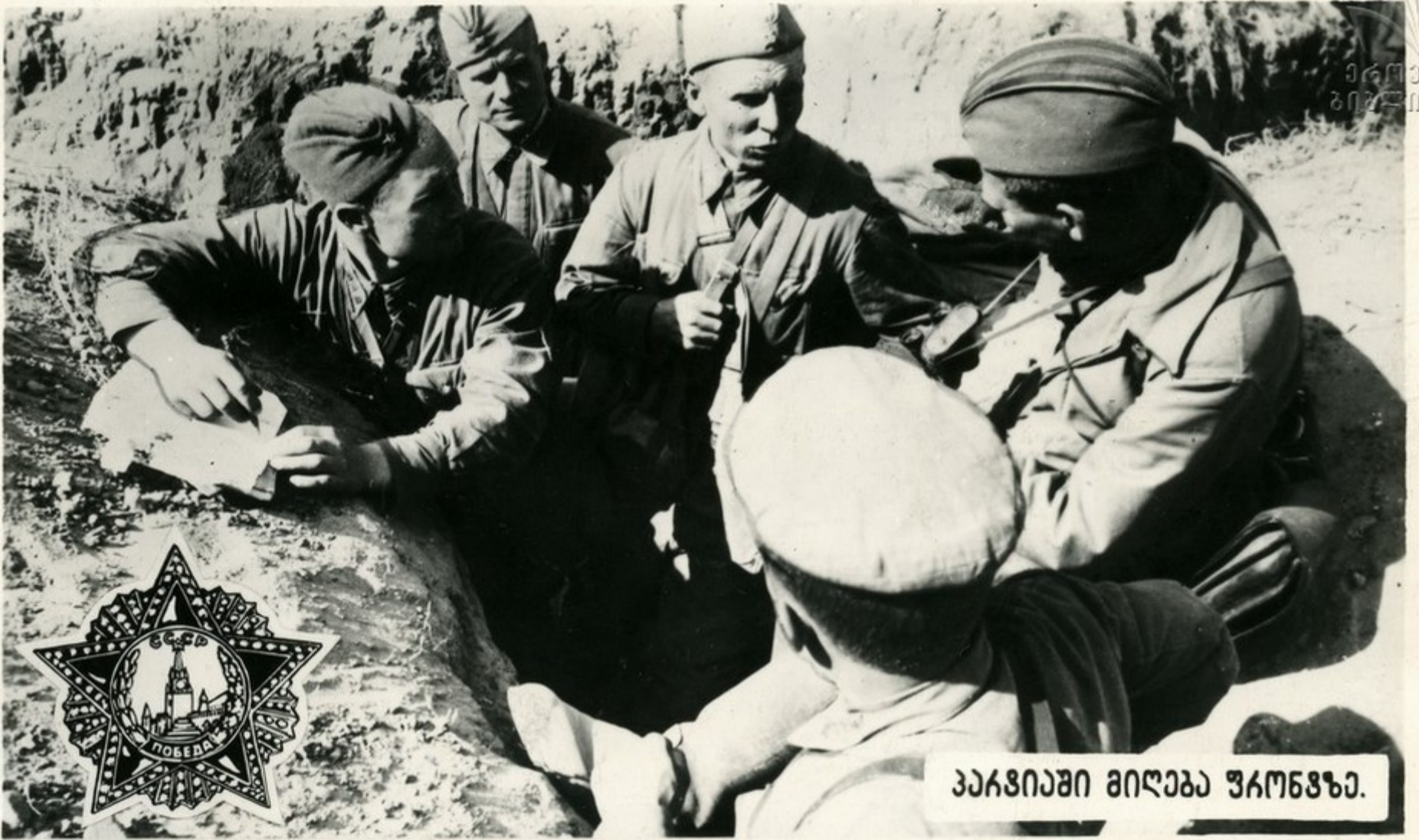
პაკვიანი მიღება უკონფსა.