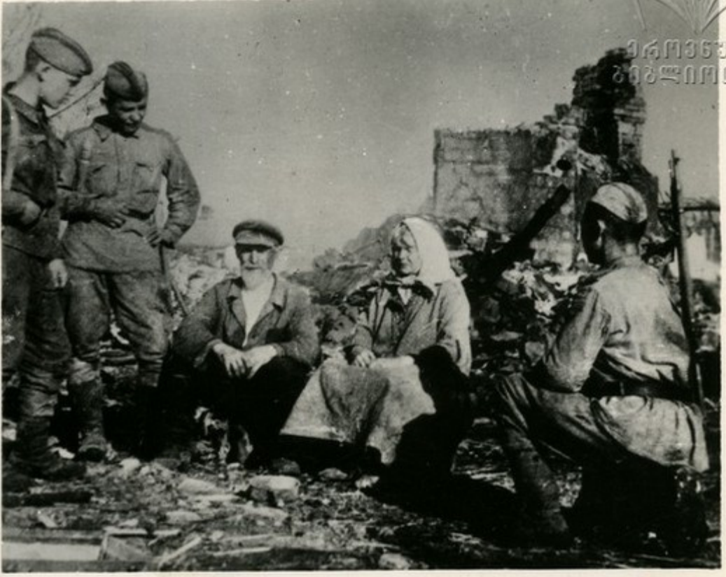
კორბეუჩნე ანრჩაევები სოჟიე ჩან- ნოეღან მონთხრობენ თაჟინანთ ბაბა- თაჟინსუღებღებს, თუ ჩოგორ ბერებუ- გენ ჟაჟინსვაგბა უკან რახეჟინს რჩოს მეთი სოჟიედი.