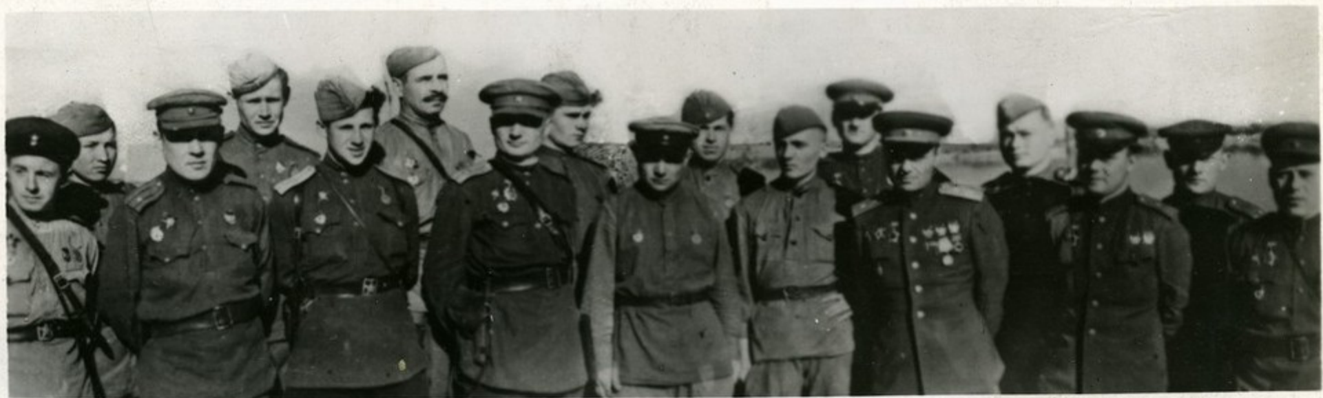
მომავალი ჯგუფი, რომელთან დნეპრის გარდაღებისათვის მიენიჭათ საბჭოთა კავშირის მშვიდობის ნიშანი.

გამდებოთ გავიხსენს ან მზარის თავერდებზე, საბჭოთა ჯარებზე ეართი შეფარებით გარდაღებენ დნეპრი—ეს უღირესი საბრინაომ რაბაკომდებე. ეარუეარს ეარ შეეძლო რვენი შემოგარების შეჩეარებე, ვეშისვარე ჯარები ეართ რაბეარსებებს შემოარეზე გენიხღირდენ.