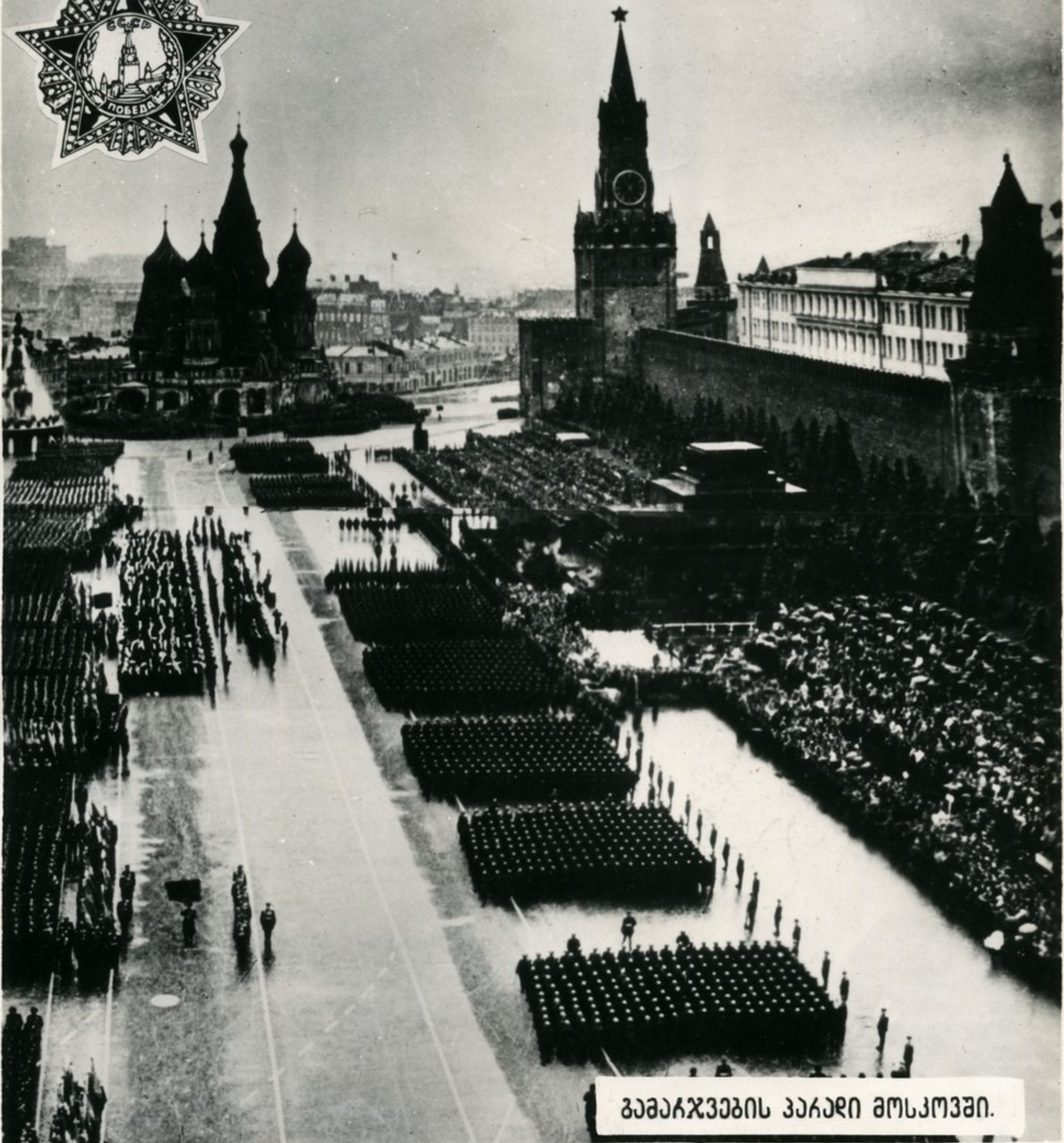
გამაჩვენების პაარდი მოსკოვში.

საბჭოთა არმიის მთავარი პივიდუარდი გამაჩენიის განარგუარება მსოვლიმოს ხარხები იხს- ნა ვარუიზისარება, ხარდი შეუწყო სოხიარდისვარკი განაკის შექმნას, არკონარ-გამათარვისარუ- დებარდი გარმოდის განარქვიარებას კომოდინარ და დარმოკირდებარ ქვეყნარებში, უარვენა მთარდ მსოვ- ლიმოს რვენდი რიარდი სარემოგაროს სოხიარდისვარკი წყომგირდების სიმოხხარდისარენარკიარემოგა და უპირარგარემოგა.