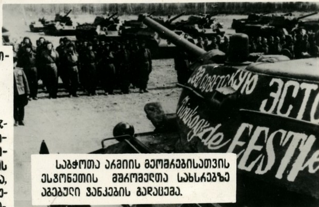
საბჭოთა არმიის მაროშარბისათვის ესვონათის მაროშელთა სარსარბა აგებელი ვანკების გარდასა.

საბჭოთა ჯარების გაბარჯ- ვაბანი ვოღბაზა, კუასკის მი- სარგომებთან და სხვა ბრძო- ლებში შარავი იყო ზარბის შაროშელთა გმიარლი შაროშისა, გარგინის ჭაშმარჩვარ შიგანვუ- არი ოგბანიზავოარული შუშარ- ბისა შინარალეზადი ძარღბის განმგვიცავისათვის, მართი გა- მარჯვებისათვის აუყიღებელი იარალით აღჭარვისათვის.