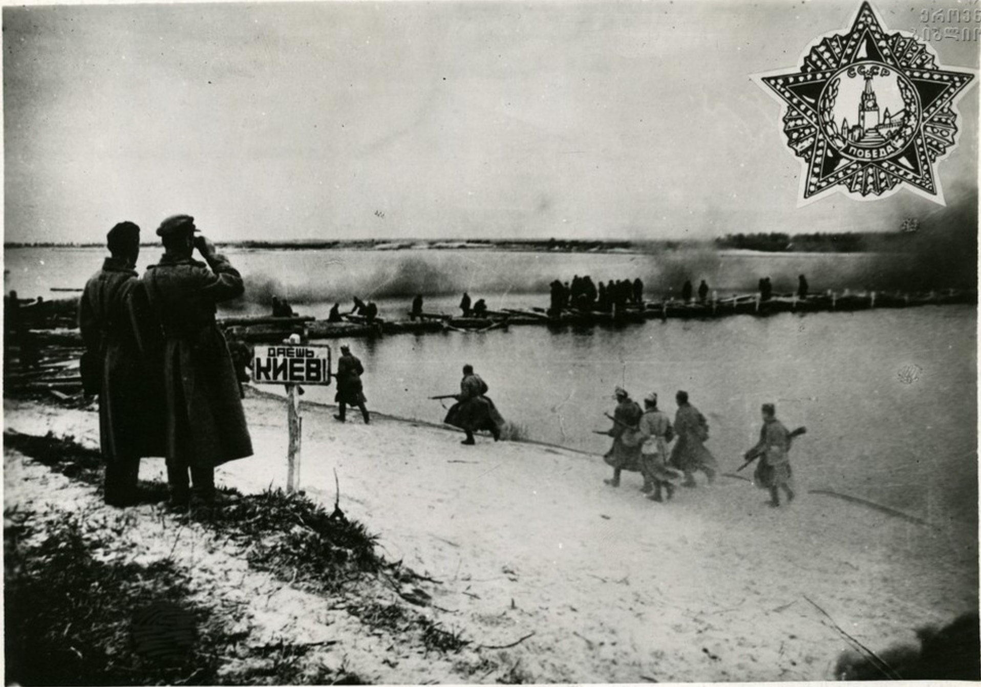
დნეპრის გარდაღებზე საბჭოთა ჯარების მიერ.