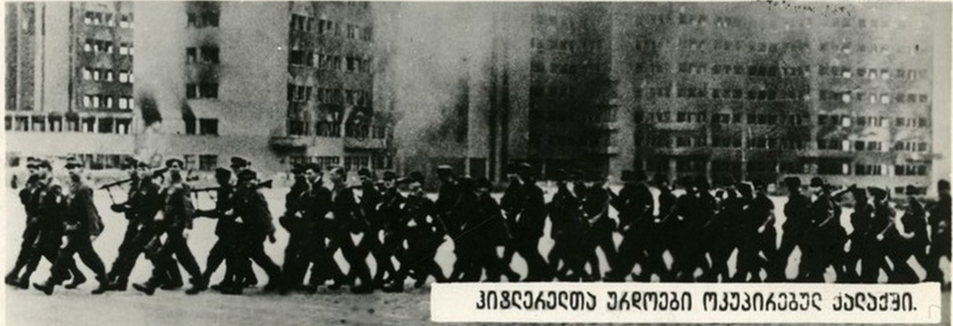
ჰიზდიაკელთა უაროები ოკუპირირებულ ქალაქში.