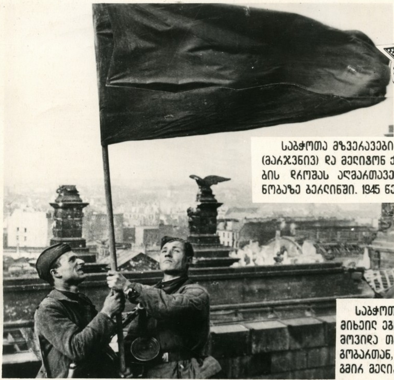
საბჭოთა მზვიაკვები შიხეირ ეგორივი (მეკჯენივი) რე მეღივონ ქენთეკიე გეგეკჯე-ბის რეოგენ ეღმეკთეკენ კეიხსვების მე-ნოგეზე გეკღინევი. 1945 წელი.