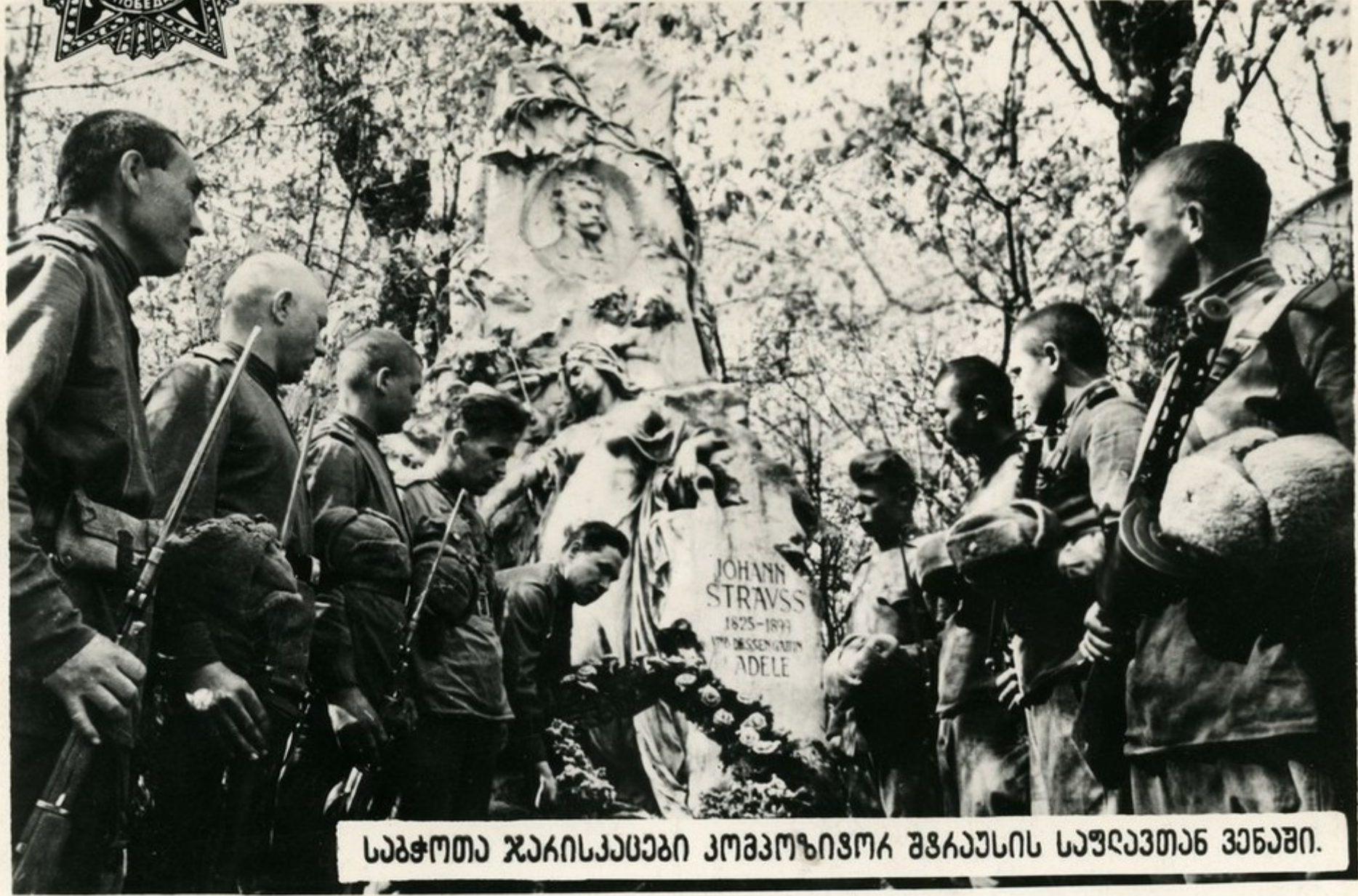
საჭოთა ჯაიისკაეები კოვოზიზოკა შგაეუსის საუღავთან ვენაში.

პარლემენტარული ინფორმაციონალიზმის პრინციპების ეკთბური საჭოთა აკშია მიიწევე- რა დასაუღეთისაქან, კოვოკს გეგეთავისუღებელი აკშია, მიიწევერა და თან მოქქონდა ევ- კოვის ხანებისათვის უაუისუვაი მოწოგისაგან გათავისუღება.