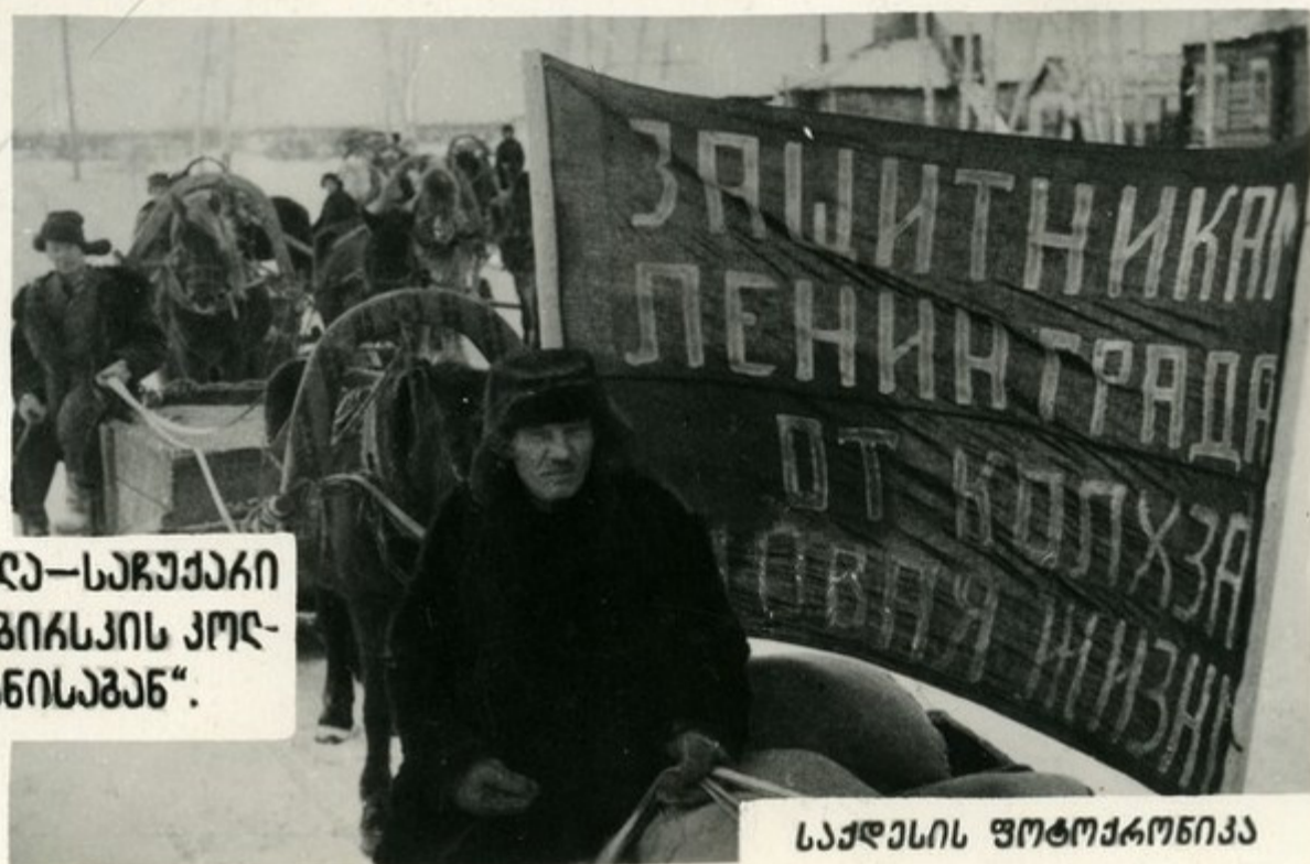
კუარით სავსე ოთხთვარა—სარუარარი ღანინგარღარღარ სოვოსიბიარსკის კოლ- მარჩანოშა „სოვარია ჭიზნისარბან“.