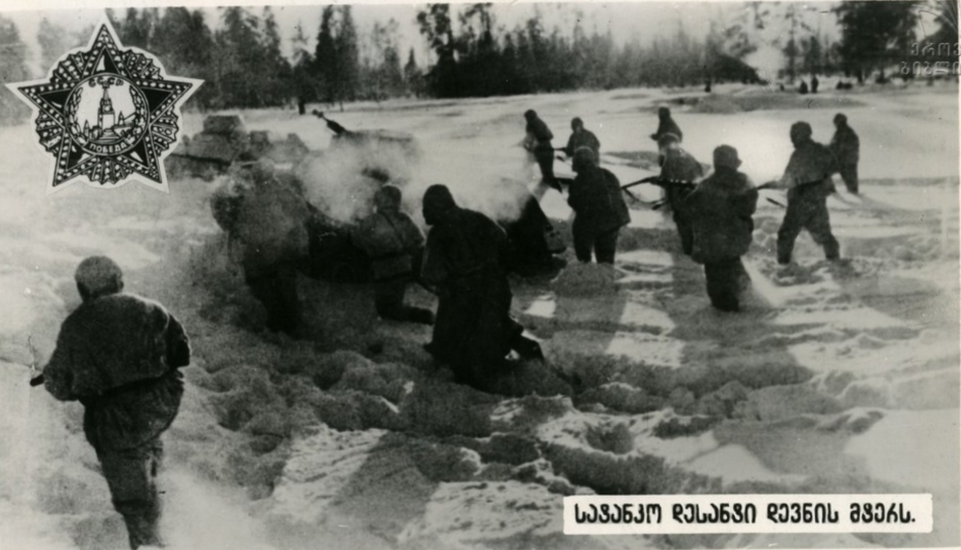
საჯანჯო რუსეთი რევინს მჭეას.