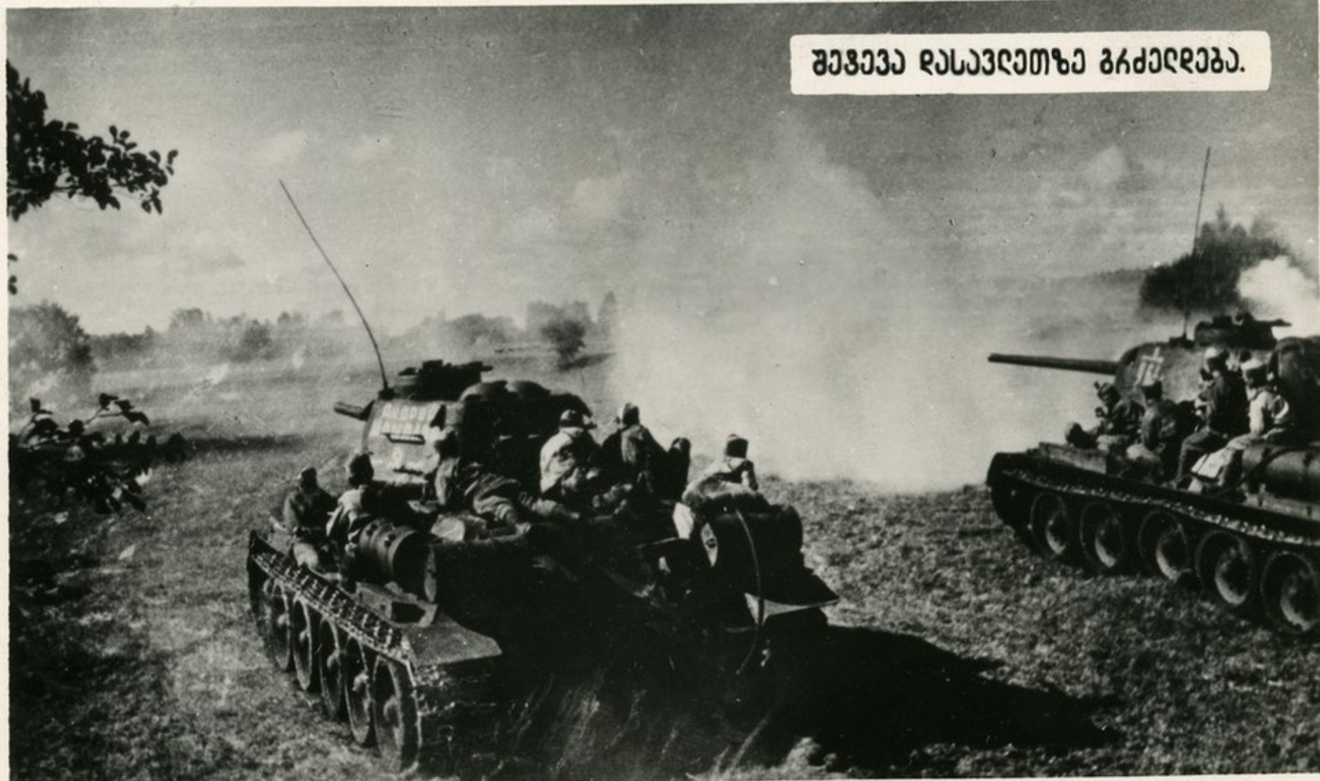
შეგევე რასავღეთზე ბჩქედღება.