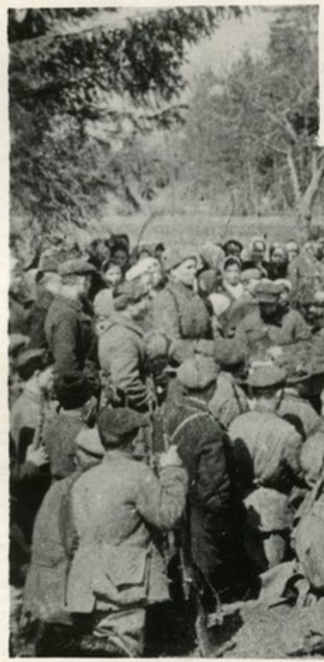
მეზინგი პარტიზანთა მხეკევი.

გეგეკევიის მიღნევი რირი კოლი შეასკუდა სუკათო-სუნდსო პეკიზანულდუ მო-ქეკოგე. პეკიზანევი ევეიუი დეგეკეგეს უნევენენ სეჭოთე ეკიენს მის სეკოლოლო მკეკევიევი, ძიკითერ გეკოლეგს ემოკერენენ მგკის რირი ძედევის ყუიერლეგეს, ეწყოგ-რენენ ლეგე კიირეგს მონინეალმდევის ზეკევი, სკოგენენ ეთესოგით ვიგდეკედს, უუსკე-ლეგევი ეგუნენინენენ მგკის ეთოგით ეველონს.