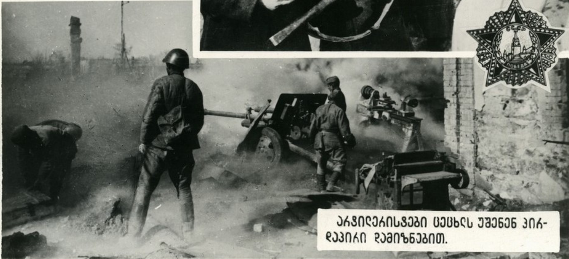
აკვირდებიან სხვებს უსაუბრებთან პირ- დაპირი დამინებებით.