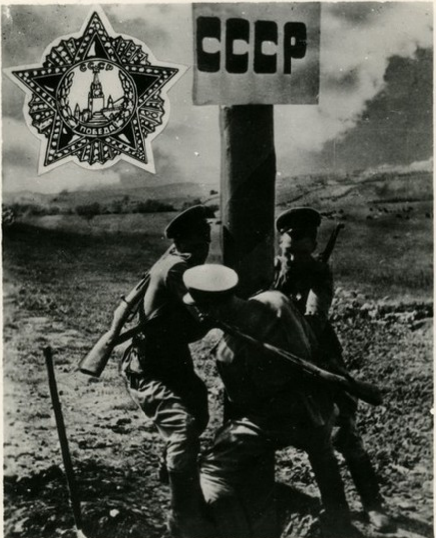
მეზღობრები რბაბენ სასაზღვრო ნიშანს.