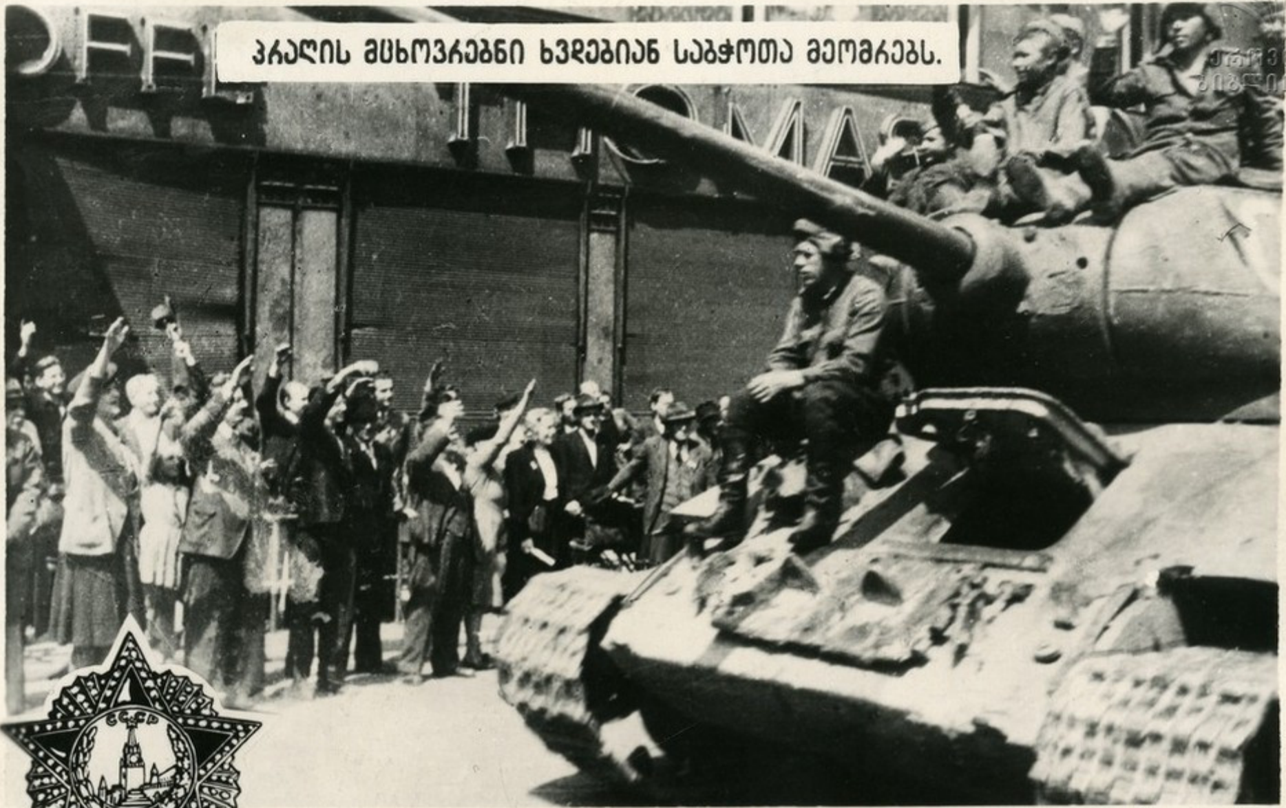
პარლის მსოფლიო ხვდებიან საჭოთა მეოხიებს.