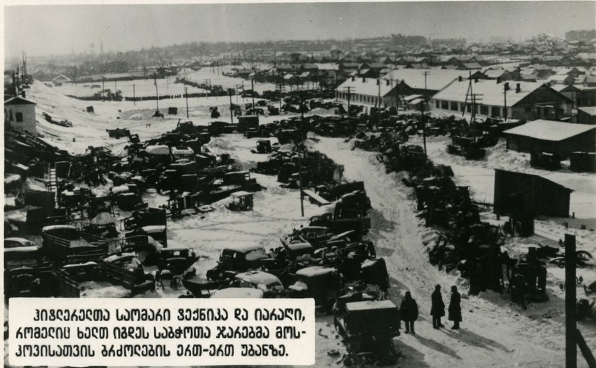
ჰივრეკადთა სამხაი ვეჩნიკა და იარაღი, რომელიც ხელთ იბრუნ საბჭოთა ჯარებმა მოსკოვისათვის ბრძოლების ერთ-ერთ უბანზე.

თავდასვით ბრძოლებში მგზისარში შეუპოვარი წინააღმდეგობის განხვით საბჭოთა არმიამ ჩაუშვა ჩვენი ქვეყნის „ელვისებური“ დაწყობის უაზრისფერი გეგმები. მოსკოვისათვის ბრძოლებში საბჭოთა არმიამ გააუმჯობესა მითი უაზრისფერ ჯარების უძლეველობის შესახებ. ჰივრეკადთა ვეჩნიკი, რომ სსრ კავშირის საზოგადოებრივი და სახელმწიფოებრივი წყობილება არ აღმოჩნდებოდა მგვიცა, ასევე ჩაიშვა.