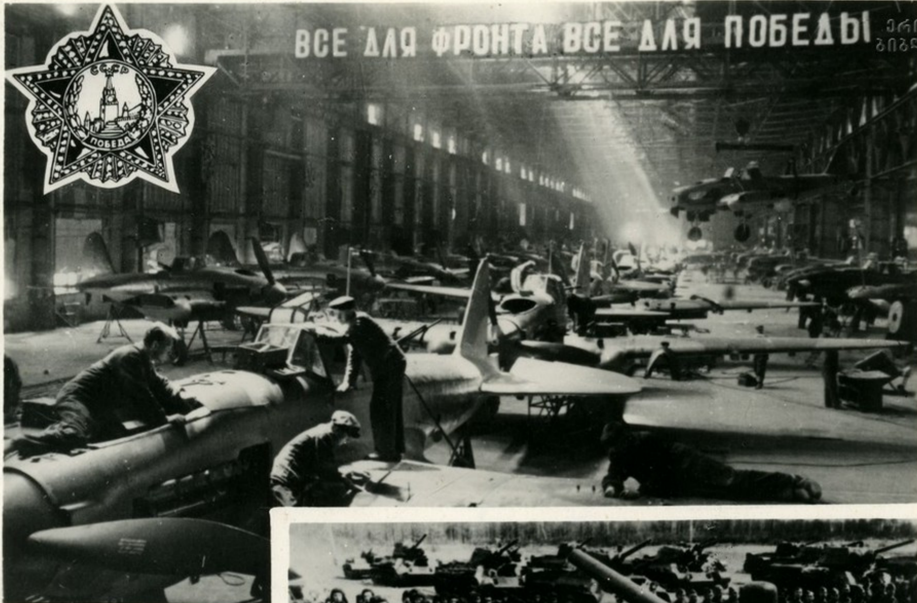
საჰაონვომ ბიბარა თვით- მზარნავ „ილიუშინი-2“-ის ანყოზაზა.

საბჭოთა ჯარების გაბარჯ- ვაბანი ვოღბაზა, კუასკის მი- სარგომებთან და სხვა ბრძო- ლებში შარავი იყო ზარბის შაროშელთა გმიარლი შაროშისა, გარგინის ჭაშმარჩვარ შიგანვუ- არი ოგბანიზავოარული შუშარ- ბისა შინარალეზადი ძარღბის განმგვიცავისათვის, მართი გა- მარჯვებისათვის აუყიღებელი იარალით აღჭარვისათვის.