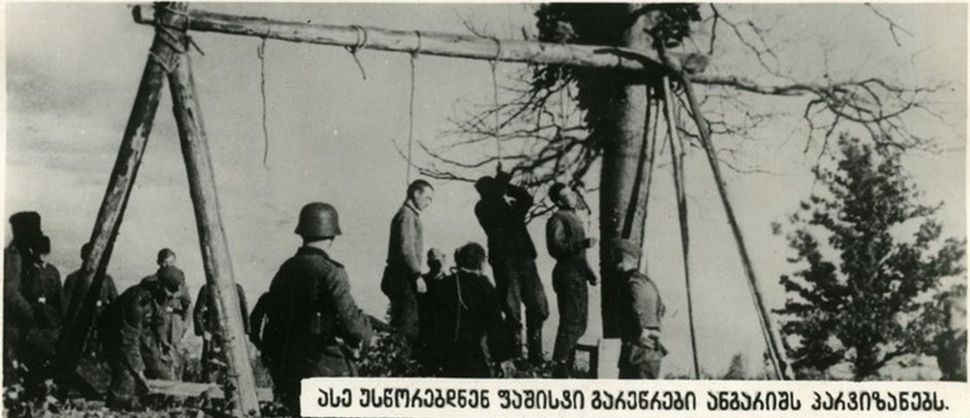
ესა უსწოკაბრენე შაშისვი ბაკენაკები ანბაკიშს პაკვიზანებს.

ღირი საგაბელო ოში უბძიბესი გაბოუსღა იყო საბჭოთა კავშირისათვის. უესაკი და მუხანათუკი თავრანსებით შაშისვუკა ბაკენაკი დააკლვია საბჭოთა არმიანების მშვიდობიანი, შამოქმედებითი შრომა და თავს მოახვია მათ გამანადგურებელი ოში. საბჭოთა ჯაგისოკიანე შემოჭაკილ ღირ საგანკო და მოვოკიან შენაეკთებს მხაკს უჭარღა ავიანსიისა და ათასობით ქვემანის ცემხლი. საშინად, გაუგონაკ სიბხეუსს სჩარლოღა მჯაკი ჩვენს მშობლიურ შინაწყალზე.