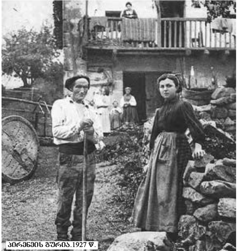
პირენეის გზაზე. 1927 წ.

— მხოლოდ ჩვენს სიხარულზე არაა დამოკიდებული. პური და ღვინო საქართველოდან გაზარდულა მთელ მსოფლიოში, თეთრკანიანი ადამიანის სამკვიდრო საქართველოა, მძალურბობა საქართველოდან იღებს სათავეს, საპრალური ცოდნის აკვანი კვლევი კოლხეთი, სიბრძნის სიბოლო აიპტი