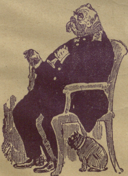
წარმო იდგინეთ—ხევენ აბზოზიციას შუაჯადგენთ... ,