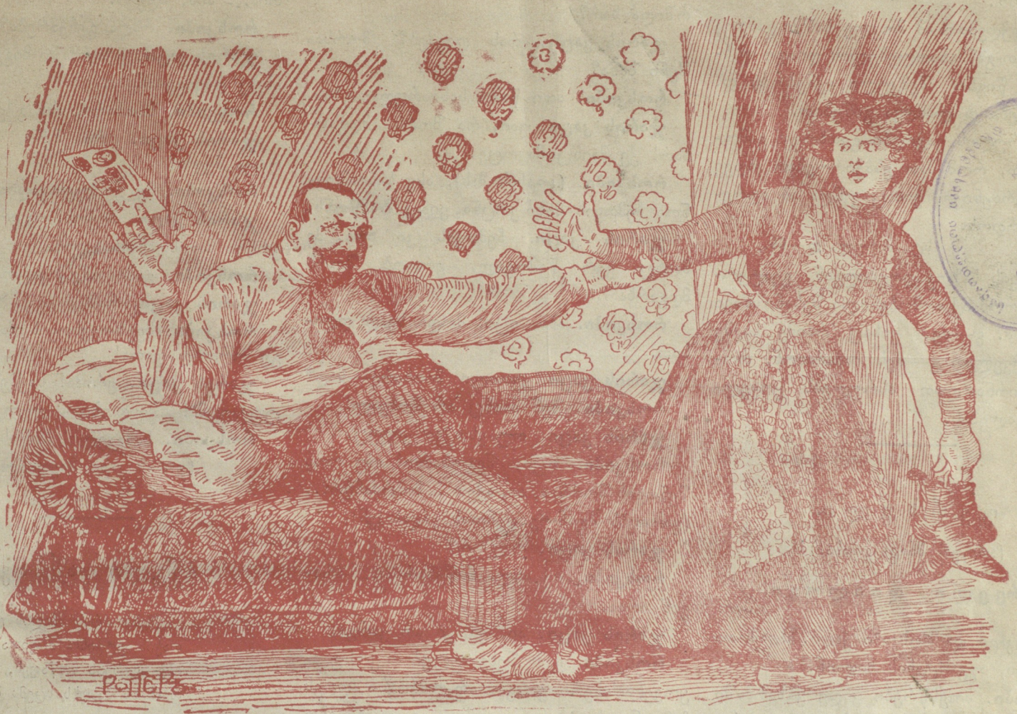
ბურჟუას — მსხვერპლი.