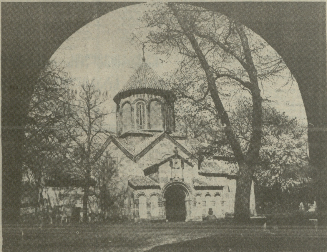
გაუხინ 19 აპრილს ვიკიწივით შარისცვალება უფლისა ჩვენიც იხსოვრისტეტი — მისი ნათლით შემოსვის დანასაწაული

ენვირ წულუკიძე — ქალაქ ქობულეთის პრეფექტად.