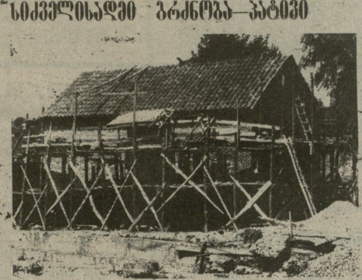
დასრულებული ტაძრის სახურავი, იგი ძველებური ქართული კრამიტით გადაიხურა. ძველი, რუსეთის თვითმპყრობელობის დროინდელი უსასურთო გუმბათები სახურავს მოეხსნა...