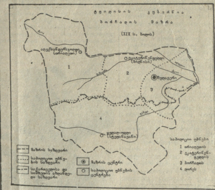
(განმარტება) 1. მდინარე... 2. სასოფლო-სამეურნეო... 3. სასოფლო-სამეურნეო... 4. სასოფლო-სამეურნეო...