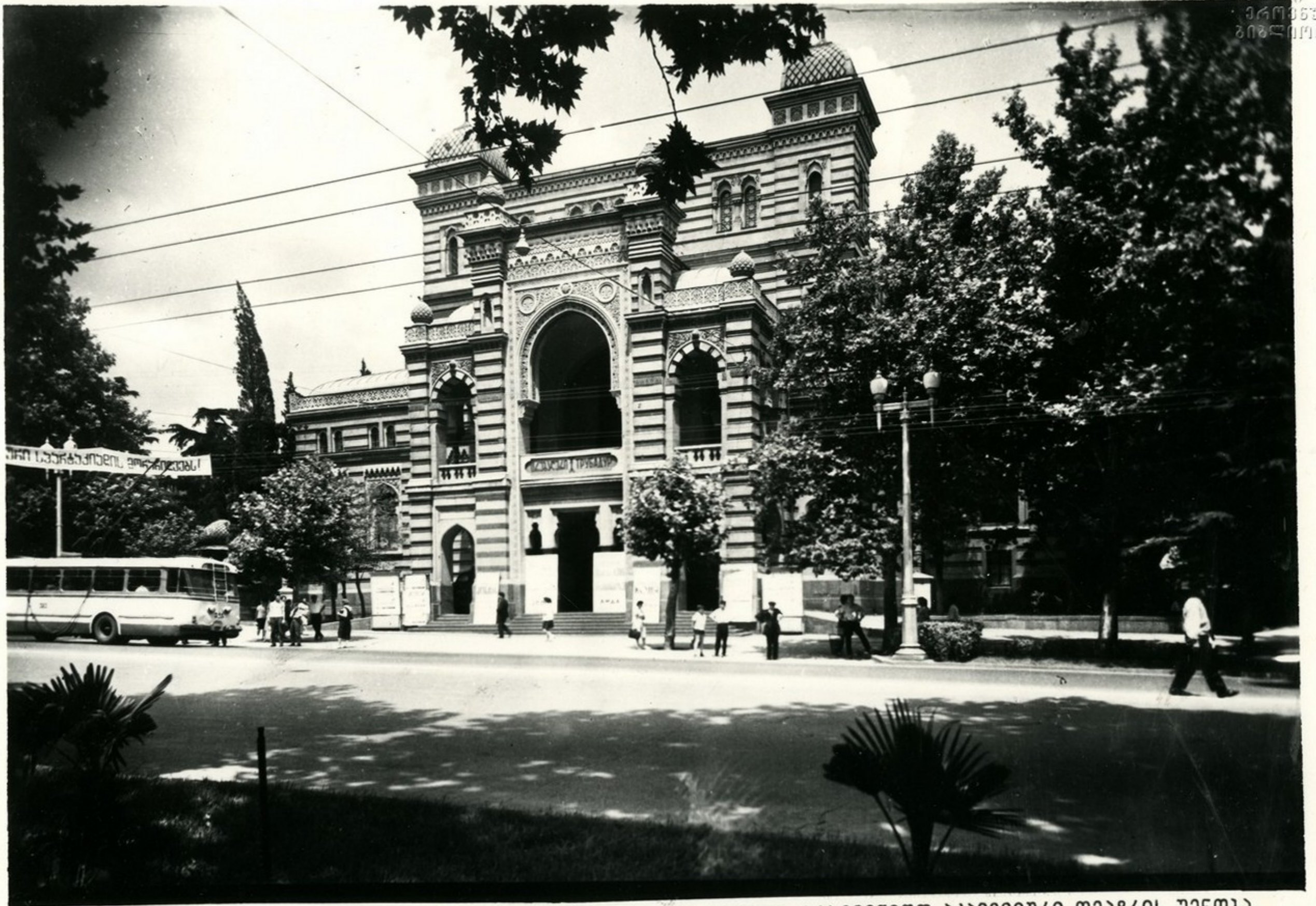
თბილისის ზაქარია ჭავჭავაძის სახელობის ოპერისა და ბალეტის სახელმწიფო აკადემიური თეატრის შენობა. Здание Тбилисского государственного академического театра оперы и балета им. З. Палиашвили.