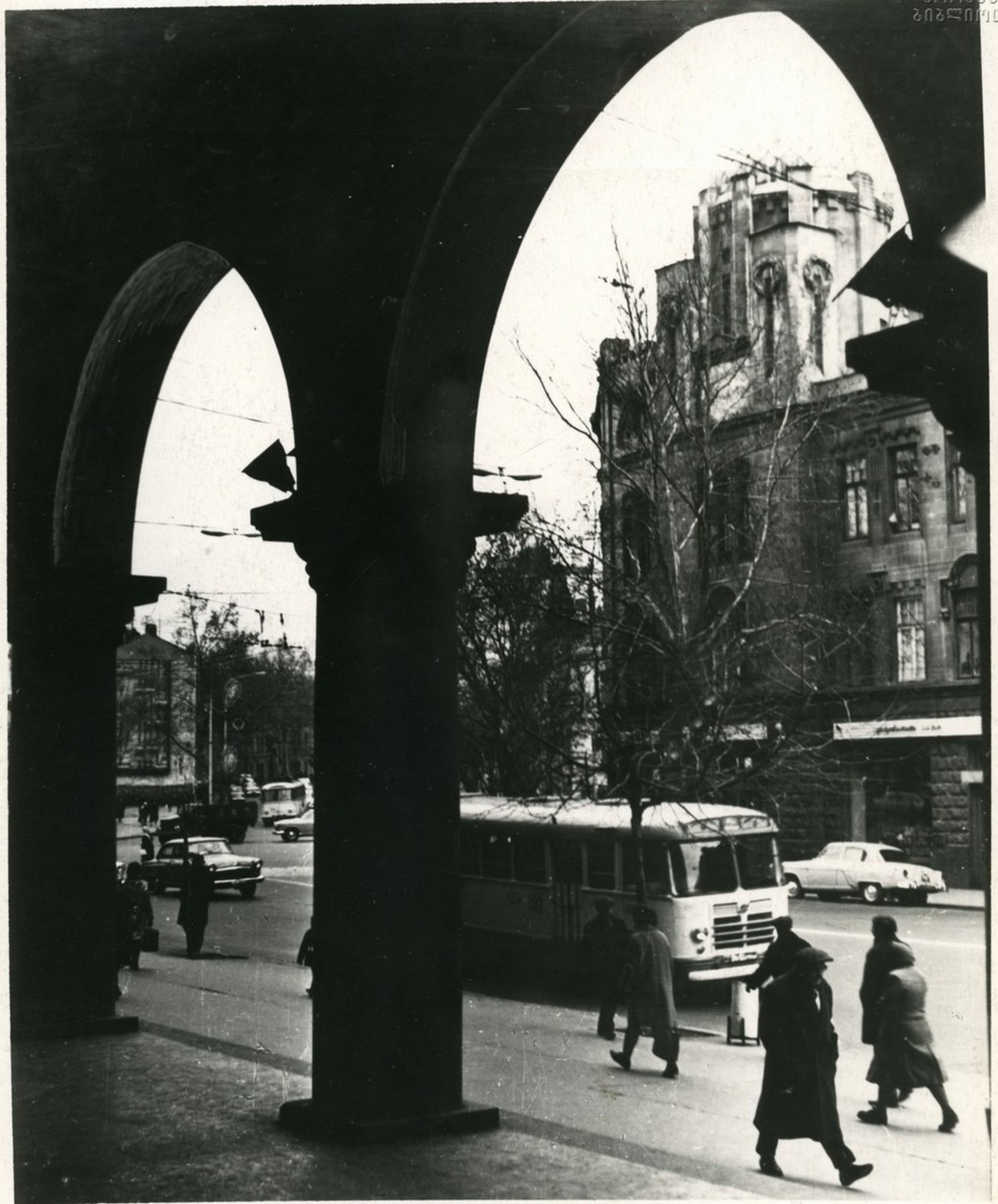
ჩუსთაველის კარსვეტის ერთ-ერთი კუთხე. Один из уголков проспекта Руставели.