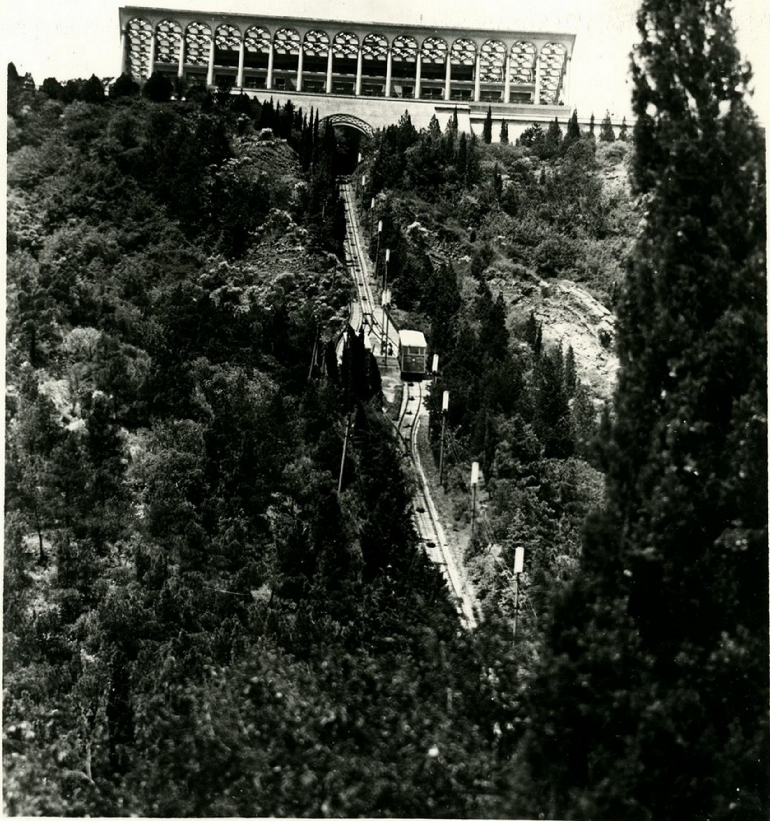
ფუნის სადგომის ხედი ზღვარის ხედი. Вид на верхнюю станцию фуникулера.