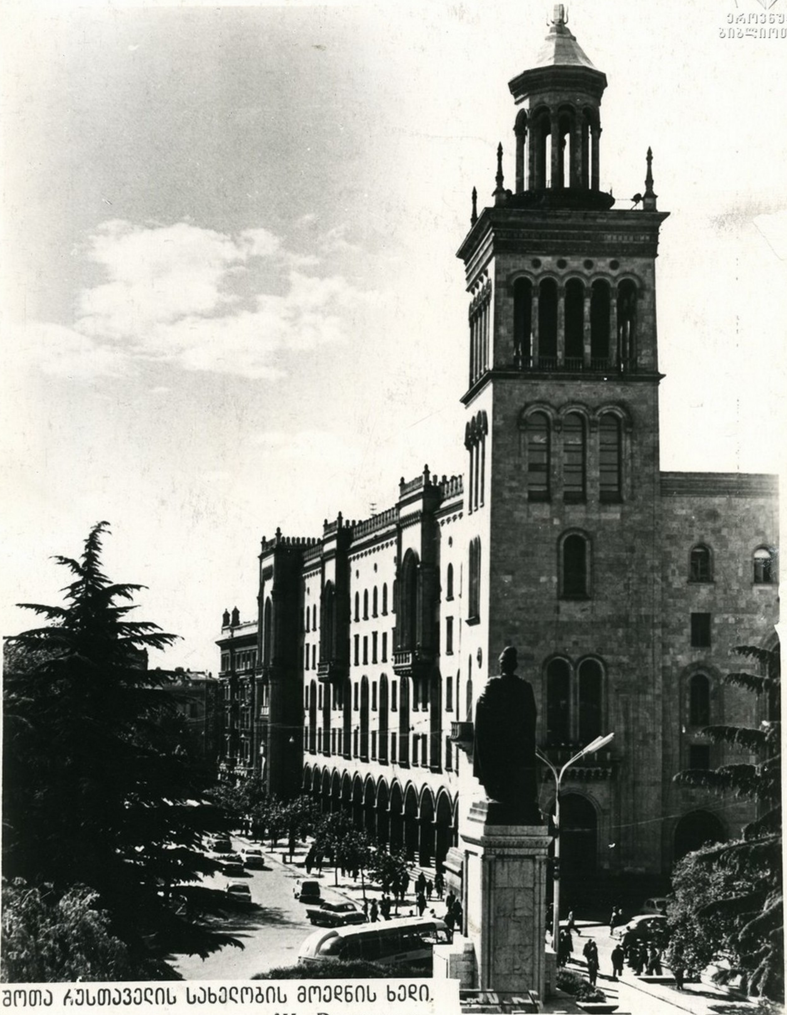
ამთა ჯანთავერის სანჯაროზის ამჯრხის ხაღი. Вид на площадь имени Ш. Руставели.