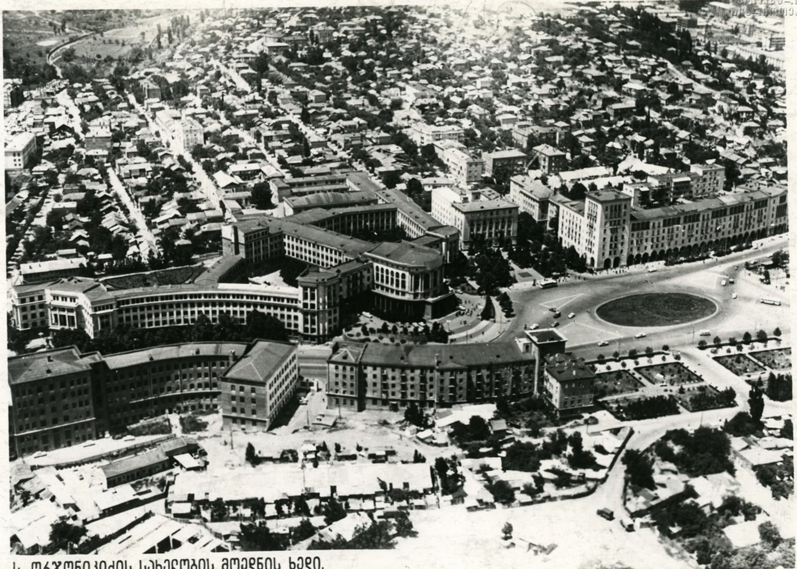
ს. ორჯონიკიძის სახელობის მოედნის ხედი. Вид на площадь имени С. Орджоникидзе.