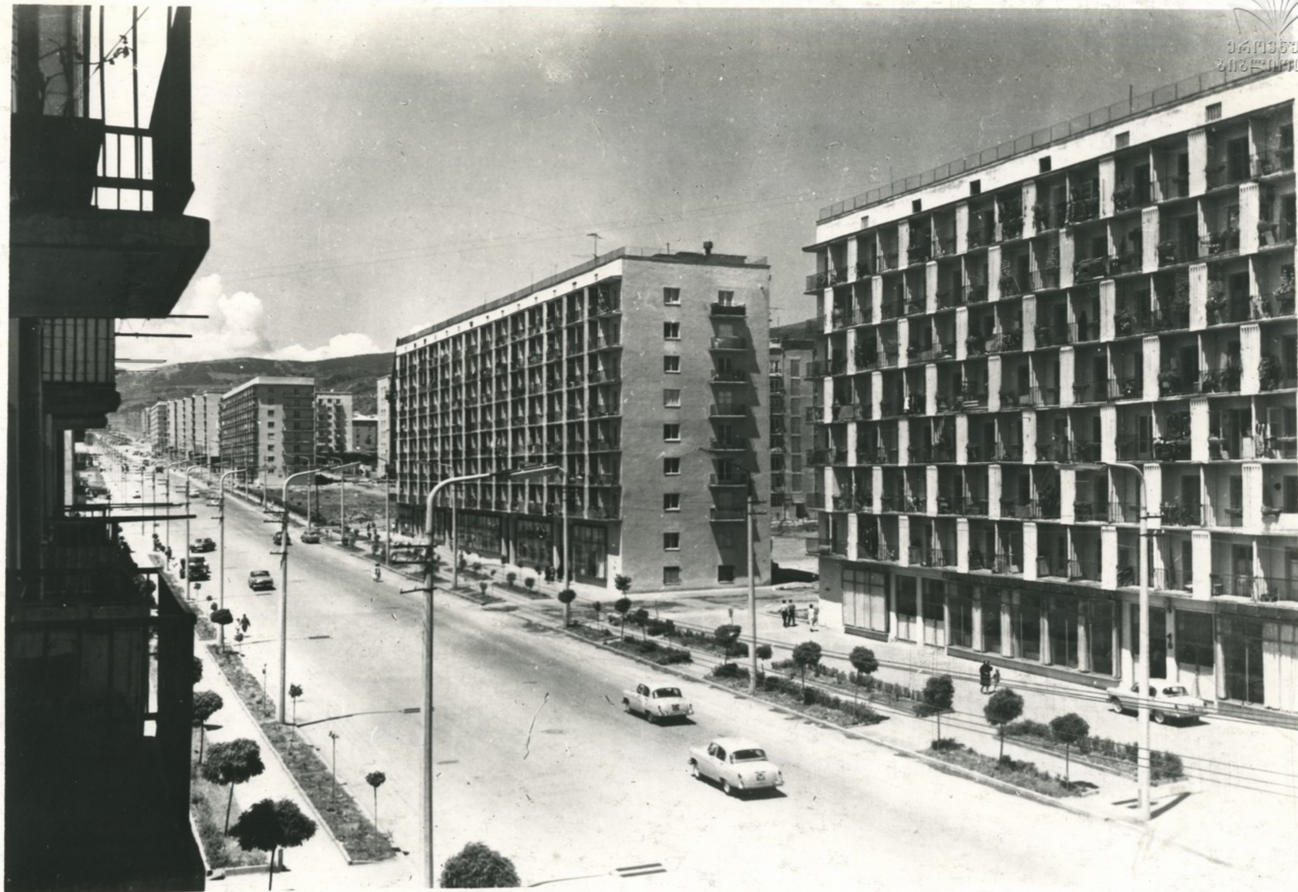
ახალი სასახეობები სანჯიხის ვაჟა ფშაველას პროსპექტზე. Новые жилые дома на проспекте Важа Пшавела.