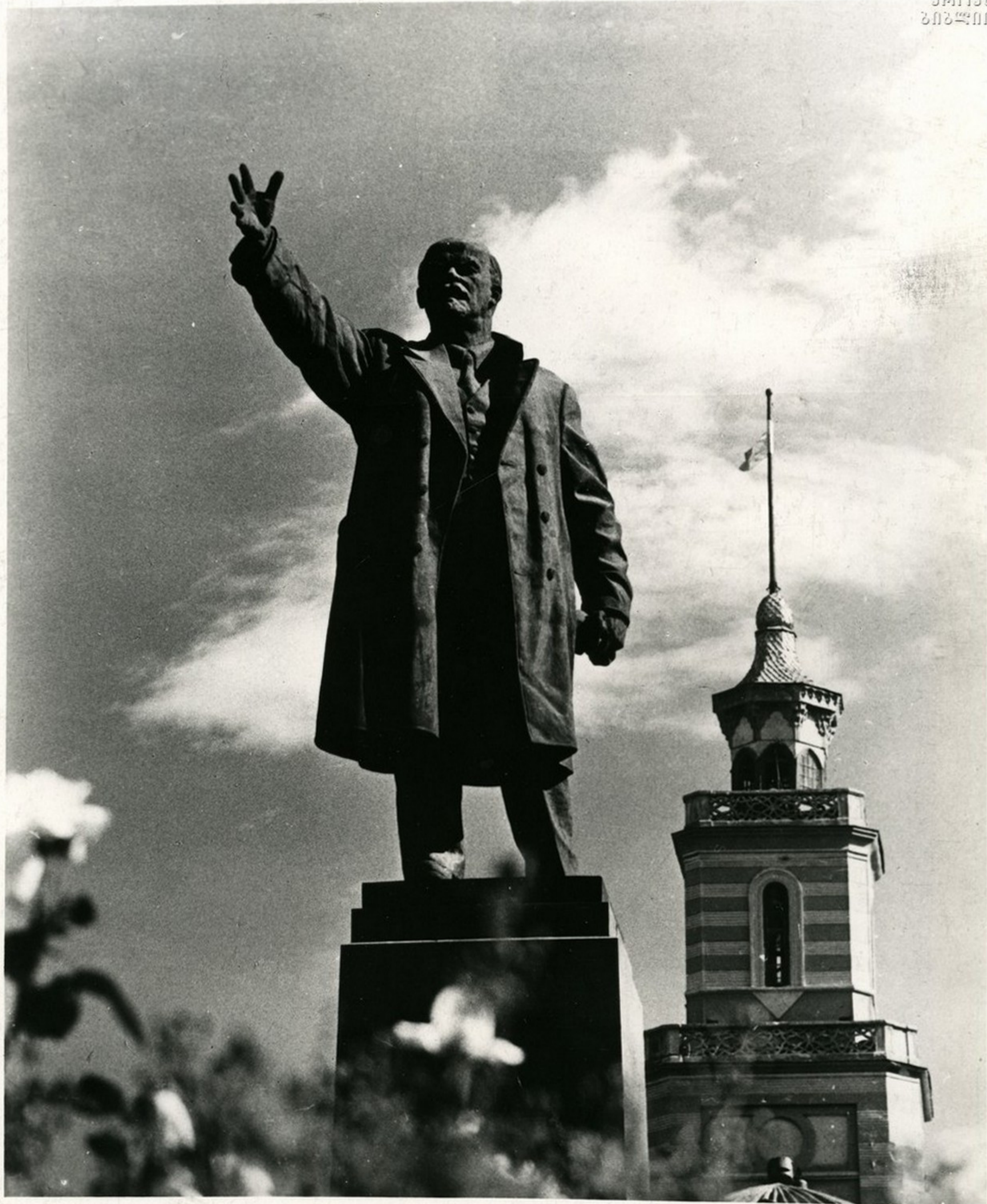
3. ი. ლენინის ძეგლი მოსკოვში, რომელიც დღეს პარკის სახელს ატარებს. Памятник В. И. Ленину на площади, носящей имя великого вождя.