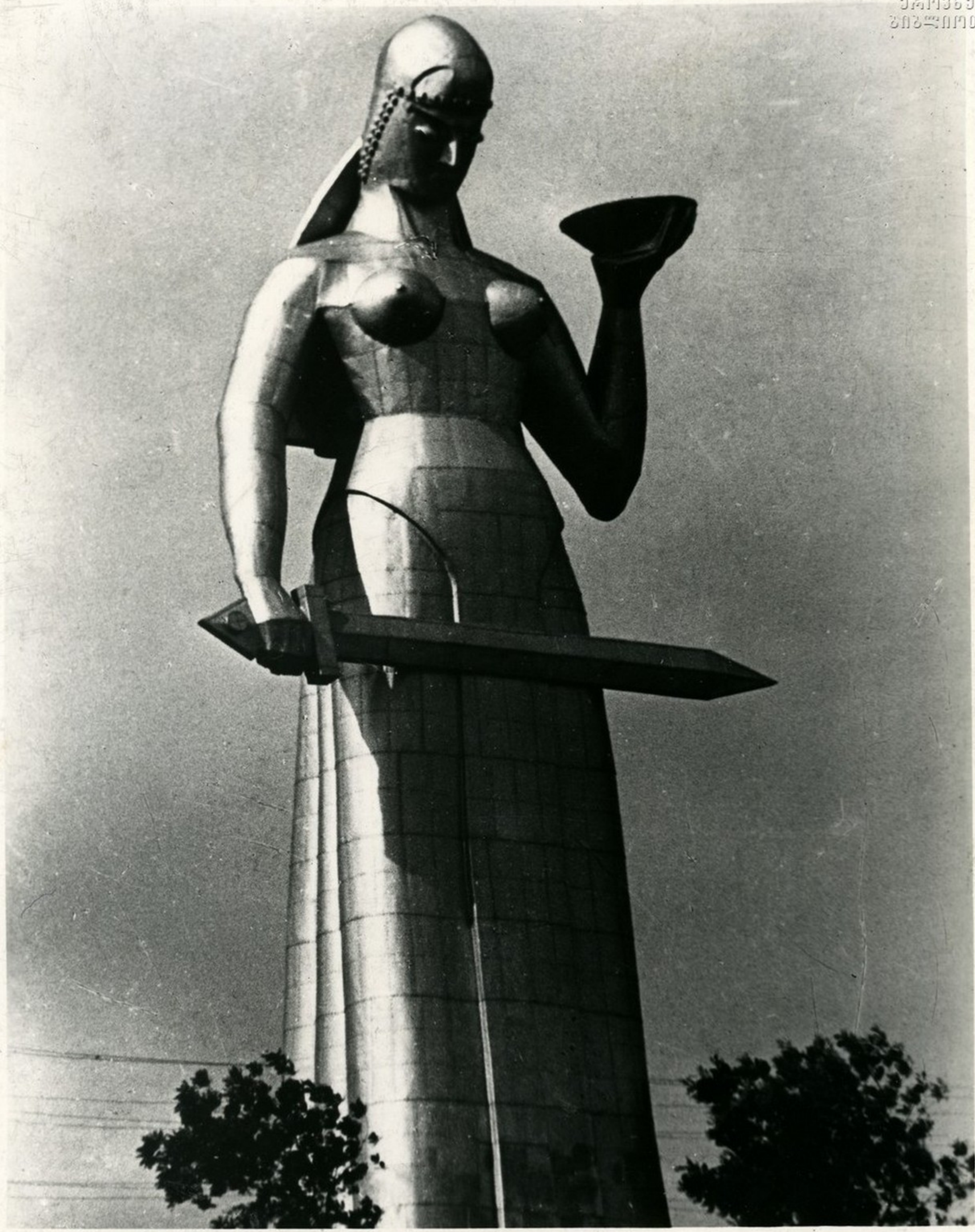
ქართლის დედა—ე. ამაშუკელის ქანდაკება.