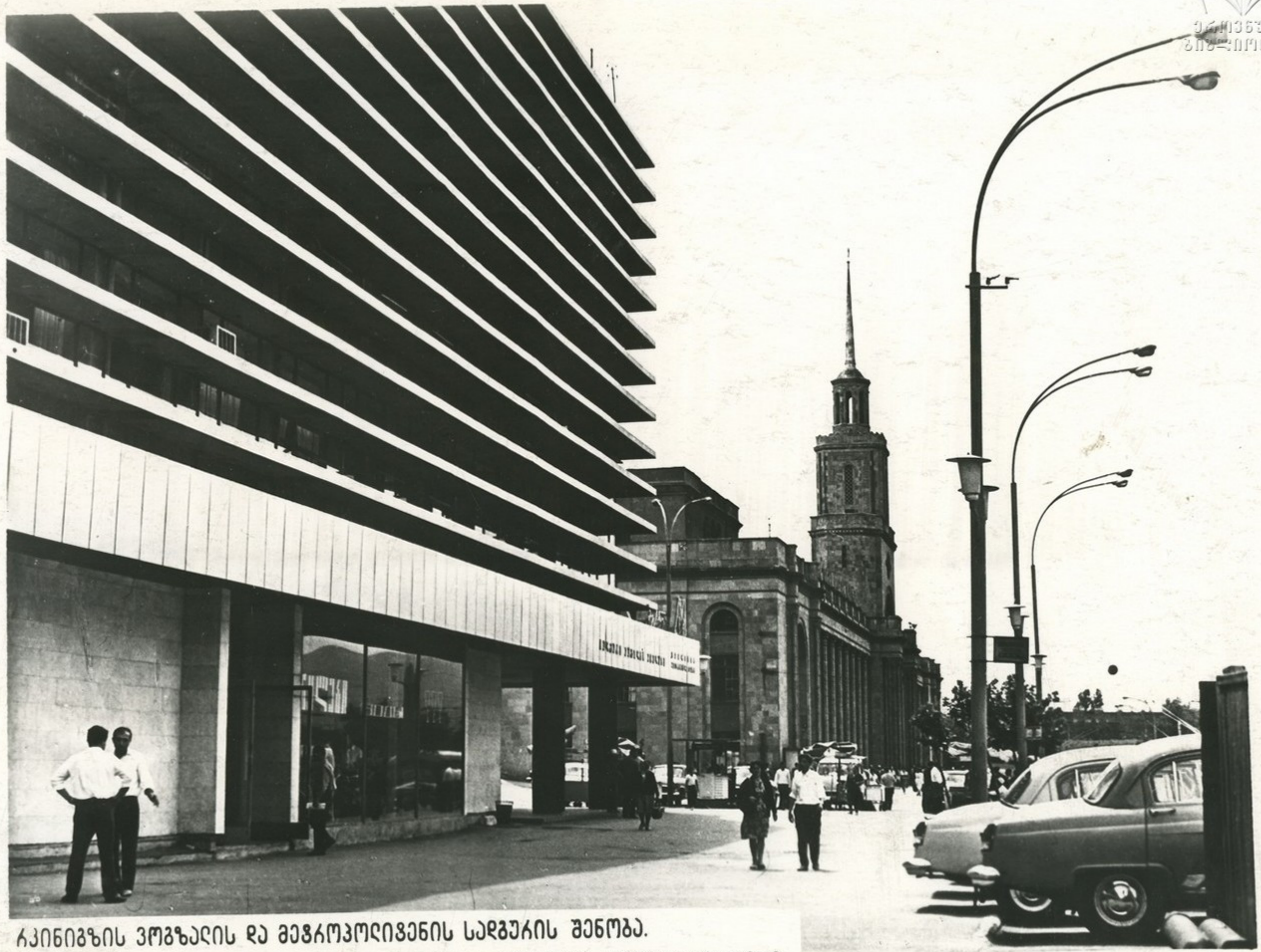
საპროექტის პროექტის და მშენებლობის სარეზიუმის შედეგად. Здания железнодорожного вокзала и станции метрополитена.