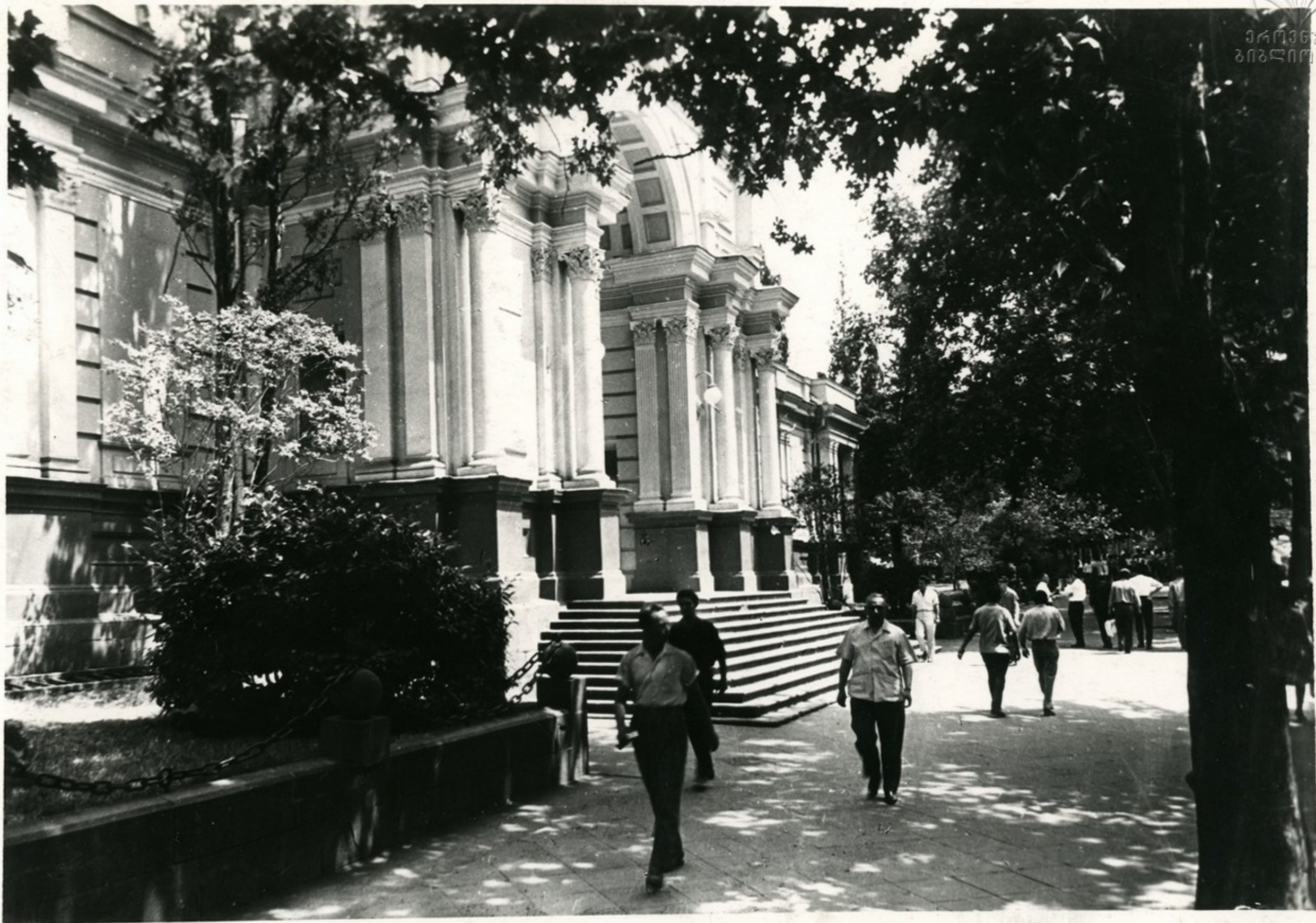
საქართველოს სახანოვანო გალერეის შენობა. Здание картинной галереи Грузии.