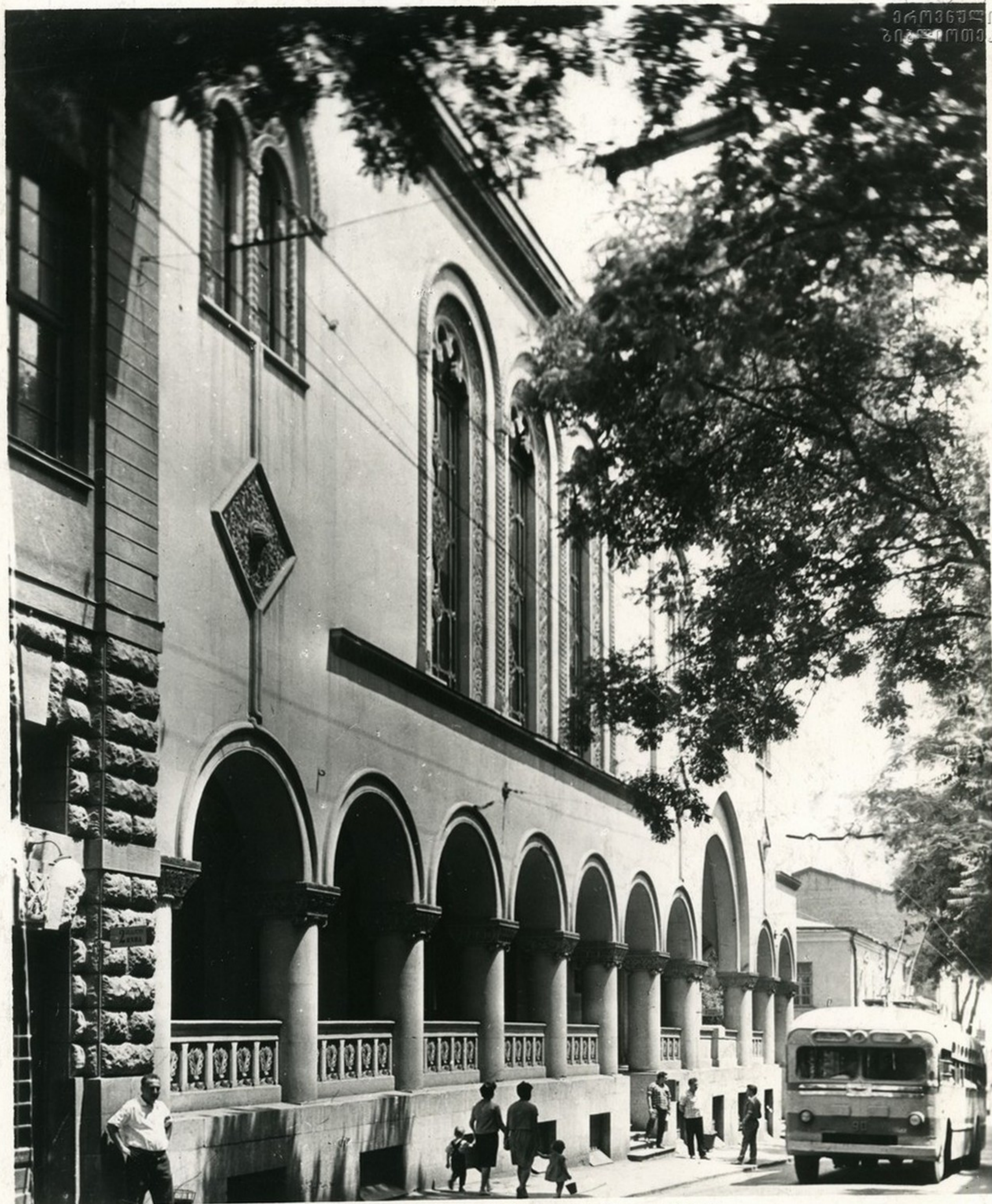
კ. მარქის სახელობის რესპუბლიკური ბიბლიოთეკის შენობა. Здание Республиканской библиотеки имени К. Маркса.