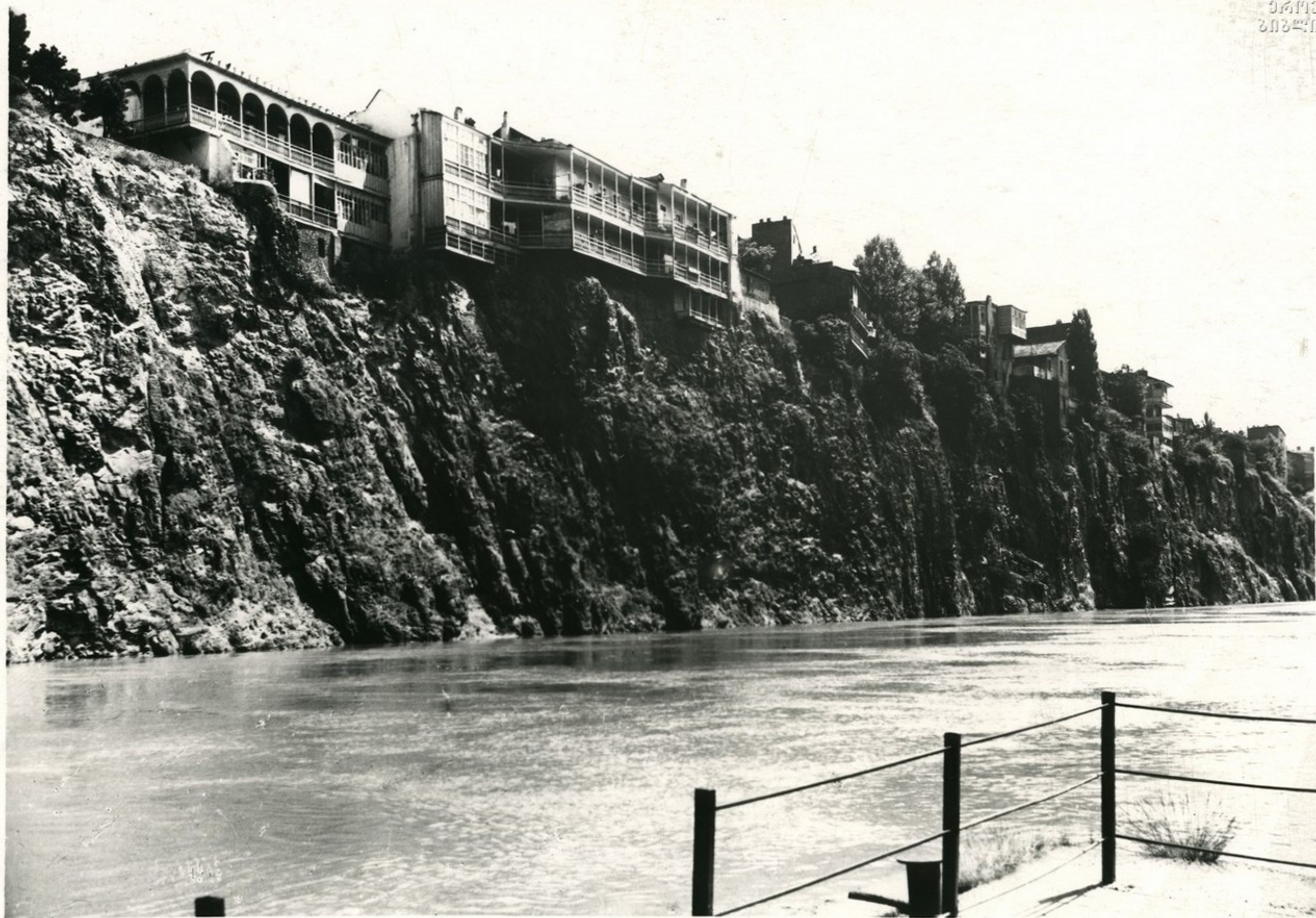
ქალაქის ძველი ნაწილი Старая часть города