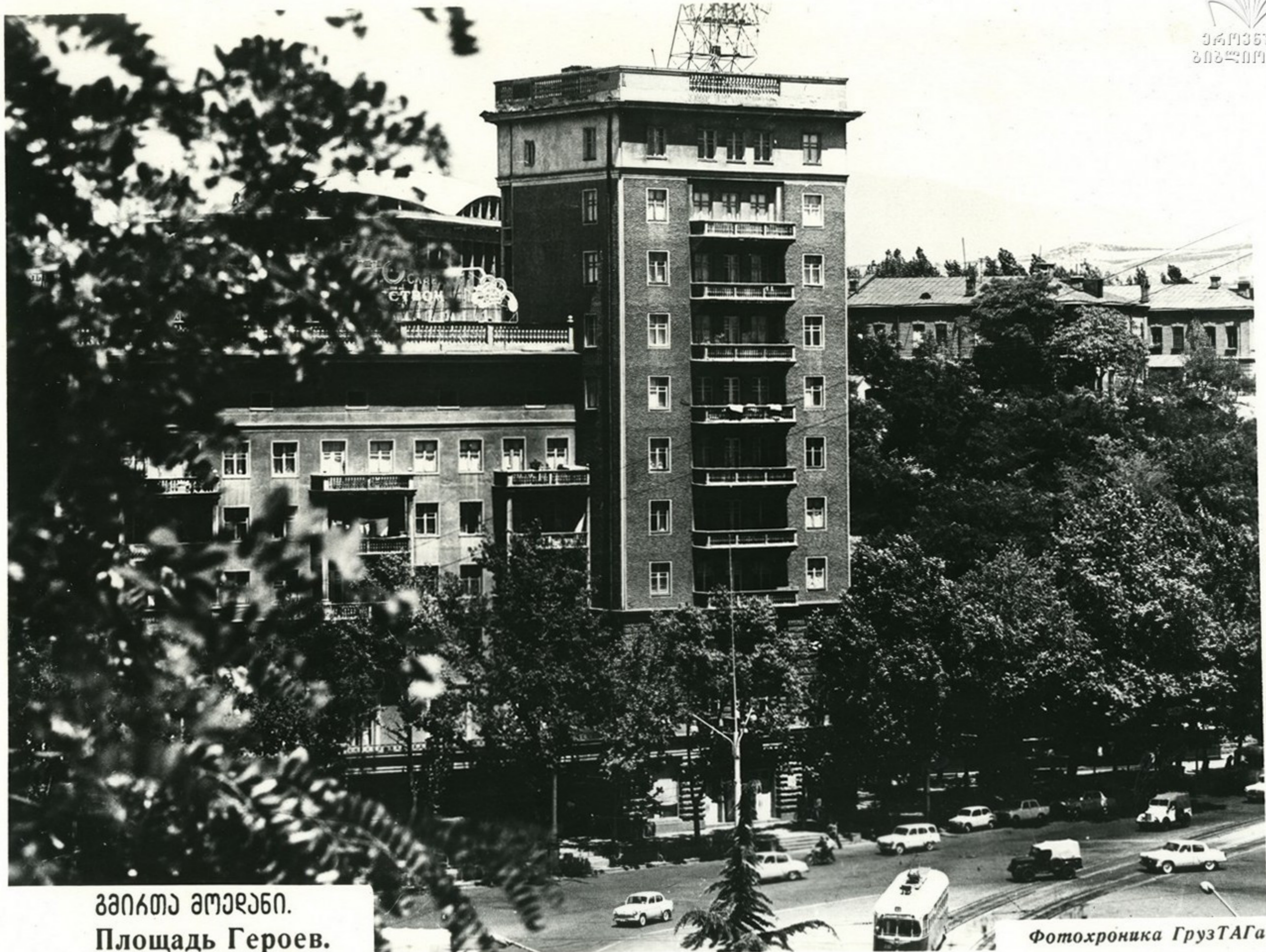
გვიგთა ამაღენი. Площадь Героев.