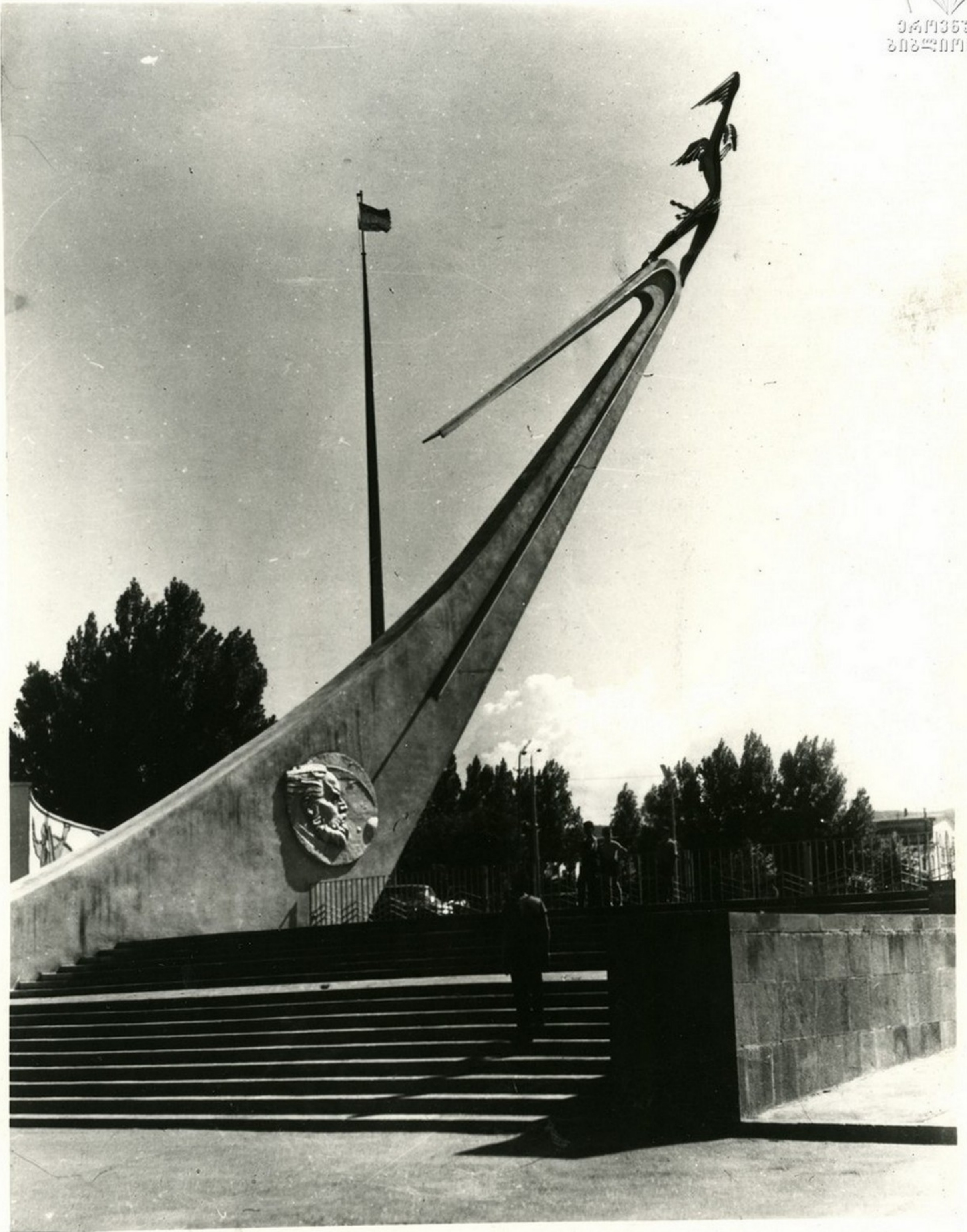
საქართველოს სსრ სახალხო მეურნეობის მიღწევათა გამოფენის შესასვლელი. Вход на Выставку достижений народного хозяйства Грузинской ССР.