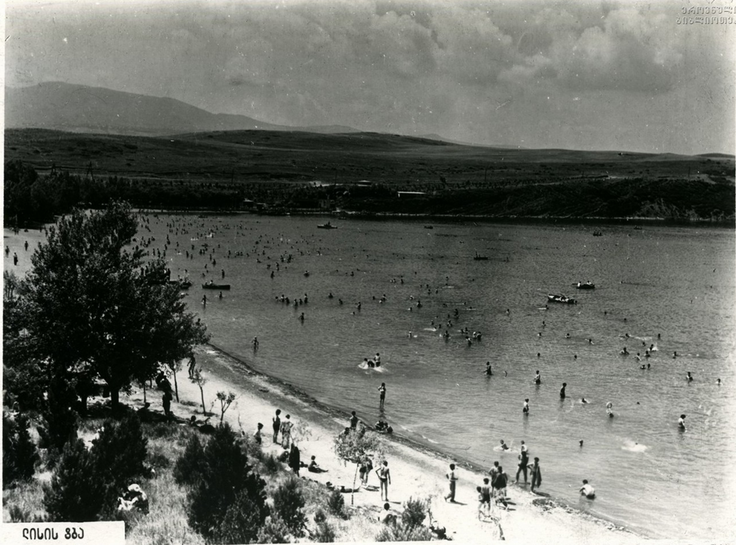
ღონის ჰბა Озеро Лиси