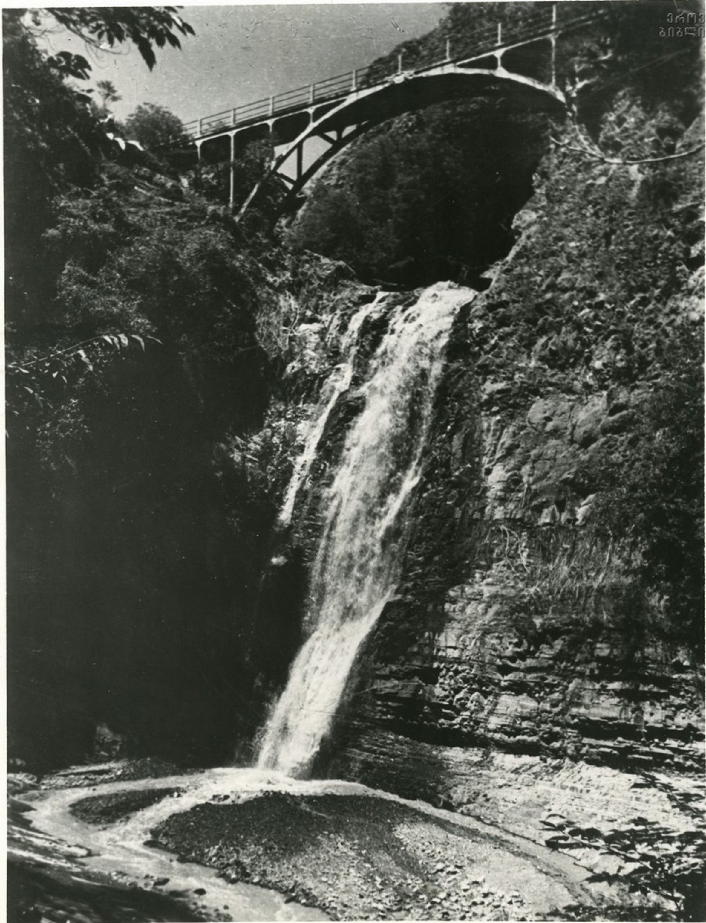
ჩანჩქეაი თბილისის ბოტანიკურ ბაღში.