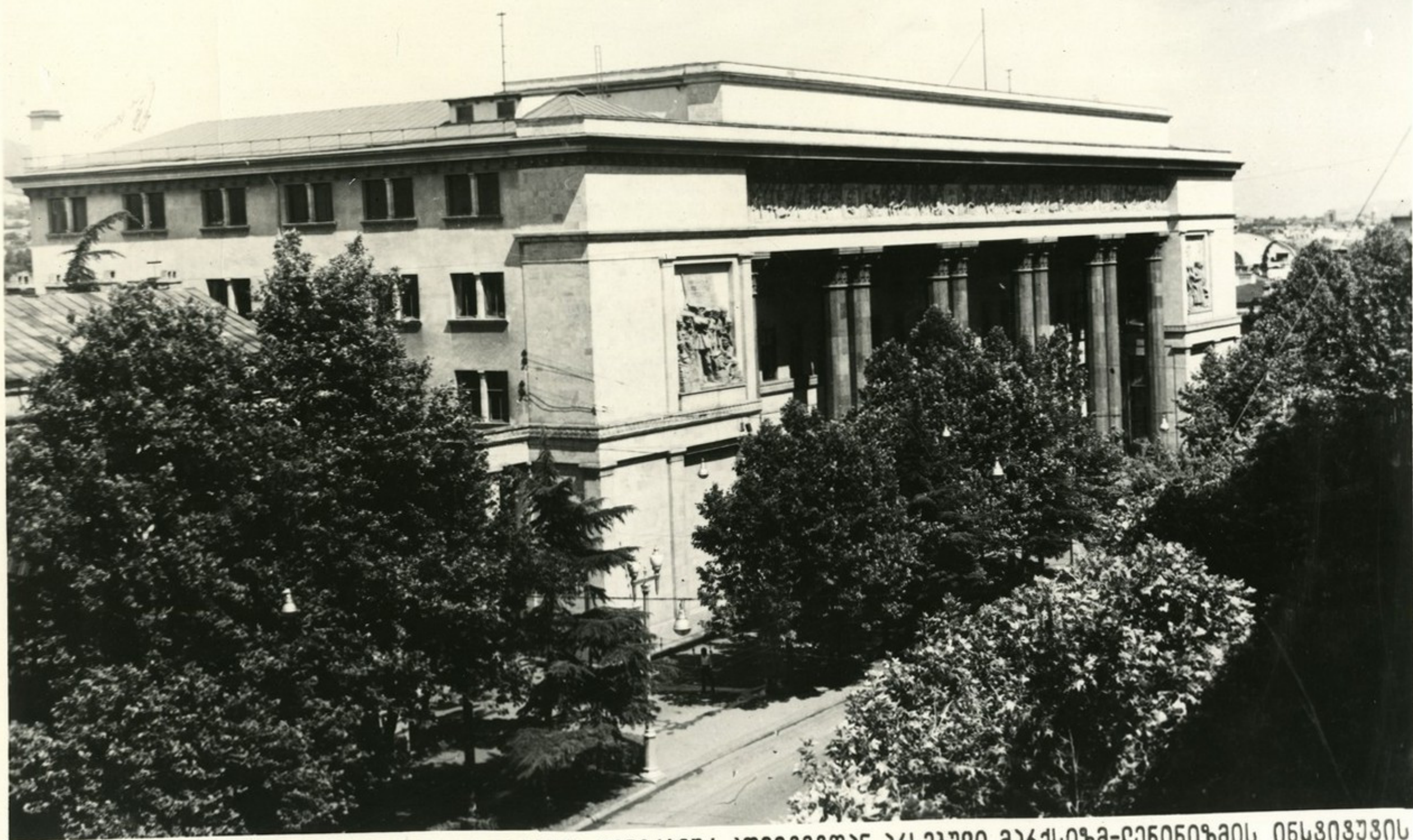
საბჭოთა კავშირის კომუნისტური პარტიის ცენტრალური კომიტეტთან ახსებულ მარქსიზმ-ლენინიზმის ინსტიტუტის საქართველოს ფილიალის შენობა.

Здание Грузинского филиала Института марксизма-ленинизма при ЦК КПСС.