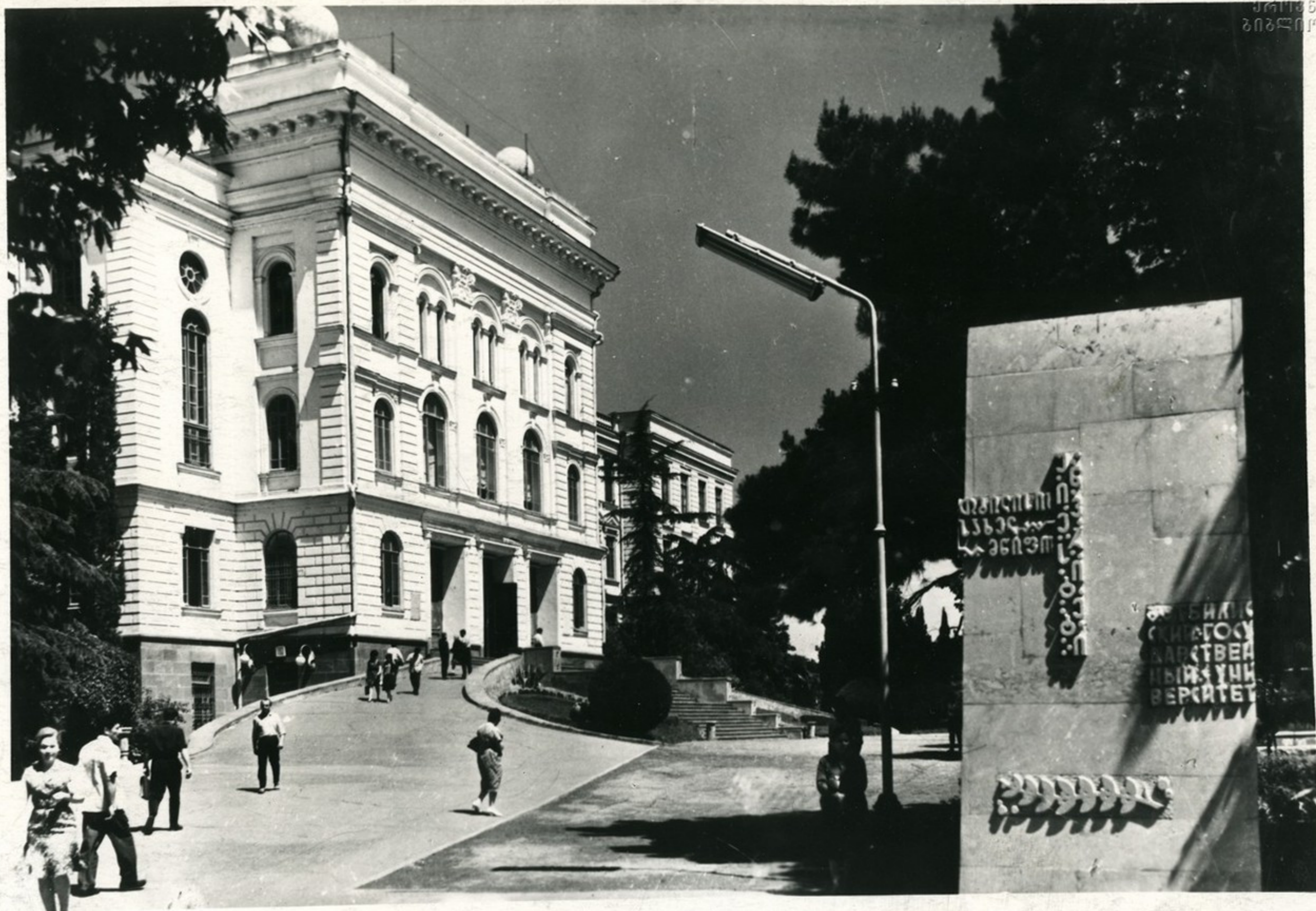
თბილისის სახელმწიფო უნივერსიტეტი. Тбилисский государственный университет.