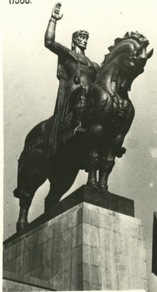
თბილისის დასაფუძვლის დასაფუძვლის ძეგლი Памятник основателю города Тбилиси Вахтангу Горгасали

თბილისი—საქართველოს საბჭო- თა სოციალისტური კავშირების დღეაქველია. იგი საბჭოთა კავში- რის უძველეს ქალაქთა რიცხვს მიე- კუთვნება. აქამდელი ნაკონ- სტრუქციები რეკონსტრუქციის მოქმედებით თბილისის ზე- რეკონსტრუქციის დასრულებამდე გაგრძელდება. ქველთა-ქველი, მუდამ მუდამ ახალგაზრდა თბილისი, საბჭოთა ხალისების ნაგებობის მუდამ მუდამ ნის ერთ-ერთ უძველეს ქალაქად იქცა.