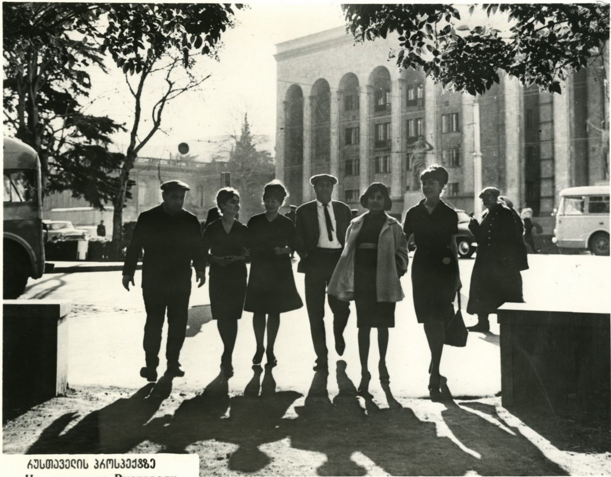
აქსტავერის ჰაოსვეთხე На проспекте Руставели