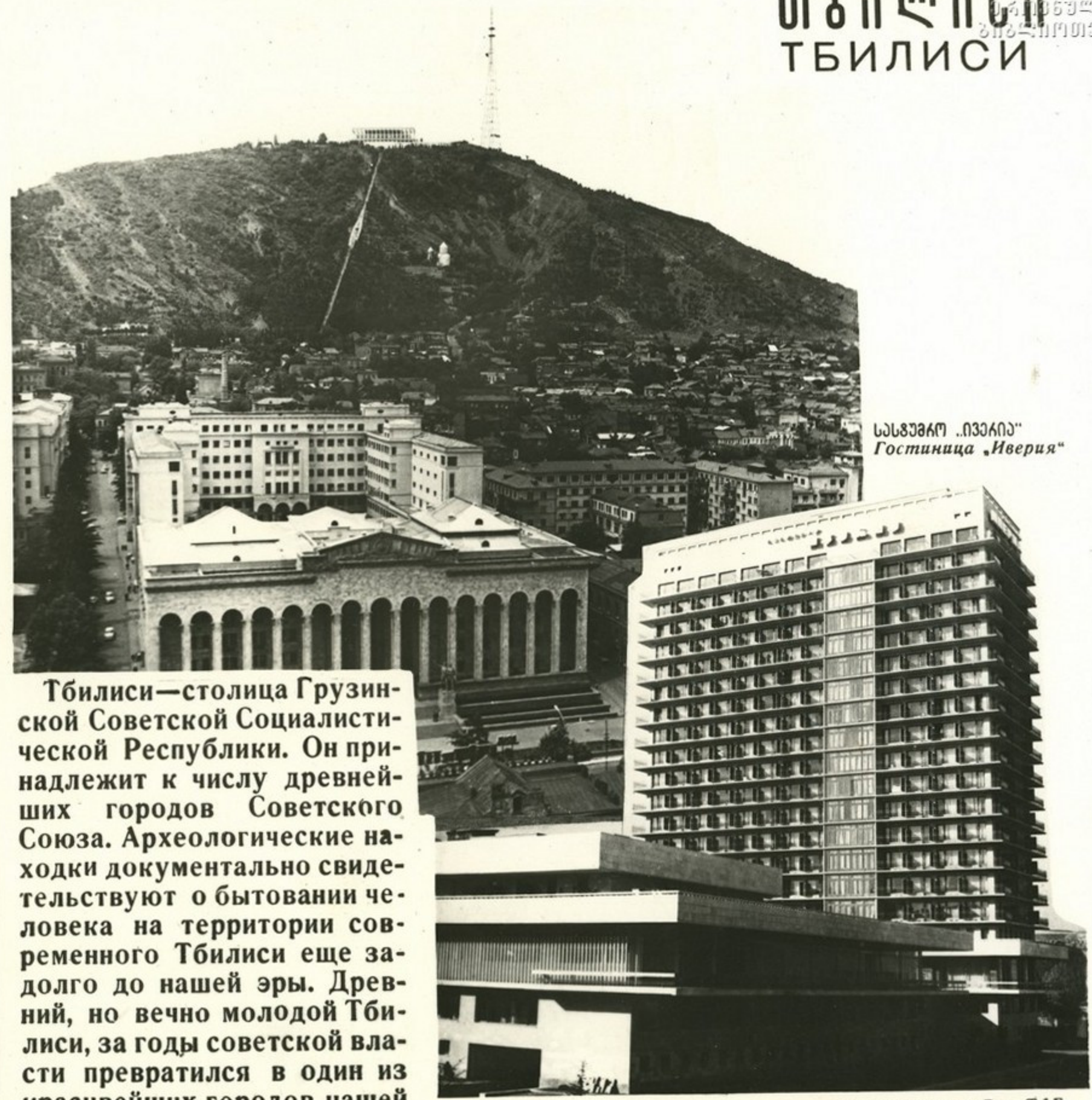
სანჯაქი „ივერია“ Гостиница „Иверия“

Тбилиси—столица Грузин- ской Советской Социалисти- ческой Республики. Он при- надлежит к числу древней- ших городов Советского Союза. Археологические на- ходки документально свиде- тельствуют о бытовании че- ловека на территории сов- ременного Тбилиси еще за- долго до нашей эры. Древ- ний, но вечно молодой Тби- лиси, за годы советской вла- сти превратился в один из красивейших городов нашей страны.