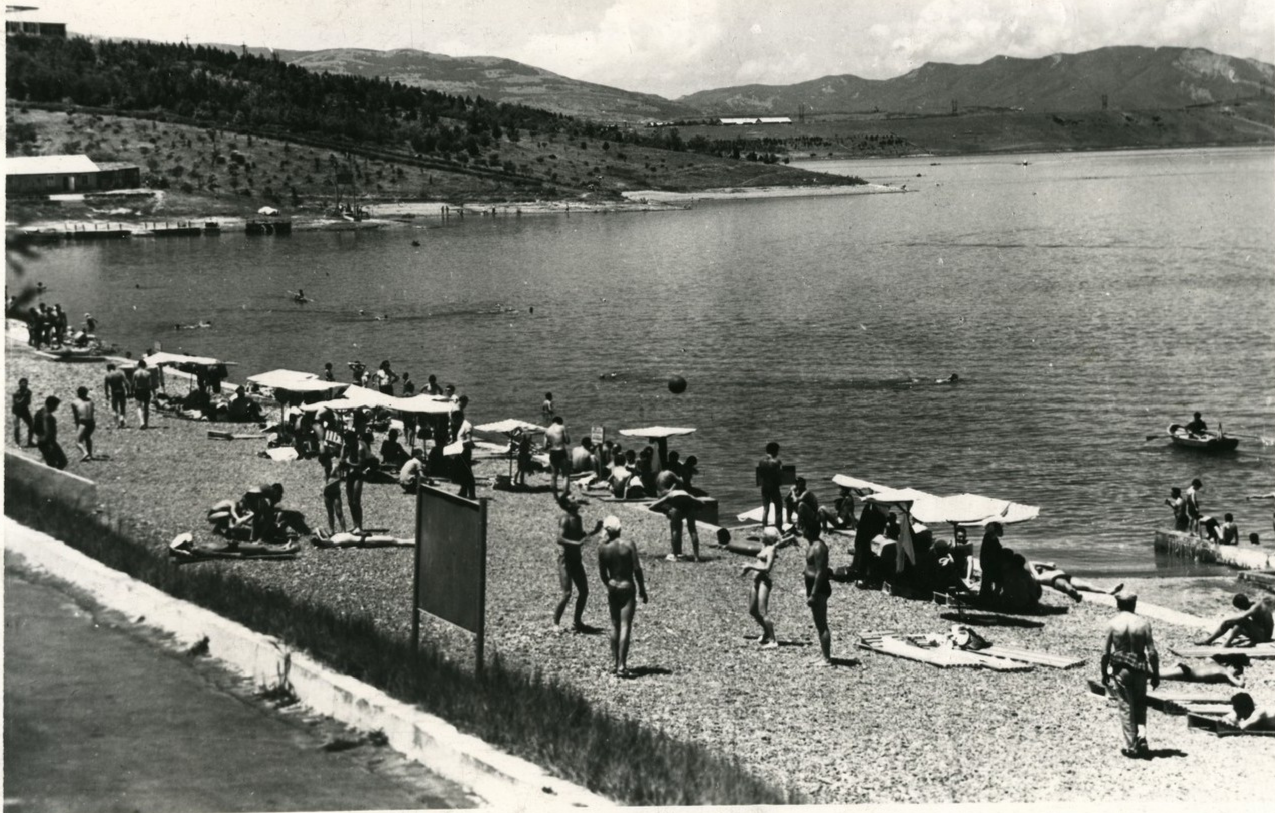
თბილისის ზღვა Тбилисское море