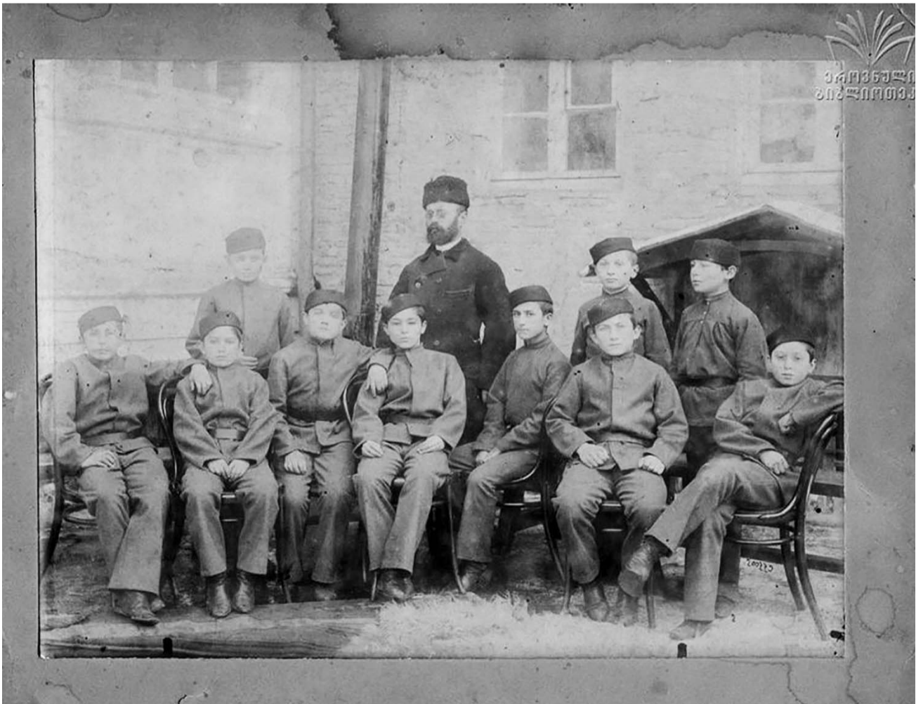
ნიკო მთვარელიშვილი თელავის სასულიერო სასწავლებლის მოსწავლეებთან ერთად. ფოტო გადაღებულია თელავში, 1877 წელს. პირველ რიგში, მარჯვნიდან მესამე, ზის ვაჟა-ფშაველა; მეორე რიგში, ცენტრში, დგას ნიკო მთვარელიშვილი

თელაველთა ღრმა პატივისცემა იაკობ გოგებაშვილისადმი შემდგომმა თაობებმაც დააფასეს და აქ გახსნილ პედაგოგიურ ინსტიტუტს (ამჟამად უკვე უნივერსიტეტს) იაკობ გოგებაშვილის სახელი მიაკუთვნეს.