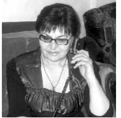
დროს იყო შეურაცხადი. დაისჯება თუ არა ჩემი შვილი?

„საერთო გაზეთის“ მკითხველთა შიშველთა კასუსებს გაზეთის იურიდიული კონსულტანტი, ადვოკატი მთვარისა კვლევითი. ტელ.: 2 79 63 91; 0 790 60 64 69; 5 93 78 64 69