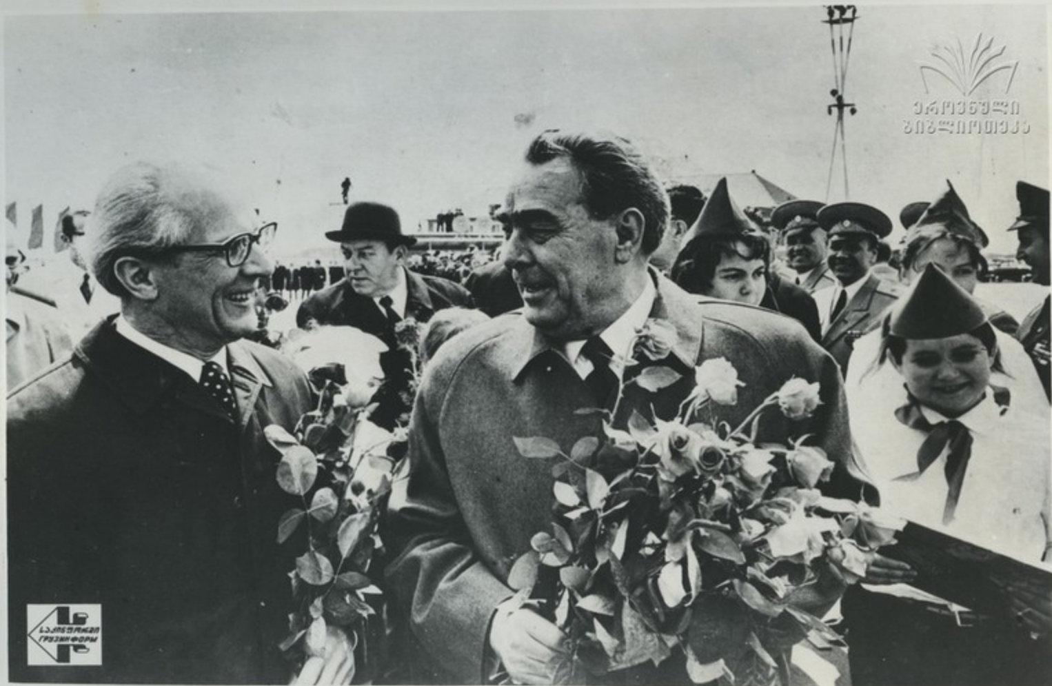
Встреча в аэропорту Генерального секретаря ЦК КПСС Л. И. Брежнева, прибывшего с дружеским визитом в Германскую Демократическую Республику.