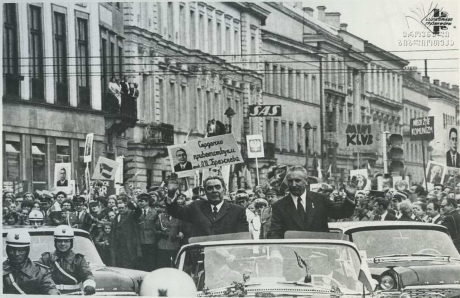
Варшавяне приветствуют прибывшего с дружеским визитом в ПНР Генерального секретаря ЦК КПСС товарища Л. И. Брежнева