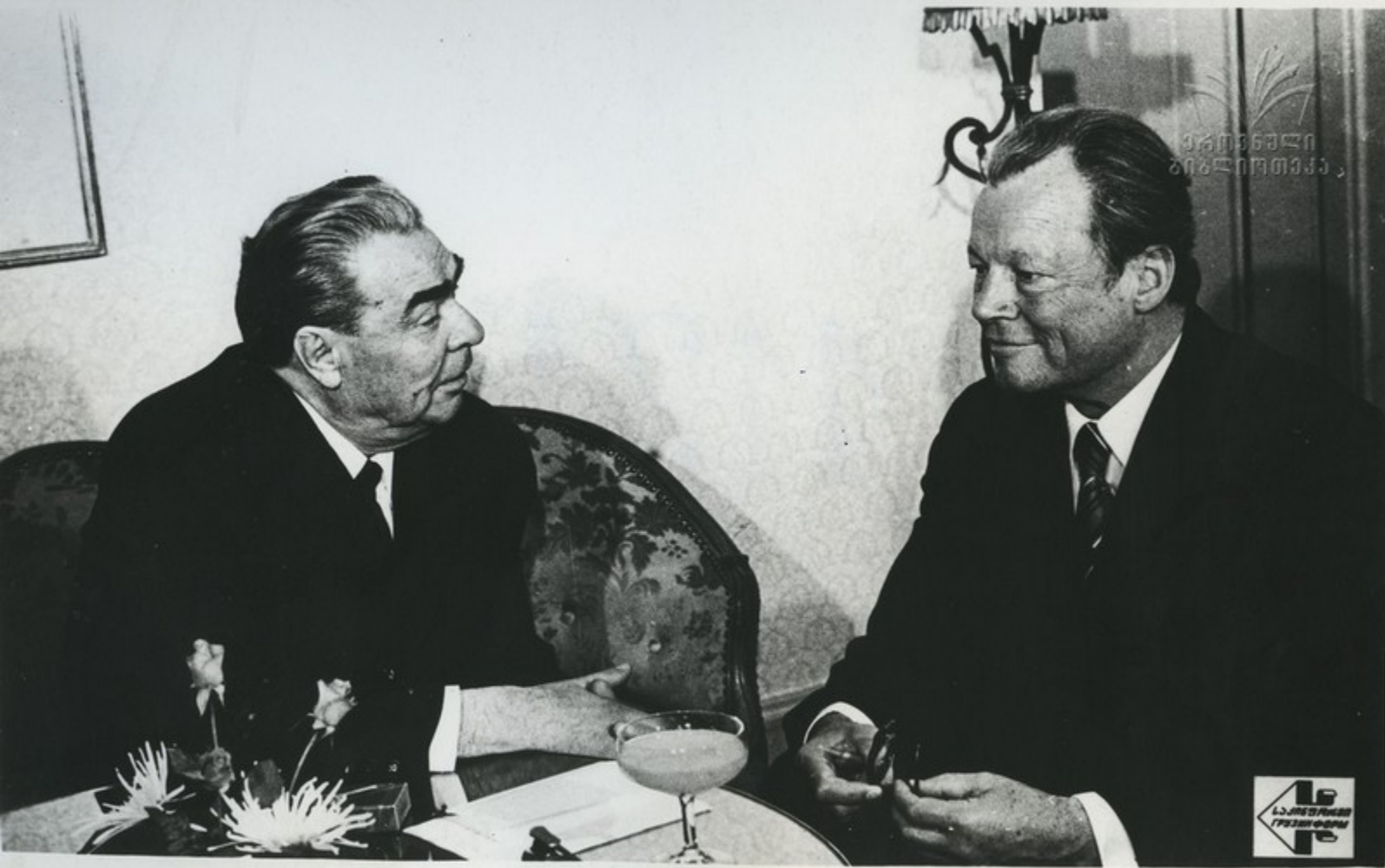
18 мая в Петербурге состоялись продолжительные беседы Генерального секретаря ЦК КПСС, члена Президиума Верховного Совета СССР Л. И. Брежнева с Федеральным канцлером ФРГ В. Брандтом.