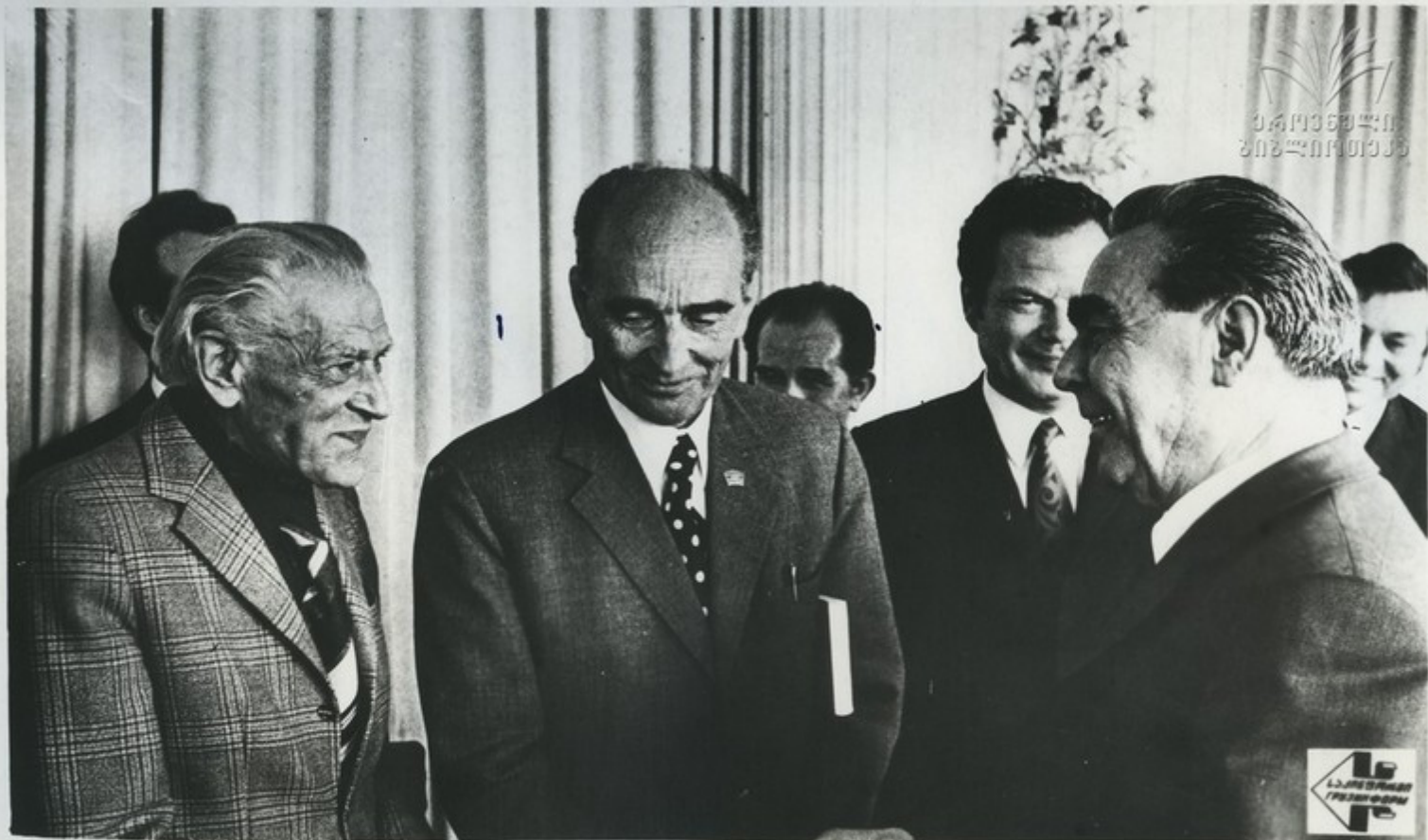
21 мая состоялась встреча Генерального секретаря ЦК КПСС Л. И. Брежнева с представителями руководства Германской Коммунистической партии, почетным президентом ГКП М. Рейманом, председателем ГКП К. Бахманом и заместителем председателя ГКП Г. Мисом.