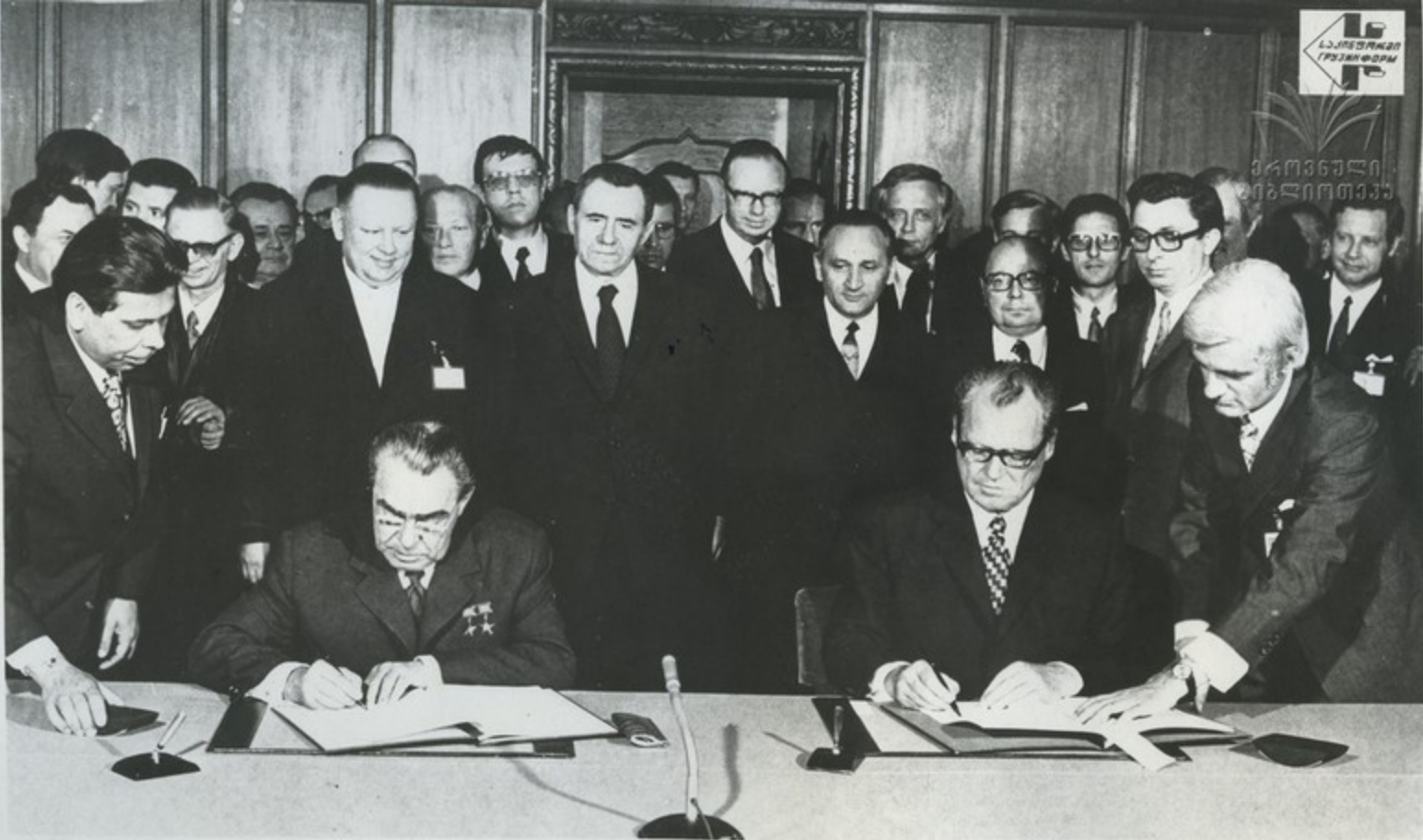
21 мая в Кенигсвинтер-Петербурге Генеральный секретарь ЦК КПСС, член Президиума Верховного Совета СССР товарищ Л. И. Брежнев и Федеральный канцлер ФРГ В. Брандт подписали совместное заявление о визите Генерального секретаря ЦК КПСС товарища Л. И. Брежнева в ФРГ.