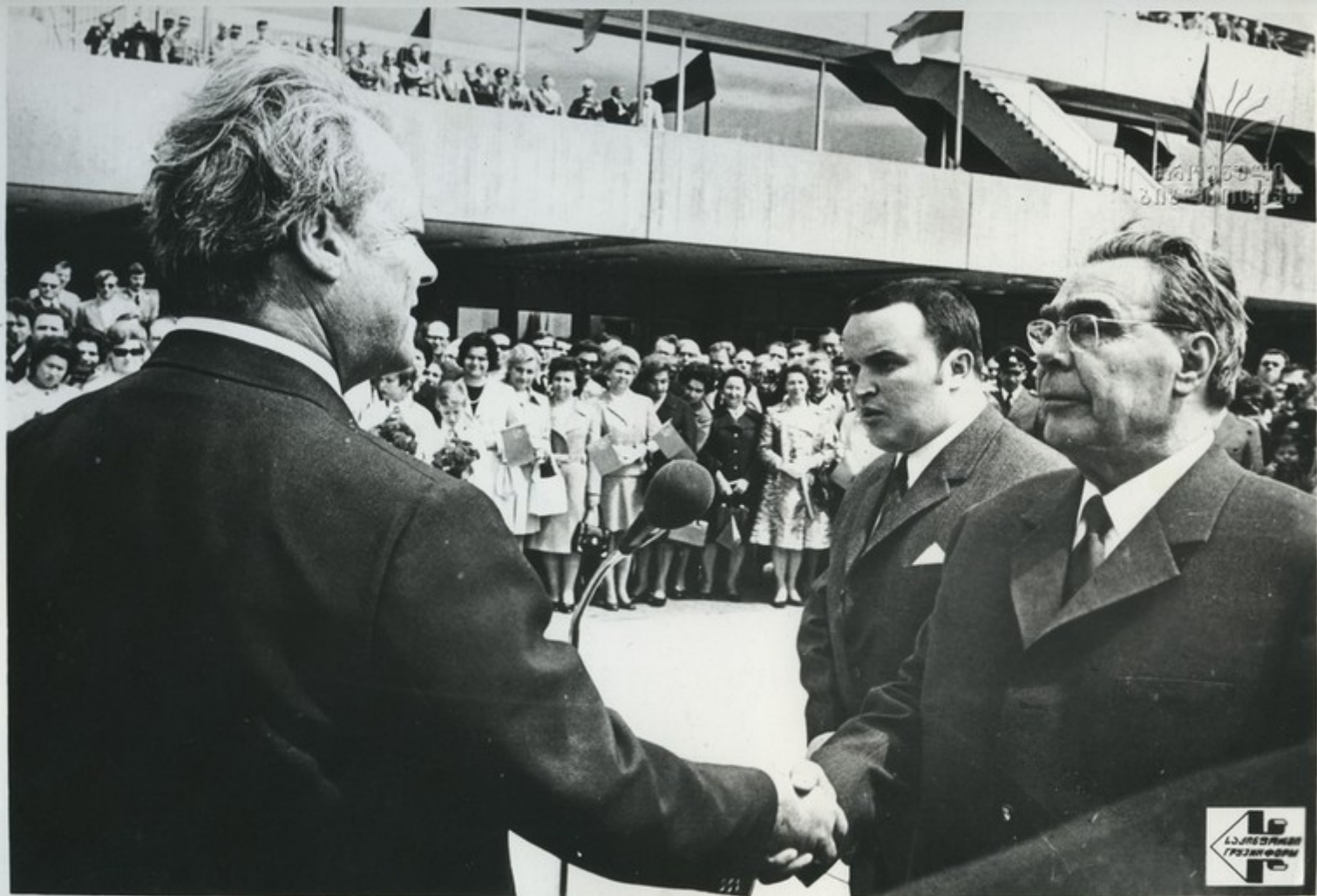
18 мая Генеральный секретарь ЦК КПСС, член Президиума Верховного Совета СССР Л. И. Брежнев по приглашению канцлера ФРГ В. Брандта прибыл с визитом в Федеративную Республику Германии.