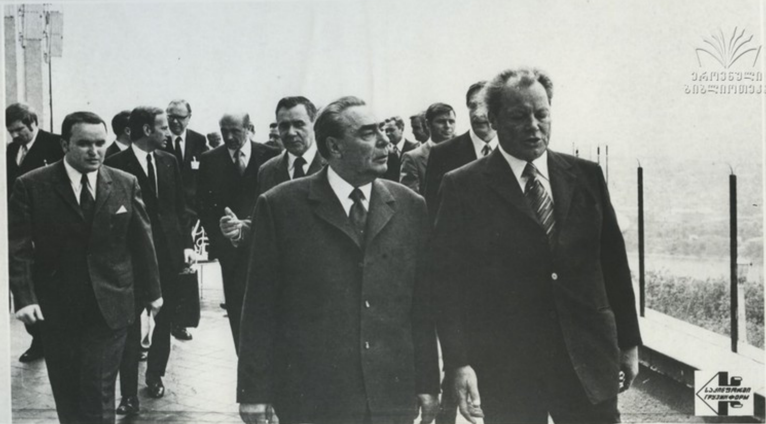
18 мая в Петербурге состоялась встреча Генерального секретаря ЦК КПСС, члена Президиума Верховного Совета СССР Л. И. Брежнева с канцлером В. Брандтом.