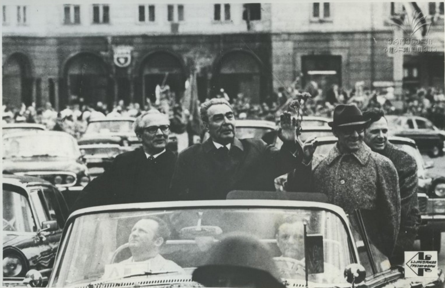
Столица Германской Демократической Республики—Берлин приветствует Генерального секретаря ЦК КПСС Л. И. Брежнева, прибывшего с дружеским визитом.