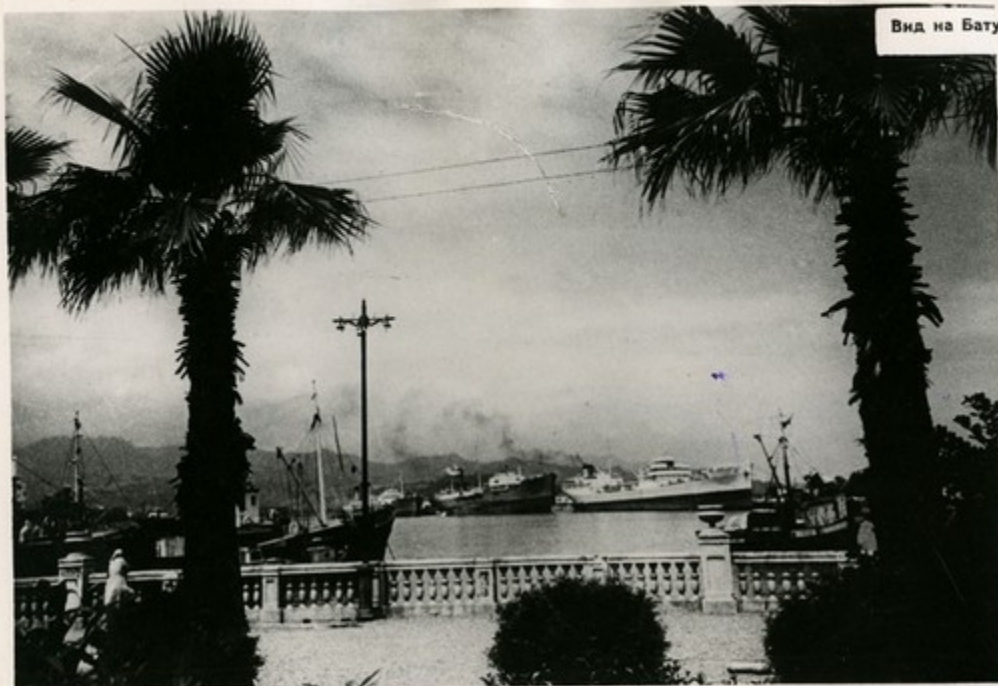
Вид на Батумский порт.

Батуми—крупный морской порт. Здесь разгружаются суда из Одессы, Жданова, Туапсе, из различных других советских и зарубежных портов. Через Батумский порт в республики Закавказья идут хлеб, сахар, соль, лес, строительные материалы. Из Батуми суда увозят нефть, ценные дары природы Грузии—золотистые цитрусовые плоды, чай, фрукты, табак. Батумский порт занимает первое место в СССР по экспорту нефти. Здесь создана специальная нефтяная гавань с причалами для океанских танкеров. К Батуми из Баку проложен нефтепровод. В семилетке порт значительно расширится.