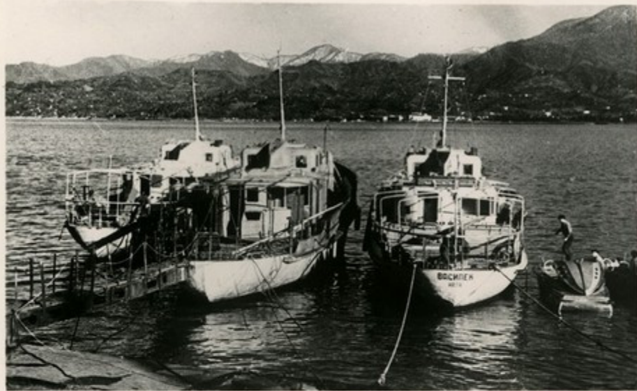
Готовые теплоходы на рейде.

Красивы, удобны и комфортабельны пассажирские теплоходы производства Батумского судостроительного завода. Они бороздят морскую гладь во многих портах Черноморья. В семилетке выпуск продукции завода увеличится в 2 раза.