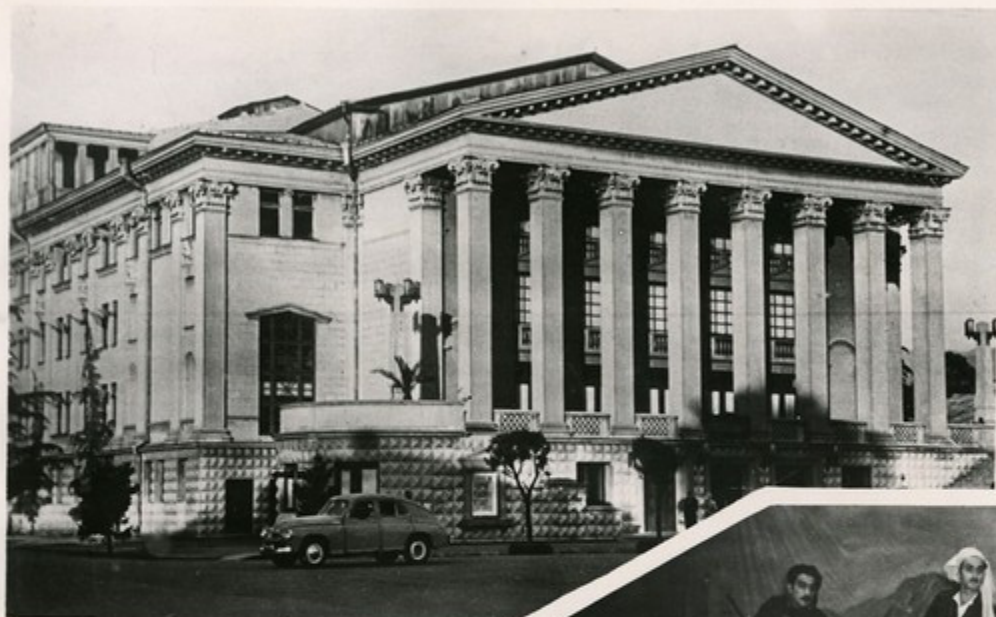
Батумский государственный театр имени И. Чавчавадзе.

Сцена из пьесы поэта-драматурга Ф. Халваши „Зов Хихани“.