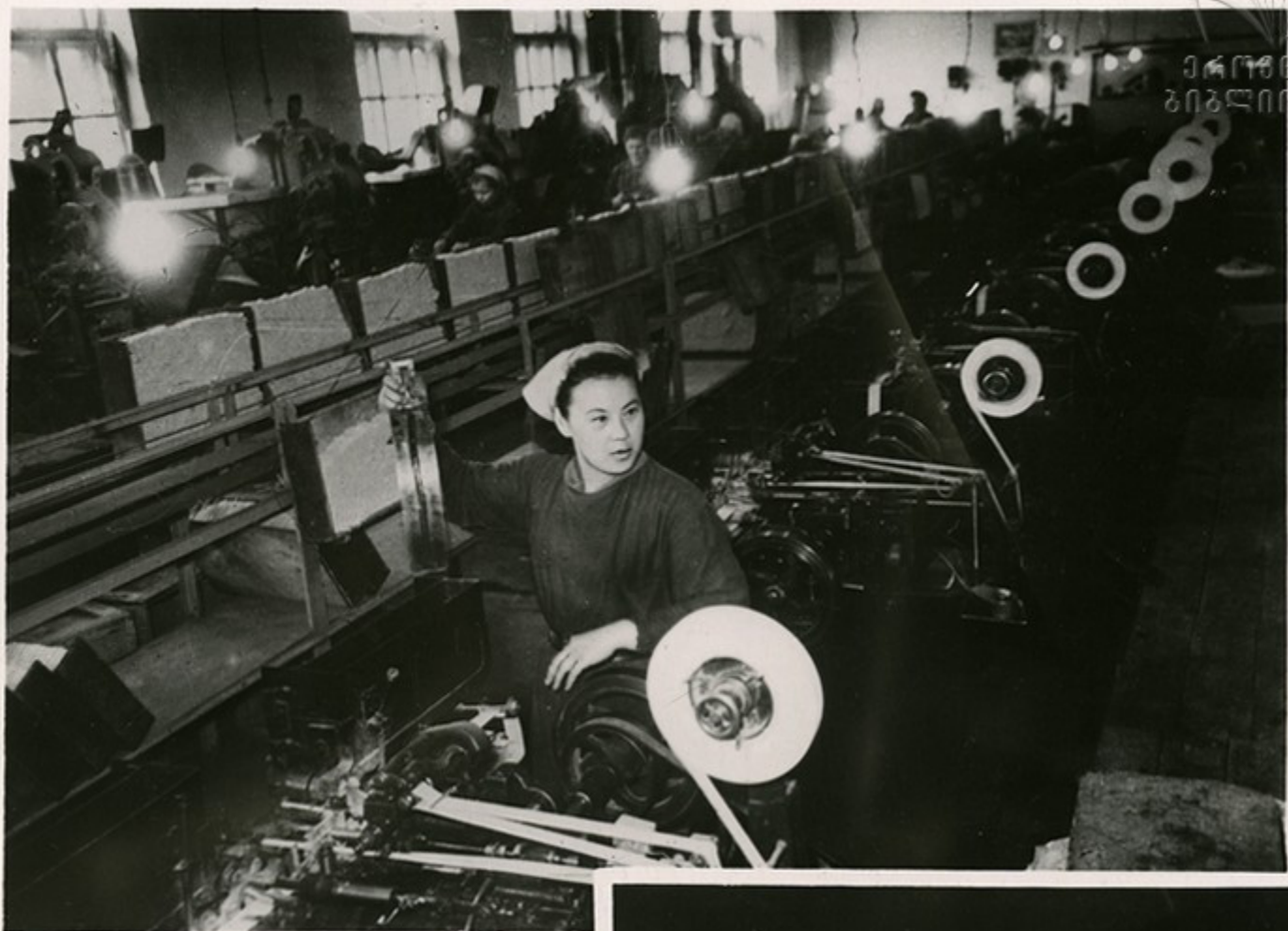
Поточная линия табачной фабрики.

Мощное развитие получит в семилетке легкая и пищевая промышленность Аджарии. Будет выпускаться значительно больше предметов широкого потребления, обуви, готовой одежды, кожевенных товаров, хлебобулочных изделий. За семилетие будут сооружены мебельный комбинат, механизированный хлебозавод, комбинаты бытового обслуживания населения, в районах — маломощные консервные заводы.