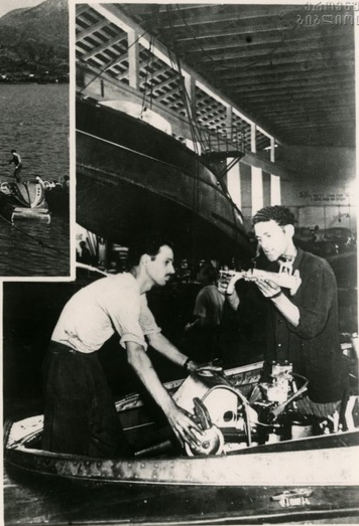
В сборочном цехе.

Красивы, удобны и комфортабельны пассажирские теплоходы производства Батумского судостроительного завода. Они бороздят морскую гладь во многих портах Черноморья. В семилетке выпуск продукции завода увеличится в 2 раза.