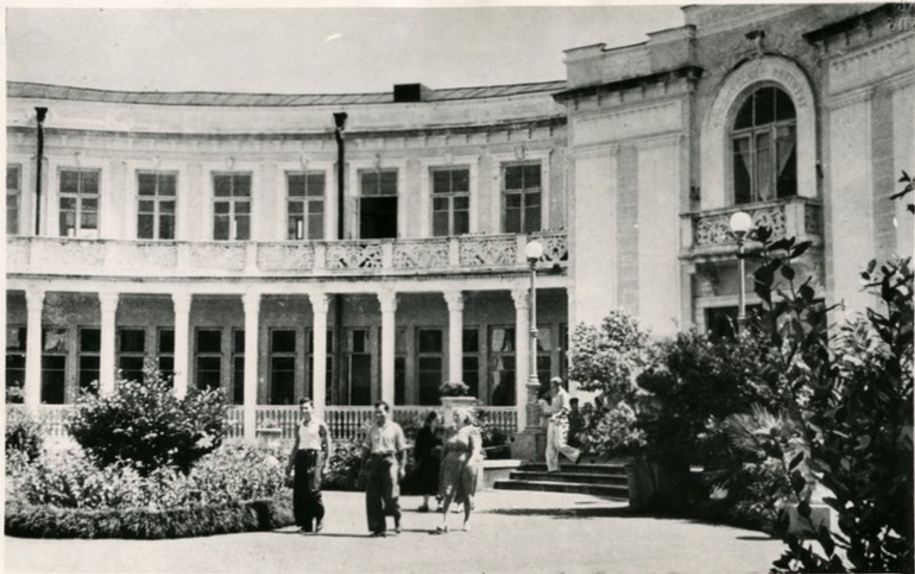
За годы Советской власти в Аджарии создана широкая сеть лечебно-профилактических учреждений, улучшилось медицинское обслуживание населения. За семилетие количество коек в больницах Аджарии увеличится в полтора раза, вырастет число врачей и среднего медицинского персонала. В Кобудети завершится строительство больницы на 100 коек, будет построена новая больница в Батуми. На снимке: городская больница № 1 в Батуми.