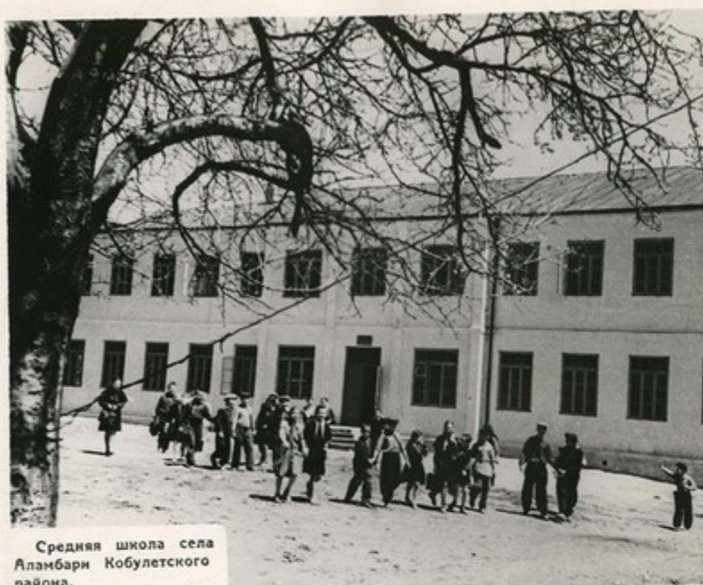
Средняя школа села Аламбари Кобулетского района.

В Аджарской АССР полностью ликвидирована неграмотность. В общеобразовательных школах республики учатся 44.500 человек. К 1965 году сеть школ значительно возрастет. В 14 раз увеличится количество школ-интернатов. К 1965 году количество учащихся в начальных, 8-летних и средних школах достигнет 53.310 человек.