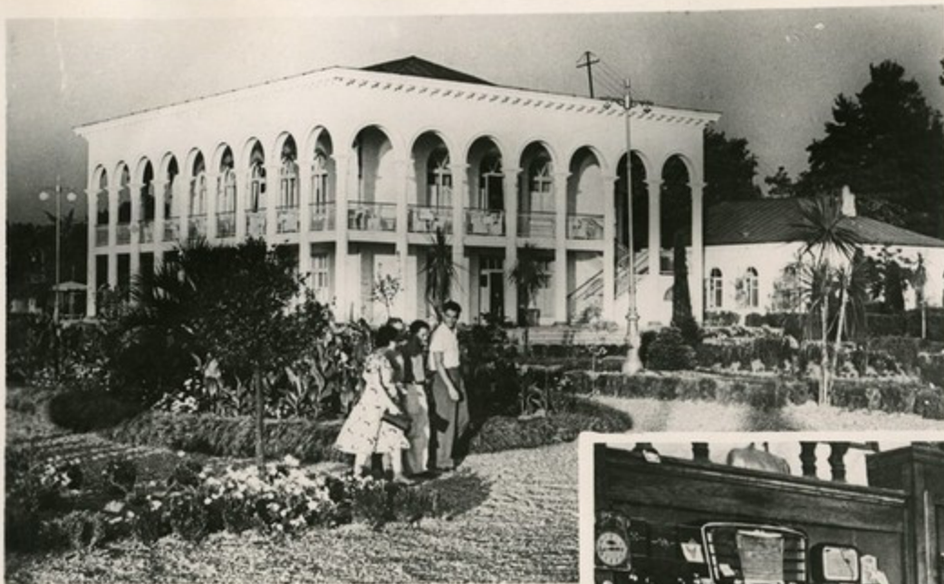
Новый ресторан в Батумском приморском парке.