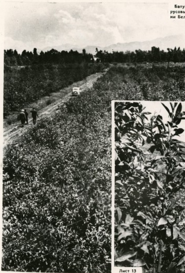
Цитрусовые плантации Цихисдзирского совхоза.

В семилетке увеличится площадь citrusовых насаждений. К 1965 году их площадь составит 6.241 гектар—на 1.000 гектаров больше, чем в 1958 году. В текущем году citrusоводы Аджарии дадут стране 450—500 миллионов штук плодов, а в конце семилетки—600 миллионов штук citrusовых плодов.