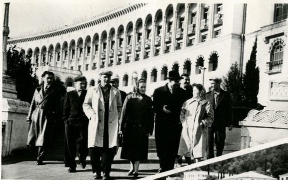
Интернациональная группа отдыхающих цхалтубского санатория «Шахтер»