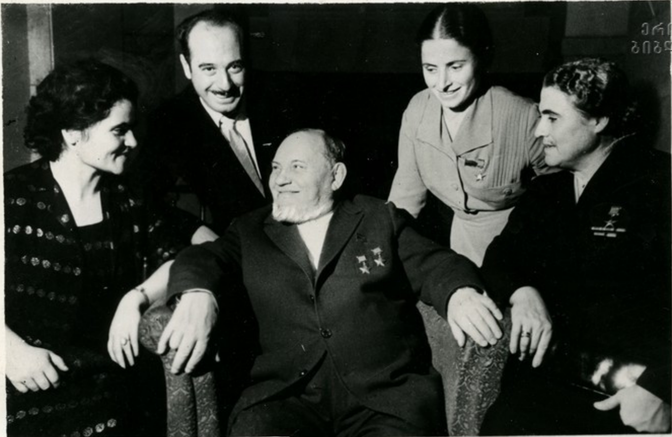
Дважды Герой Советского Союза С. А. Ковпак с делегатами XXII съезда КПСС из Грузии

„В советских республиках совместно живут и трудятся люди многих национальностей. Границы между союзными республиками в пределах СССР все более теряют свое бывшее значение, поскольку все нации равноправны, их жизнь строится на единой социалистической основе и в равной мере удовлетворяются материальные и духовные запросы каждого народа, все они объединены общими жизненными интересами в одну семью и совместно идут к единой цели—коммунизму“.