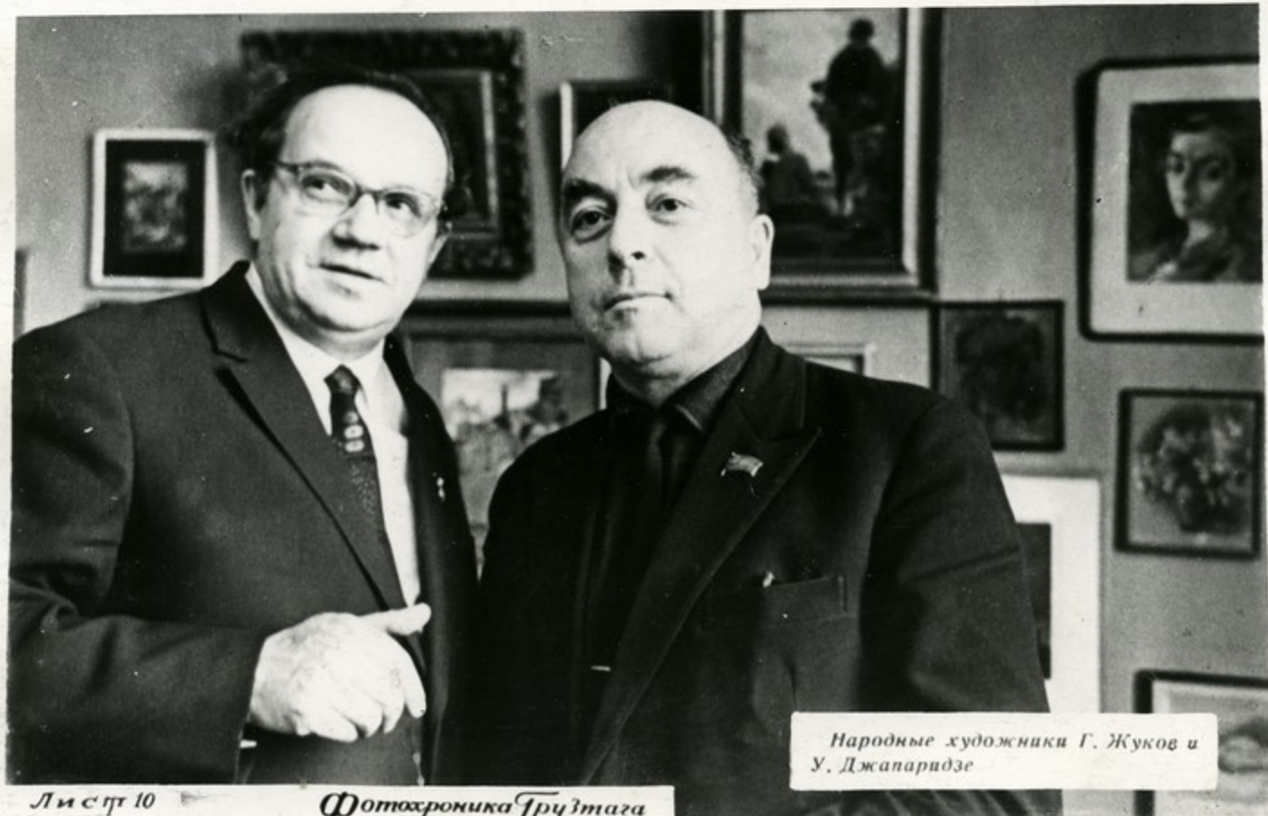
Народные художники Г. Жуков и У. Джапаридзе

Культурная сокровищница каждой нации все больше обогащается творениями, приобретающими интернациональный характер. (ИЗ ПРОГРАММЫ КПСС)