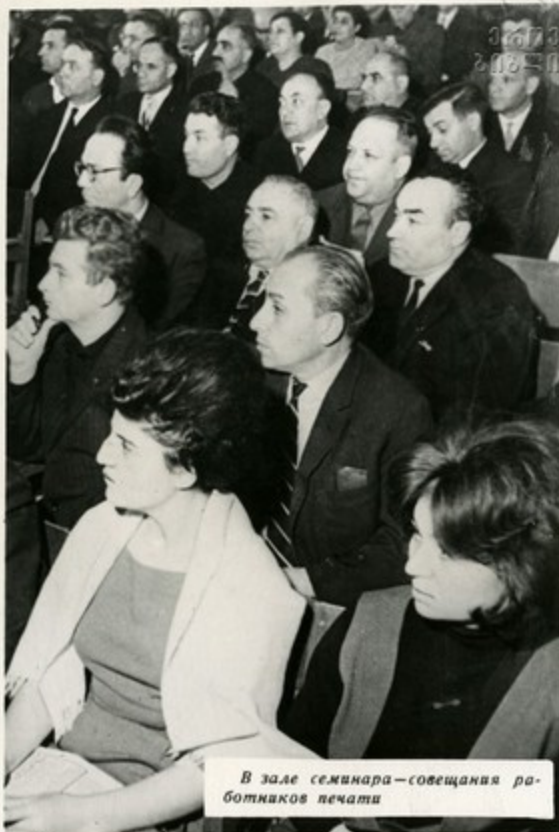
В зале семинара—совещания работников печати

О необходимости всемерно совершенствовать формы и методы выступлений печати, повышать их действенность, пропагандистскую целеустремленность вели разговор на своем большом совете журналисты Закавказья. Важнейшей темой была тема дружбы народов.