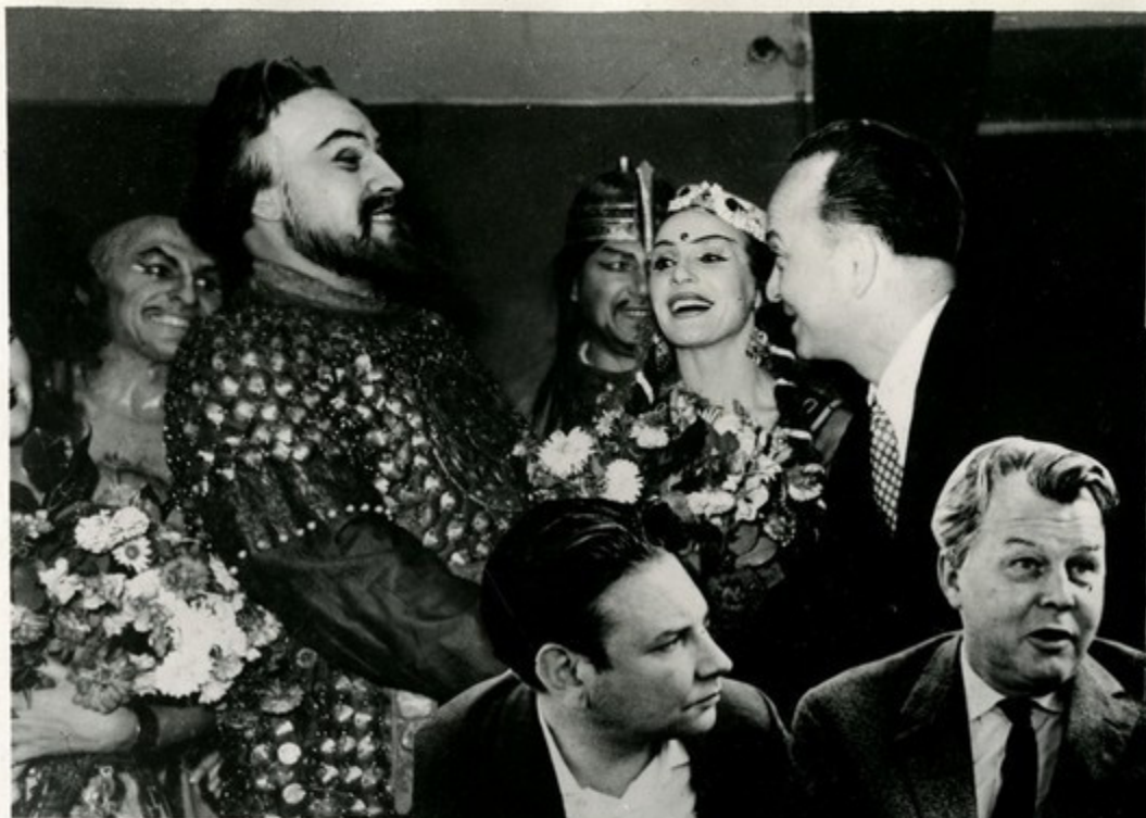
На снимках: композитор А. Мачавариани с артистами Большого театра, справа — поэты Н. Доризо, А. Твардовский и И. Абашидзе за дружеской беседой.