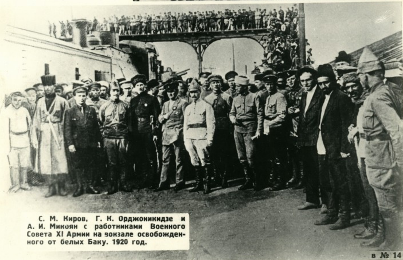
С. М. Киров, Г. К. Орджоникидзе и А. И. Микоян с работниками Военного Совета XI Армии на вокзале освобожденного от белых Баку. 1920 год.