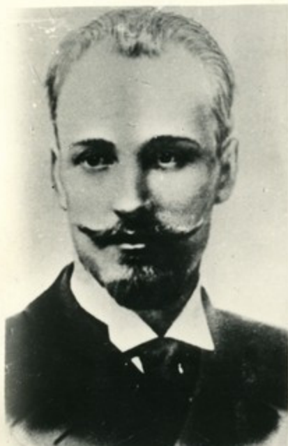
Н. Э. Бауман (1873—1905 гг.) — руководитель Московского комитета партии.