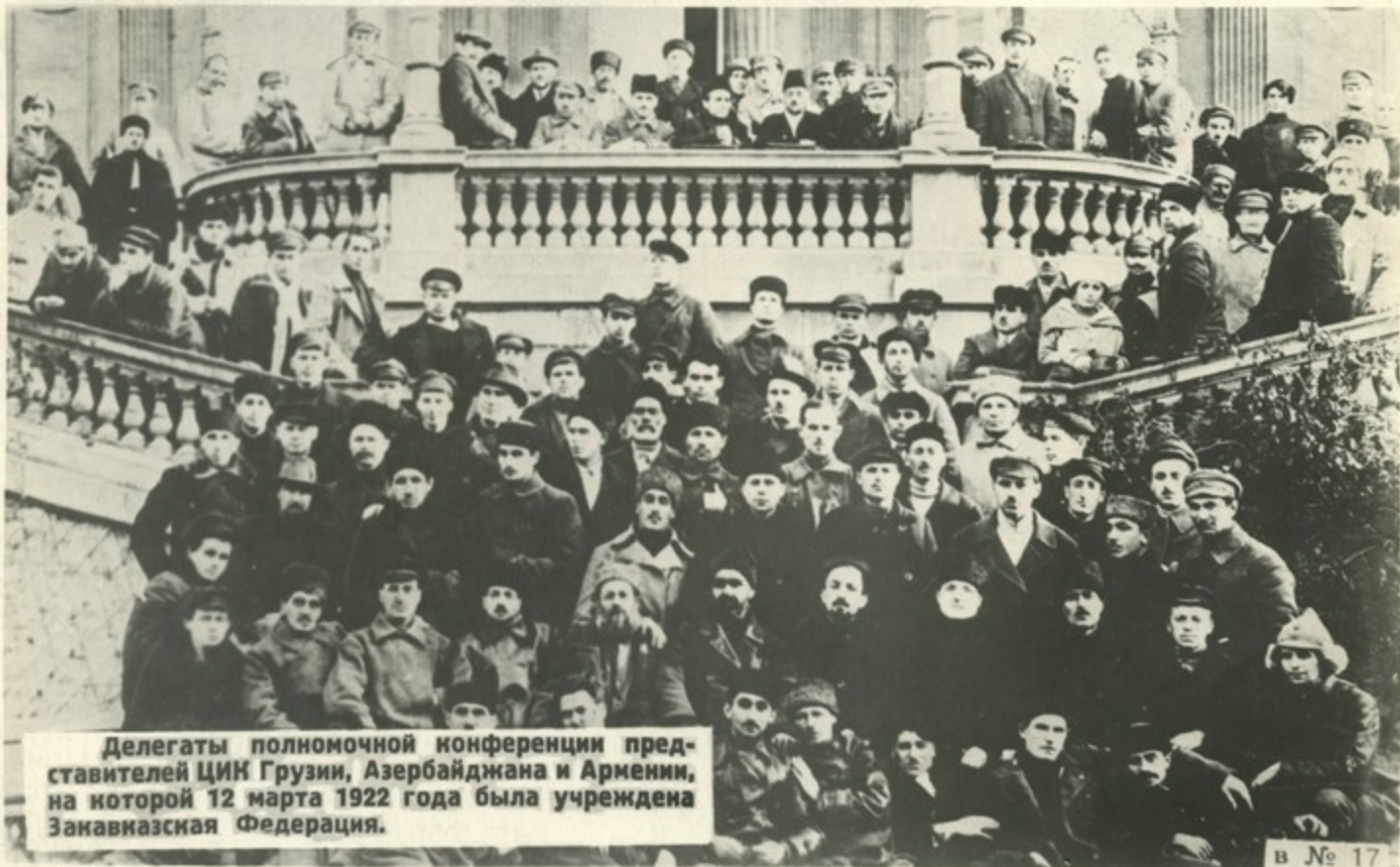
Делегаты полномочной конференции представителей ЦИК Грузии, Азербайджана и Армении, на которой 12 марта 1922 года была учреждена Закавказская Федерация.

Закавказская Федерация была образована как временная, переходная форма, для урегулирования межнациональных отношений, преодоления разрухи и сплочения многонационального Закавказья. Федерация просуществовала до 1936 года.