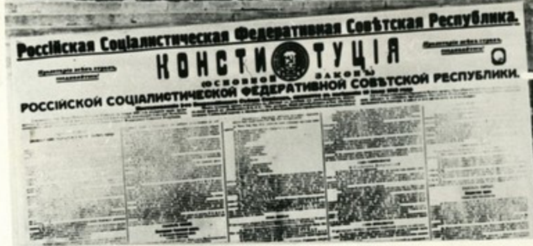
4 июля 1918 года V съезд Советов утвердил первую Конституцию РСФСР. По предложению В. И. Ленина, в текст Конституции была включена „Декларация прав трудящегося и эксплуатируемого народа“, добавлена статья о равноправии национальностей и рас в Советской республике.