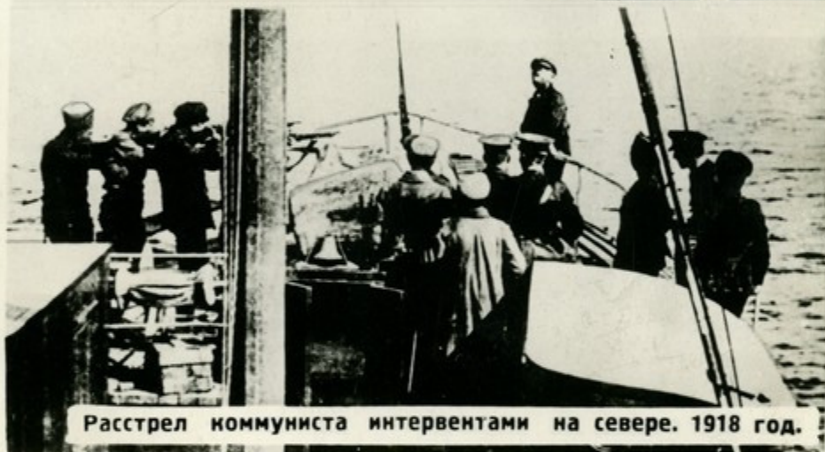
Расстрел коммуниста интервентами на севере. 1918 год.

Войска интервентов установили в захваченных ими районах террористический режим, возвращали землю помещикам, предприятия капиталистам, грабили страну, вывозили богатства России.