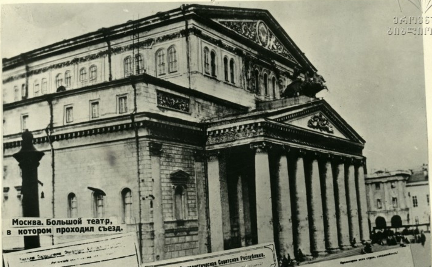
Москва. Большой театр, в котором проходил съезд.