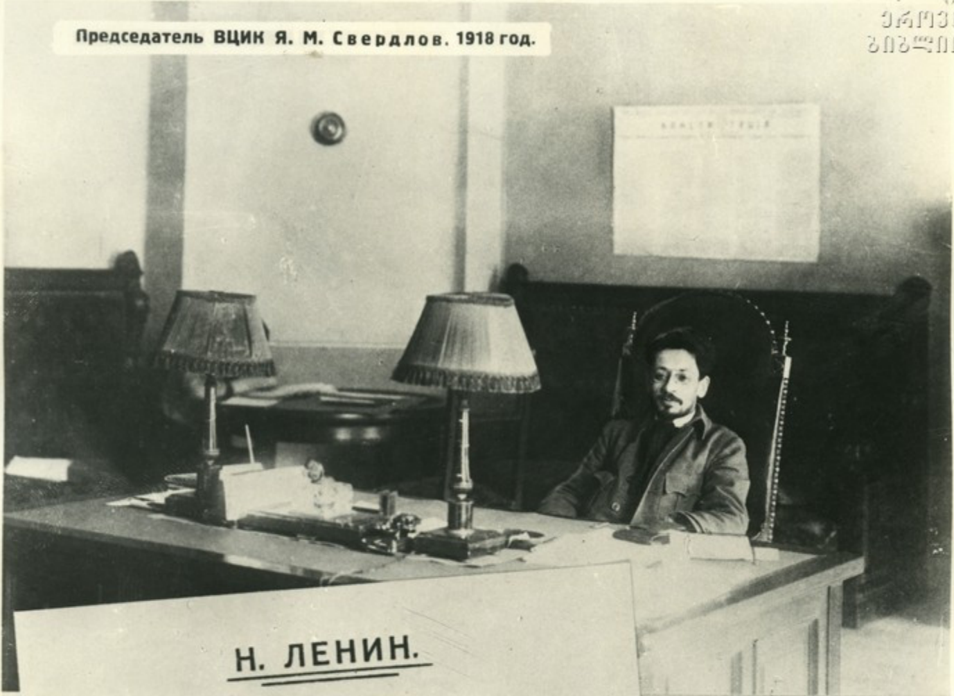
Председатель ВЦИК Я. М. Свердлов. 1918 год.