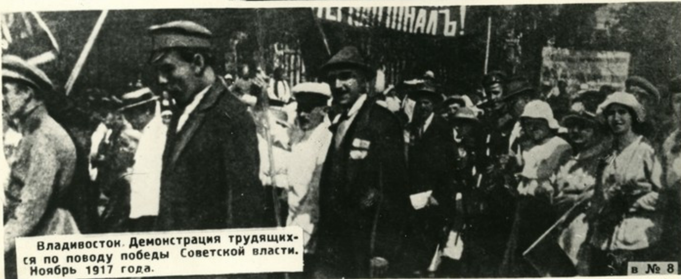
Владивосток. Демонстрация трудящихся по поводу победы Советской власти. Ноябрь 1917 года.