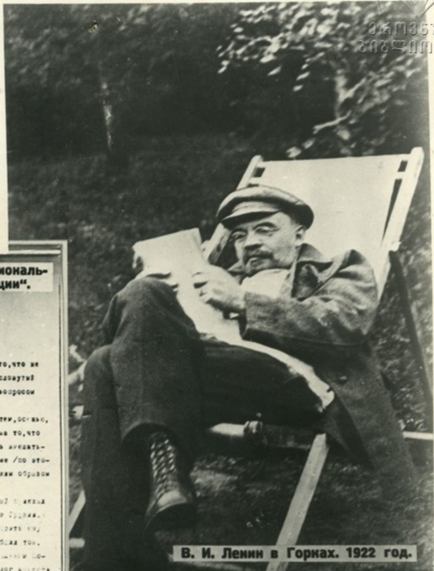
В. И. Ленин в Горках. 1922 год.

Искр. рус. мо- вашицу отбивая Го- ме на фига, а на сифре как только притворил у крохотного зуба, с кем Его всем здорованом Зубами. Надо абсолютно на сифре, чтоб в содвиги