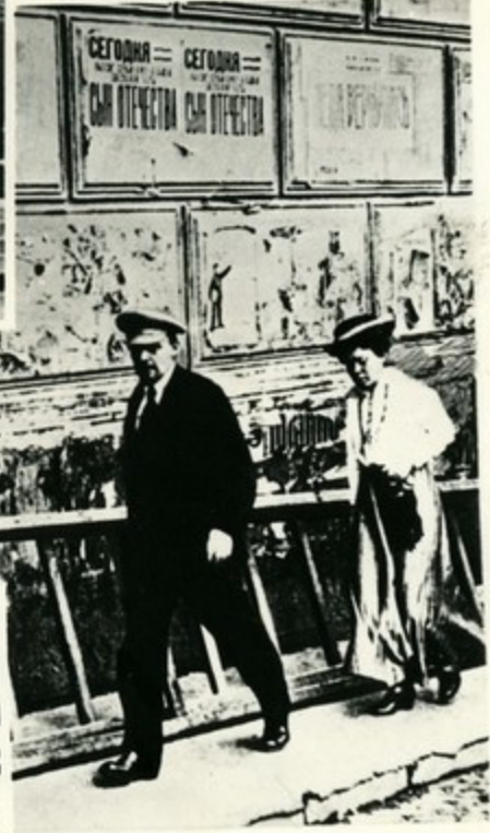
В. И. Ленин и М. И. Ульянова направляются в Большой театр на заседание V Всероссийского съезда Советов. Москва. 5 — 9 июля 1918 года.