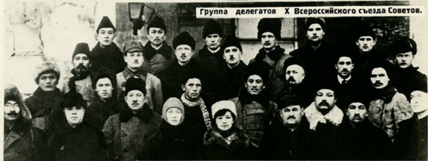
Группа делегатов X Всероссийского съезда Советов.

„Мы хотим добровольного союза наций, — такого союза, который не допускал бы никакого насилия одной нации над другой...“