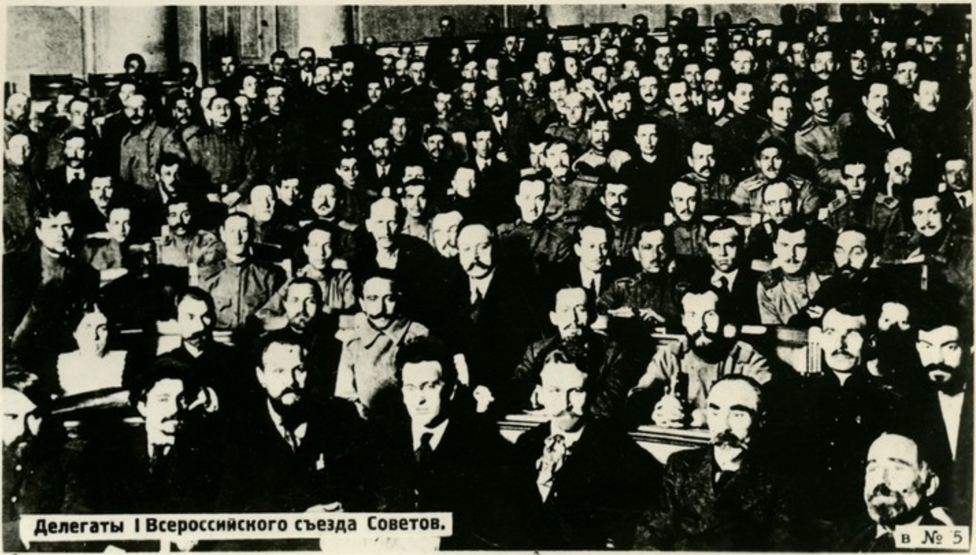
Делегаты I Всероссийского съезда Советов.

Разъясняя точку зрения большевиков по национальному вопросу на Первом Всероссийском съезде Советов в июне 1917 года, В. И. Ленин сказал: „Мы хотим единой и нераздельной республики российской с твердой властью, но твердая власть дается добровольным согласием народов“.