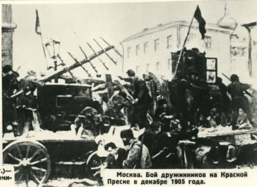
Москва. Бой дружинников на Красной Пресне в декабре 1905 года.

В. И. Ленин подчеркивал историческую роль Советов как зародыша диктатуры революционного народа.