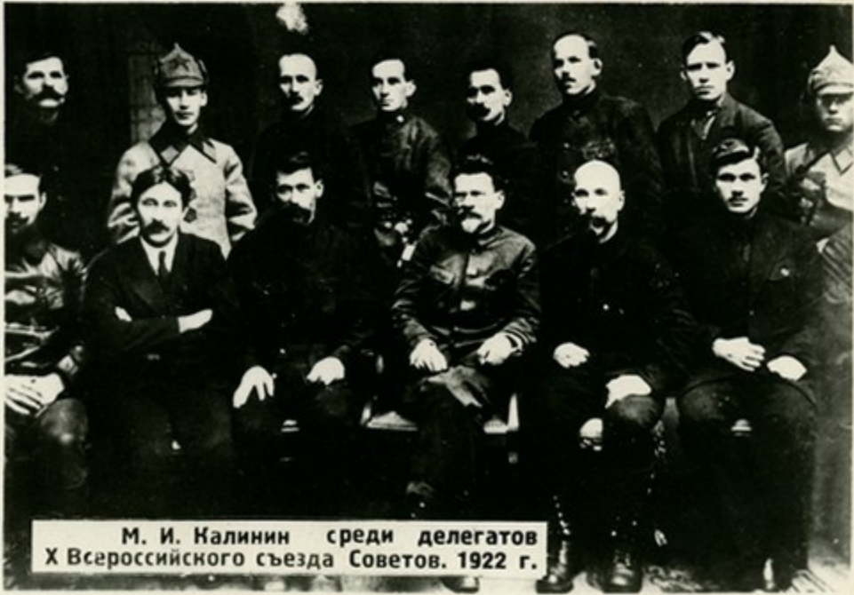
М. И. Калинин среди делегатов X Всероссийского съезда Советов. 1922 г.