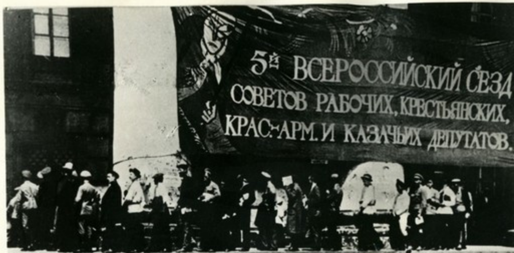
Делегаты V Всероссийского съезда Советов у Большого театра, в котором проходил съезд. Москва, 1918 год.