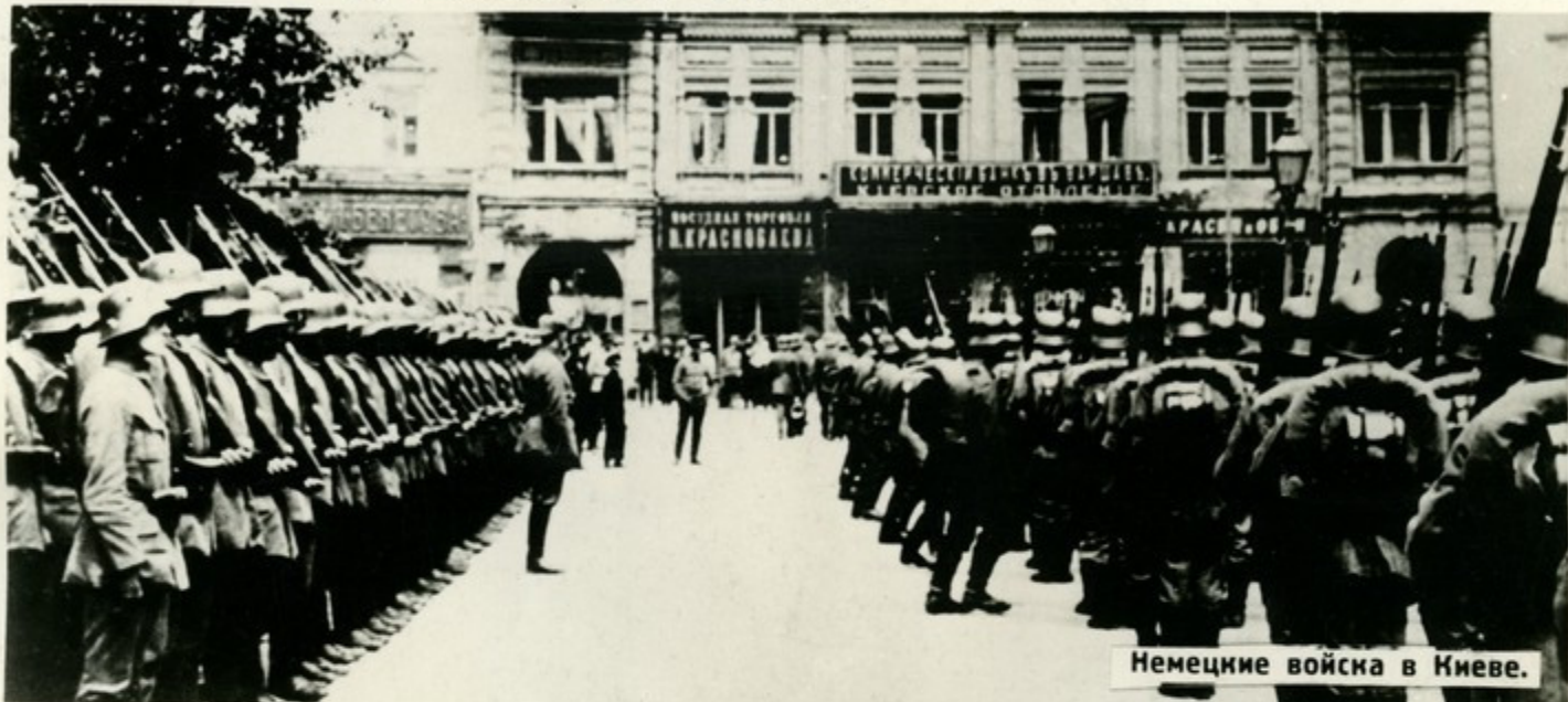
Немецкие войска в Киеве.

Войска интервентов установили в захваченных ими районах террористический режим, возвращали землю помещикам, предприятия капиталистам, грабили страну, вывозили богатства России.