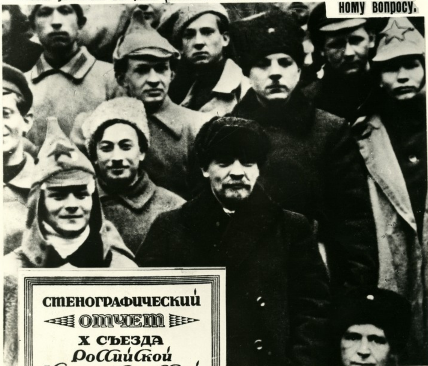
В. И. Ленин и К. Е. Ворошилов в группе делегатов X съезда РКП(б). Москва, март 1921 г.

Огромную роль в определении национальной политики партии в новых условиях сыграло решение X съезда РКП(б) по национальному вопросу.