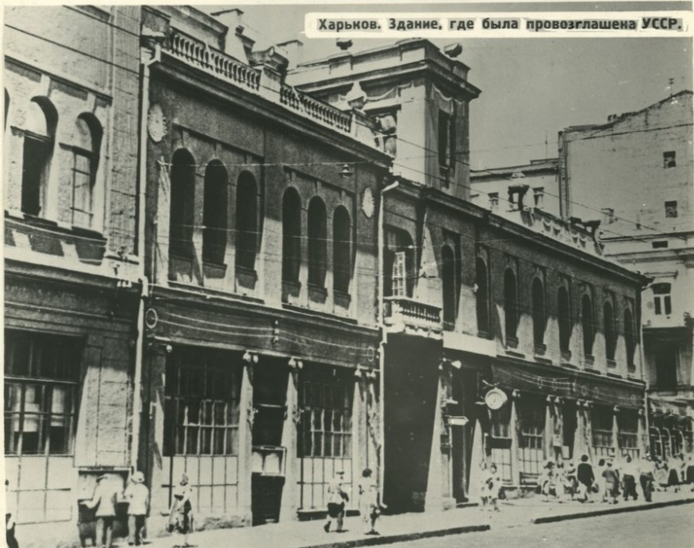
Харьков. Здание, где была провозглашена УССР.

25 декабря 1917 года в г. Харькове состоялся I Всеукраинский съезд Советов. Съезд принял решение об установлении Советской власти на территории всей Украины, объявил Украину республикой Советов рабочих, крестьянских и солдатских депутатов.