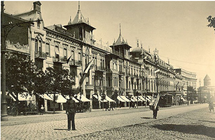
„არფასტო“ – თანამედროვე შოთა რუსთაველის თეატრისა და კინოს სახელმწიფო უნივერსიტეტი