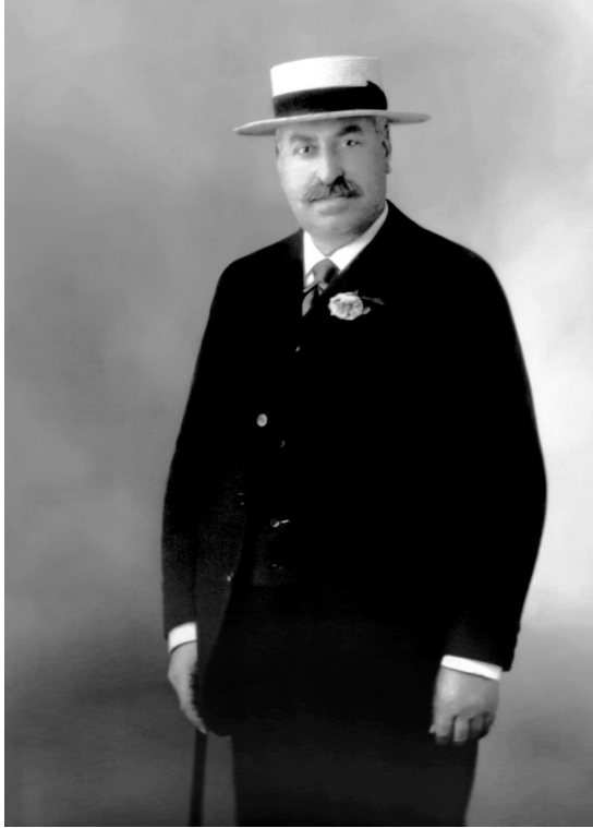
ალექსანდრე მანთაშევი (1842-1911 წწ.)