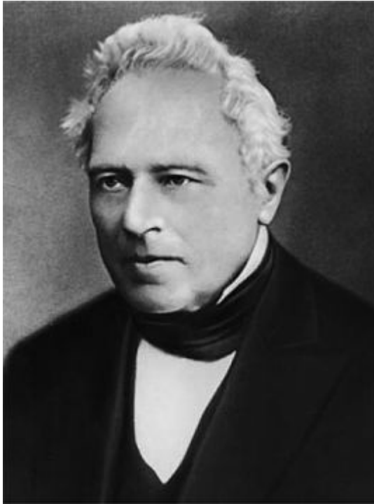
ჰერმან აბიხი (1806-1886 წწ.)

მოსხენებითი ბარათი. 1858 წელს იმავე „სამთო ჟურნალში“ აბიხმა ვრცელი გამოკვლევა გამოაქვეყნა ჭიათურის საბადოზე. გამოკვლევების მიუხედავად, ბუნების ეს სიმდიდრე ხელუხებელი რჩებოდა, ვიდრე აკაკი წერეთლის უშუალო ინიციატივითა და ხელმძღვანელობით არ დაიწყო ჭიათურის მანგანუმის საბადოს გეოლოგიური გამოკვლევა და შემდეგ უკვე მადნის დამუშავება 50 . 1872 წელს,