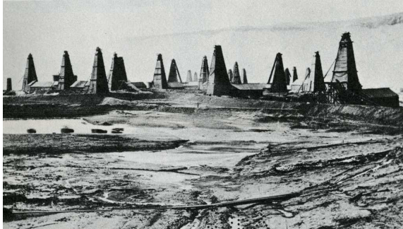
ბაქო XIX საუკუნის ბოლო მეოთხედში

და კაიროში (ეგვიპტე). ამის გარდა წამორმადგენლობები ჰქონდა ჩამოყალიბებული დასავლეთ ევროპისა და შორეული აღმოსავლეთის ისეთ ქალაქებში როგორებიცაა მარსელი, ლონდონი, ბომბეი და შანხაი.