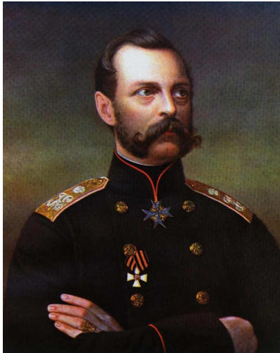
ალექსანდრე II (1818-1881 წწ.)

ან დაქირავება აეკრძალათ. თუმცა კანონს დიდი გავლენა არ მოუხდენია როტშილდების გეგმებზე და 1883 წელს ბაქო-ტფილისის რკინიგზა გაიხსნა 92 . აღნიშნული რკინიგზის წლიური გამტარუნარიანობა 5 მილიონ ფუტს შეადგენდა. ერთი გზის დასაფარად ეშელონი, რომელიც 9 ვაგონ-ცისტერნისაგან შედგებოდა, ანდომებდა დაახლოებით 60-70 საათს. 1888 წლისთვის ამხანაგობა “Branobel”-ი ფლობდა 465 კერძო ვაგონს, რომლებიც ბაქო-ბათუმის რკინიგზისათვის იყო გათვლილი 93 . ამან კი უბიძგა როტშილდებს 1886 წელს დაეარსებინათ “Société Commerciale et Industrielle de Naphte Caspienne et de la Mer Noire” (კასპიისა და შავი ზღვის ნავთობის კომპანია), უფრო ცნობილი რუსული აბრევიატურით – «БНІТО» 94 .