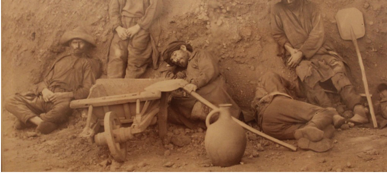
მუშები ქიათურაში მანგანუმის მოპოვებისას

მუშათა მდგომარეობა უაღრესად მძიმე იყო 62 . უცხოელი მომპოვებელნი სრულიად არ ზრუნავდნენ მათთვის საბინაო პირობების შექმნაზე. მუშები უმთავრესად ბარაკებსა და ფაცხებში ცხოვრობდნენ. მოგვიანებით აშენდა ყაზარმები, სადაც ერთ ოთახში (ვენტილაციის გარეშე) 15-20 მუშა ცხოვრობდა. მუშები იწვნენ დაფლეთილ ლოგინებში ხის საერთო სანოლებზე, ხოლო სახურავების უვარგისობის გამო ყაზარმებში წვიმა ჩამოდიოდა. ასევე ძალიან ცუდი იყო მუშათა სანარმოო პირობები 63 . მუშებს ყოველ წუთში საფრთხე ემუქრებოდათ გვირაბების მოსალოდნელი ჩამონგრევის გამო 64 . მაღაროებში ძირითადად ხმარობდნენ წერაქვსა და ნიჩაბს. მადნის გამოტანა ხდებოდა ურიკებით, ანდა რონოდებით, რომლებიც მოძრაობაში მოჰყავდათ მუშებს ან ცხენს 65 . 1895 წლამდე, ქიათურის რკინიგზის შტოს გაყვანამდე, მადნის გადაზიდვა რკინიგზის უახლოეს შორაპნის სადგურამდე საჭაპანო და საპალნე ტრანსპო-