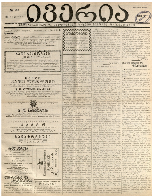
გაზეთ „ივერიის“ ერთ-ერთი ნომრის პირველი გვერდი

სასტუმროს აღწერა არ გამოირჩეოდა განსაკუთრებული დეტალების გადმოცემით, თუმცა, ამისგან განსხვავებით, სასტუმრო „პურ-ლვინოს“ აღწერილობა ბევრად მეტ დეტალს იძლევა: „ორი თავი საქმელი (ორჯერადი კვება – ე. ა.) ჰლირს თვეში 12 მან. სამი თავი - 18 მან. ღვინითა, არყითა და ყავით მსურველებთან განსაკუთრებული და მეტად სახირო პირობებით შეიძლება მორიგება“ 17 .