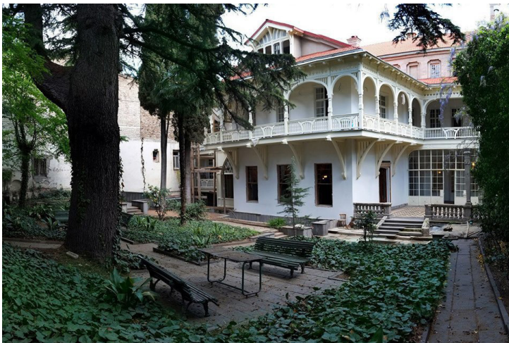
„მწერალთა სახლი“ თბილისში

მისი ყველაზე ცნობილი საჩუქარი იყო საჯარო აუქციონზე შეძენილი ცნობილი მრეწველისა და საზოგადო მოღვაწის დავით სარაჯიშვილის სახლი. სხვადასხვა მონაცემებით, როდესაც 1918 წელს სახლი იყიდებოდა, ტფილისელებმა თხოვნით მიმართეს აკაკის მის შესაძენად 135 . აკაკი ერთი პერიოდი ამ სახლში თვითონ ცხოვრობდა და მის გადასაკეთებლად იტალიიდან ლომის ფიგურები და სხვა ანტიკვარული ნივთები ჩამოიტანა, მოაწყო საზაფხულო და ზამთრის ბალები. ეს სახლი აკაკიმ სხვა ქონებასთან ერთად ქვეყანას საჩუქრად დაუტოვა ემიგრაციაში წასვლის შემდეგ. სწორედ ამ სახლში განთავსდა დღეს ცნობილი „მწერალთა სახლი“.