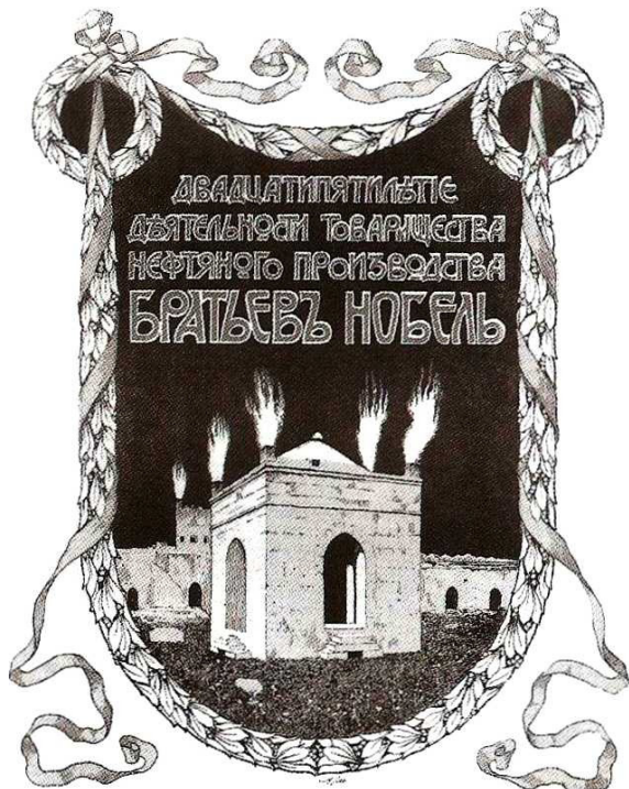
კომპანია "Branobel"-ის ლოგო

XIX საუკუნის 80-იან წლებამდე ნობელები ბაქოდან საზღვარგარეთ ნავთობის გატანას ფოთისა და ბალტიის ზღვის ნავსადგურებიდან აწარმოებდნენ, რაც საკმაოდ ძვირი ჯდება და ამიტომაც მრეწველები ალტერნატიულ გზებს იძიებდნენ. საუკეთესო ვარიანტად ბათუმი განიხილებოდა, თუმცა, ვიდრე ქალაქი თურქების ხელში იყო, ამ მარშრუტს ვერ გამოიყენებდნენ. ვითარება შეიცვალა 1877-1878 წლებში რუსეთის ოსმალეთთან ომში გამარჯვებისა და ბათუმის შემოერთების შემდეგ. ამით ხელ-