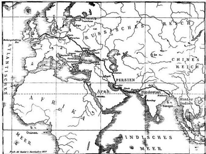
„ინდოეთის ტელეგრაფის“ ერთ-ერთი რუკა

ტერიტორიაზე ბოლო დრომდე ჯერ კიდევ იყო შემორჩენილი ამ ტელეგრაფის ლითონის ბოძები წარწერით – “Siemens-Patent-London” 79 .