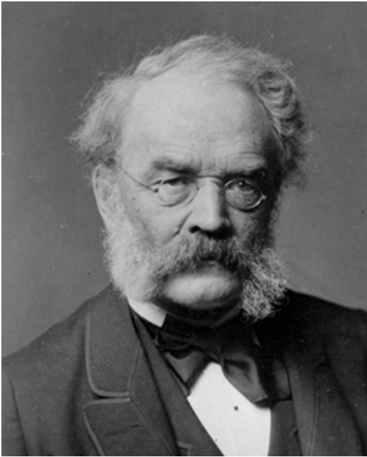
ვერნერ სიმენსი (1816-1892 წწ.)

ნანილობრივ გააუმჯობესეს იმპერიის შიდა მდგომარეობა. განვითარების ტემპები საგრძნობლად ჩამორჩებოდა დასავლეთ ევროპისას და ამიტომაც რუსეთის მმართველი ელიტა ყველანაირად