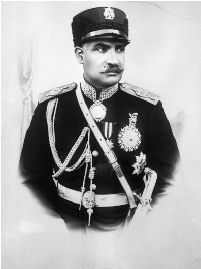
რეზა შაჰი (1878-1944 წწ.)

ზე, რომ მიუხედავად პოლიტიკური სისტემების შეცვლისა ის ახერხებდა კარგი ურთიერთობის დაჭერას ყველა მმართველთან.