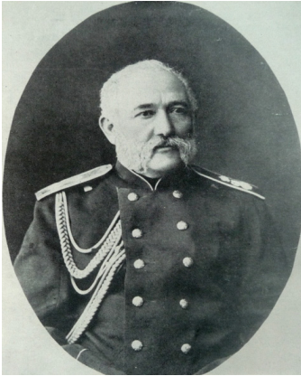
გრიგოლ ორბელიანი (1804-1883 წწ.)

მათი ამიერკავკასიაში საქმიანობა წარმოადგენდა. ესმოდათ რა, როგორი მნიშვნელოვანი ადგილმდებარეობა ჰქონდა ტფილისს, როგორც მთელი კავკასიის ცენტრს, ხოლო კავკასიას, როგორც ევროპისა და აზიის შემაერთებელ რეგიონს, მათ ვენისა და სანქტ-პეტერბურგის შემდეგ თავიანთი ერთ-ერთი პირველი ფილიალი სწორედ ტფილისში დააფუძნეს 72 . ქალაქის ადგილმდებარეობა შესაძლებელს ხდიდა ტფილისიდან ახლო აღმოსავლეთსა და შორეულ ინდოეთთან კავშირის გაბმას. სიმენსებმა ასევე ფოთისა და ბათუმის პორტების პოტენციური გამოიყენეს საქართველოსა და თანამედროვე აზერბაიჯანის ტერიტორიაზე მოპოვებული ნაწარმის ევროპაში საექსპორტოდ.