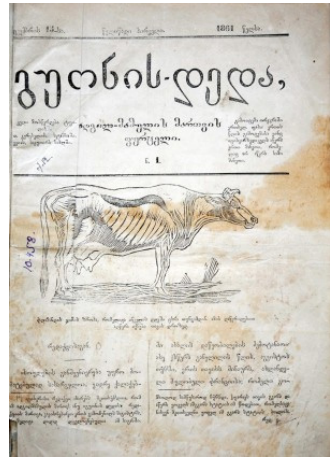
პირველი ქართული სასოფლო-სამეურნეო ორკვირეული ჟურნალი „გუონის დედა“ (1861 წ.)

XIX-XX საუკუნეების მიჯნაზე საქართველოში სარეკლამო ბიზნესისა და განსაკუთრებით საგაზეთო რეკლამების განცხადებების განვითარების შესახებ საკმაოდ ცოტა რამ არის ცნობილი. მკვლევარებმა აღნიშნული საკითხით ეხლაზნანს დაიწყეს დაინტერესება. ხშირია ცალკეული ინტერვიუები, ვიდეო ბლოგები ან ინტერნეტში დაუმონუმბელი ინფორმაციის განთავსება. ეს კარგად ასახავს იმ მდგომარეობას, რომ რამოდენიმე მცირე გამოწვევის გარდა 14 , პირველ ქართულ რეკლამაზე საკმაოდ ცოტა