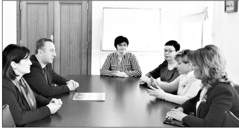
ბის გზით. საზი გაუსვეს გურიის ტურიზმის სტრატეგიის მნიშვნელობას და იმ დღეებით ტენდენციებს, რაც რეგიონის მაგალითზე უკვე ნათლად შესაჩვენია. შეხვედრის ბოლოს, რწმუნებულმა მდლობა გადაუსცა სტუმრებს ადმოსავლეთ ვერობის ინიციატივების კონგრესზე მიწვევისა და ნაყოფიერი თანამშრომლობისთვის.