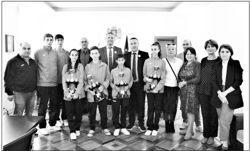
10-14 ოქტომბერს კიევა მხიარულ სტარტებში პირველ სასკოლო მსოფლიო ჩემპიონატს უმასპინძლა. ასპარეზობაში საქართველოს სახელით მონაწილეობდნენ მხიარული სტარტების პირველი