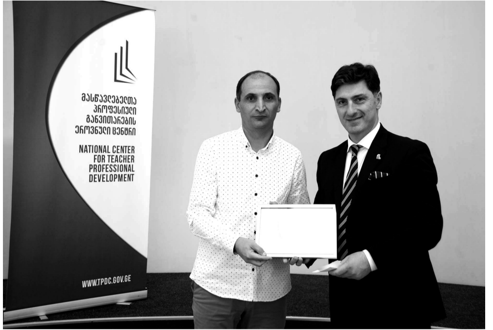
სპეციალური ჯილდოა განკუთვნილი იმ „დამსახურებული მასწავლებლები-სათვის“, რომელთაც განსაკუთრებული წვლილი მიუძღვით ამ პროფესიის განვითარებაში.

მასწავლებელთა პროფესიული განვითარების ეროვნული ცენტრი 2019 წელს ყველა საგანში გამოავლენს საუკეთესო მასწავლებელს. ასევე, დაგეგმილია კონკურსი „წლის საუკეთესო სკოლის დირექტორებისთვის“. ამასთან ერთად,