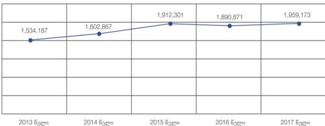
მუნიციპალიტეტების ბიუჯეტის შემოსულობები 2013-2017წწ. (მლნ. ლარი)

საქართველოში ადგილობრივი თვითმმართველობის სისტემის ერთ-ერთ ყველაზე მნიშვნელოვან საკითხად კვლავ ფისკალური დეცენტრალიზაცია რჩება. 2015-2017 წლების მუნიციპალიტეტის ბიუჯეტის შემოსულობების შეფარდება სახელმწიფო ბიუჯეტის შემოსულობებთან მიმართებით შემცირდა. კერძოდ, 2015 წელს აღნიშნული მაჩვენებელი შეადგენდა 23,4%-ს, 2016 წელს – 22%-ს, ხოლო 2017 წელს – 20,1%-ს. კვლავ მცირეა მუნიციპალიტეტების (თბილისის გარდა) ბიუჯეტის შემოსულობების წილი მთლიან შიდა პროდუქტთან მიმართებაში. აღნიშნული მაჩვენებელი 2015 წელს – 3,16% იყო, 2016 წელს – 3,21%, 2017 წელს – 3,06%. ამ ორი მაჩვენებლის გათვალისწინებით შეგვიძლია დავასკვნათ, რომ ფისკალური დეცენტრალიზაციის დონე საქართველოში არ გაუმჯობესებულა.