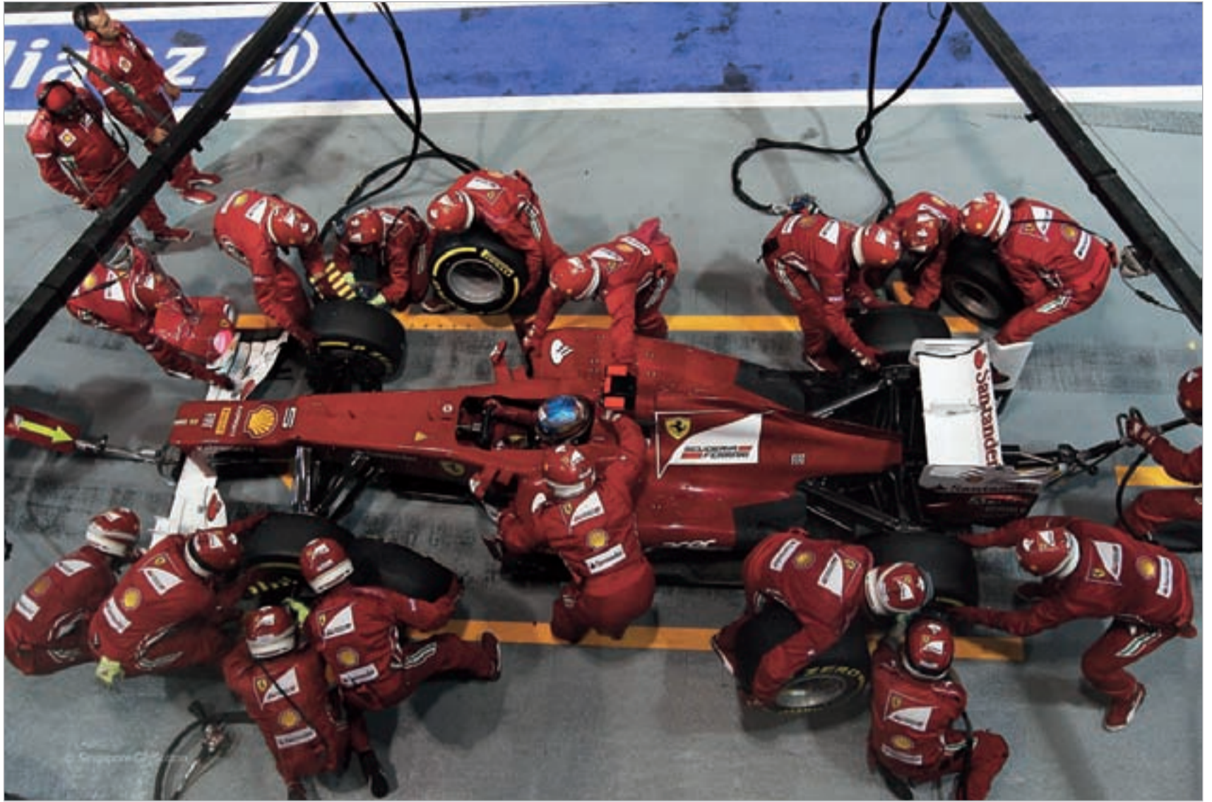
დარჩენილ ხუთ ეტაპზე სრულიად "ფერარი" ალონსოზე იმუშავებს

"დადგა დრო, როცა მინდა დავრწმუნდე, რომ "ფერარის" გუნდი რჩება ისეთად, როგორსაც აქამდე ვიცნობდი. მან უნდა შეინარჩუნოს თვითმყოფადობა და შეძლოს ფოკუსირება დასახულ მიზნებზე. ფერნანდოს დავუკავშირდები, რათა მივცე ის მოტივაცია, რომელიც