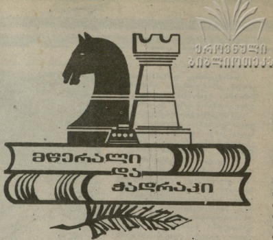
ოთარ ჯინორია (1931)