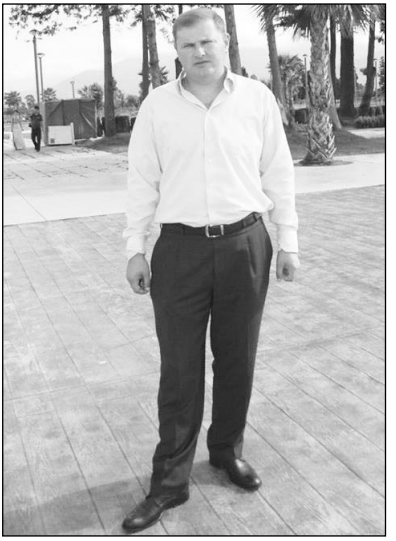
ბილი. ვერ-ვერობით უცნობია, თუ ვინ დაიკავებს აღნიშნულ პოსტს.

თუ ვინ დაინიშნება კომისიის თავმჯდომარის ვაკანტურ თანამდებობაზე, 10 დღის განმავლობაში გახდება ცნო-