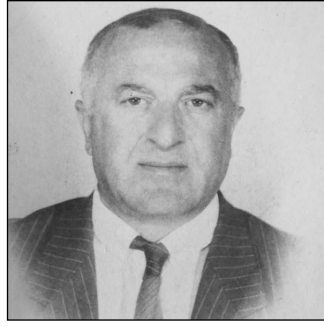
ლად მოსიყვარულე მამა, მუელე

და ბაბუა, კაცობაში გამოჩენილი კაცი იყავი, კარგი მოქიფე, მეგობრის გვერდში მდგობი, ნათესავებზე გადაყოლილი. ეს შენი ასაკისთვის ცოტა მეტიც კი იყო.