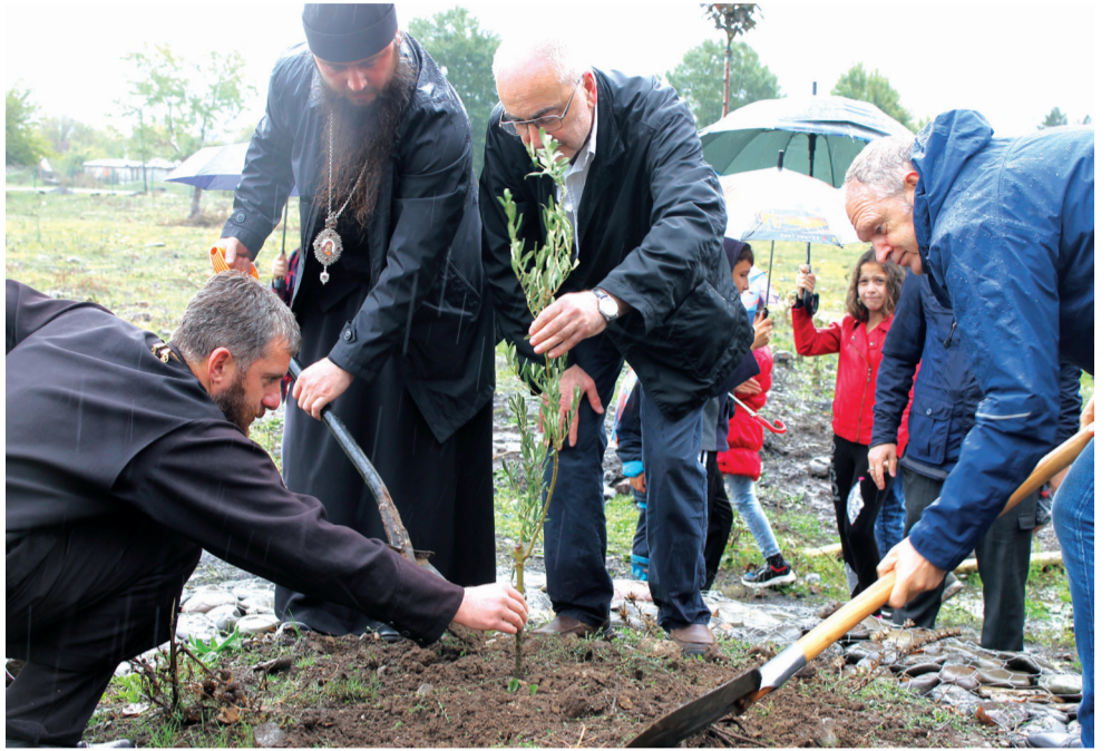
უოფილი აგურის ქარხნის ტერიტორიაზე, ე.წ. „ლიეტუვის პარკში“ მეუფე სვიმეონმა, ლიეტუვის ელჩმა და მოსახლეობამ 450 უნიკალური ჯიშის ნერგი დარგეს.

ცნობილი პოეტის ეს ლექსი, თითქოსდა, აბსოლუტური სიზუსტით, ესადაგებოდა 28 სექტემბერს, დღეს, როდესაც ჩვენმა ქალაქმა საკუთარი დღესასწაული იხეიმა. ზოგადად, დღესასწაულების ნაკლებობას ქართველები არ ვუჩივით, საკმაოდ გვაქვს ასეთი დღეები როგორც რელიგიური, ასევე სამოქალაქო, მაგრამ მათ შორისაც საკუთარი ქალაქის დღესასწაულს, ერთგვარად, გამოირჩეუ-