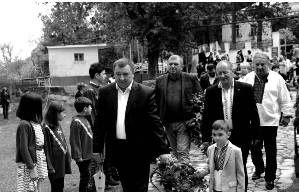
ლესია უკრაინკას ძეგლი გვირგვინებით შეიმკო.

ვალდის ვეიზი (ლატვია, ქალაქი ბაუსკა): საოცარი ხალხი ხართ ქართველები, მე ვიცოდი თქვენი სტუმართმოყვარეობის შესახებ, მაგრამ მსგავსს