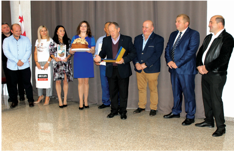
უცხოელი დელეგაციების ოფიციალური მიღება სასტუმრო „ივერიის“ საკონფერენციო დარბაზში შედგა