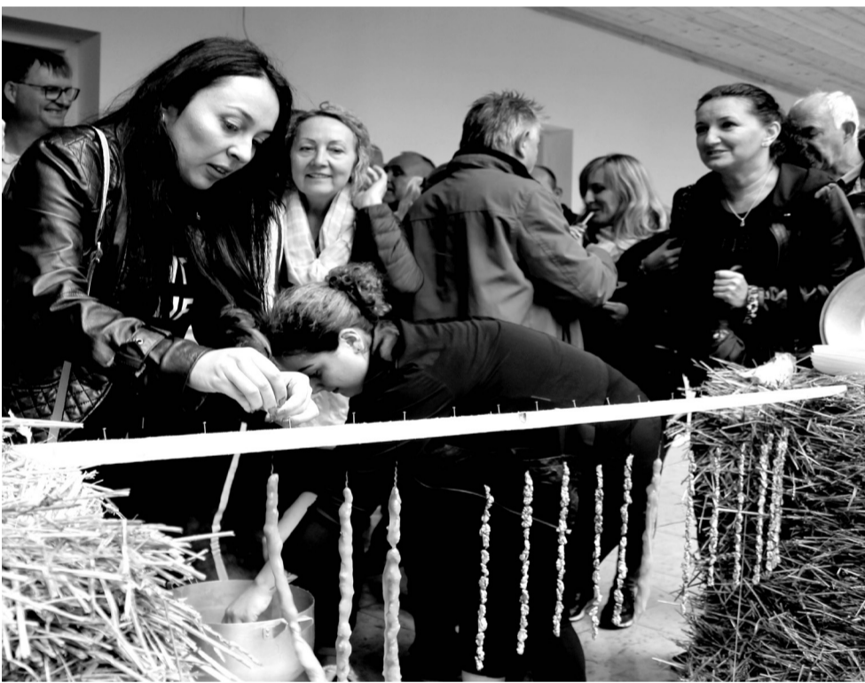
უცხოელმა სტუმრებმა ჩურჩხელების ამოვლებაც ისწავლეს.