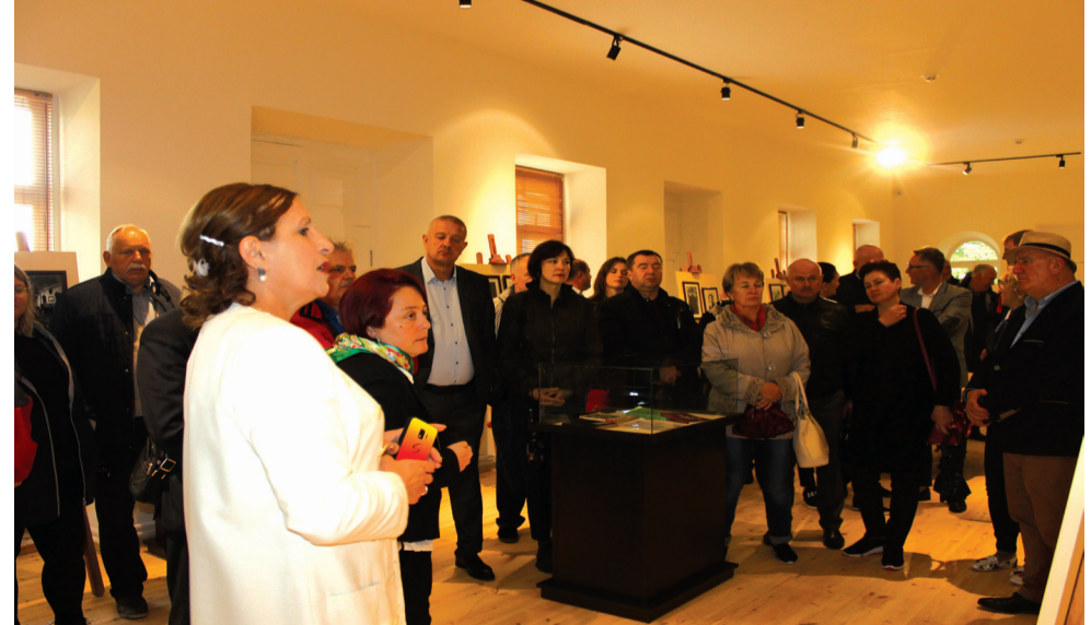
უცხოელი სტუმრები აღფრთოვანებულები დარჩნენ წმინდა დიმიტრი ყიფიანის ახლადრეაბილიტირებული სახლ-მუზეუმით.

ლი. თუ პირველ წელს მხოლოდ უკრაინული დელეგაცია გვსტუმრობდა, წელს ხუთი ქვეყნის შვიდი ქალაქის წარმომადგენლობას ვუმასპინძლეთ: პოლონეთიდან ქალაქების - ტარნოვისა და შრემის წარმომადგენლები იყვნენ ჩვენი მუნიციპალიტეტის სტუმრები, ლიეტუვიდან ქალაქ რადვილიშკისის დელეგაცია გვმწვია, ლატვიას ქალაქი ბაუსკა წარმომადგენდა, ბელარუსიდან - გორკი,