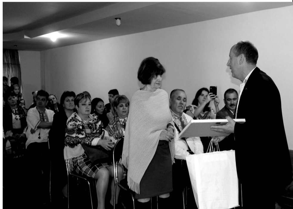
სტუმრად სურამის III საჯარო სკოლაში.