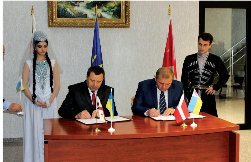
ხაშურქალაქობაზე უკრაინის ქალაქ ობუხოვსა და ხაშურს შორის მეგობრობისა და ურთიერთთანამშრომლობის მემორანდუმი გაფორმდა.