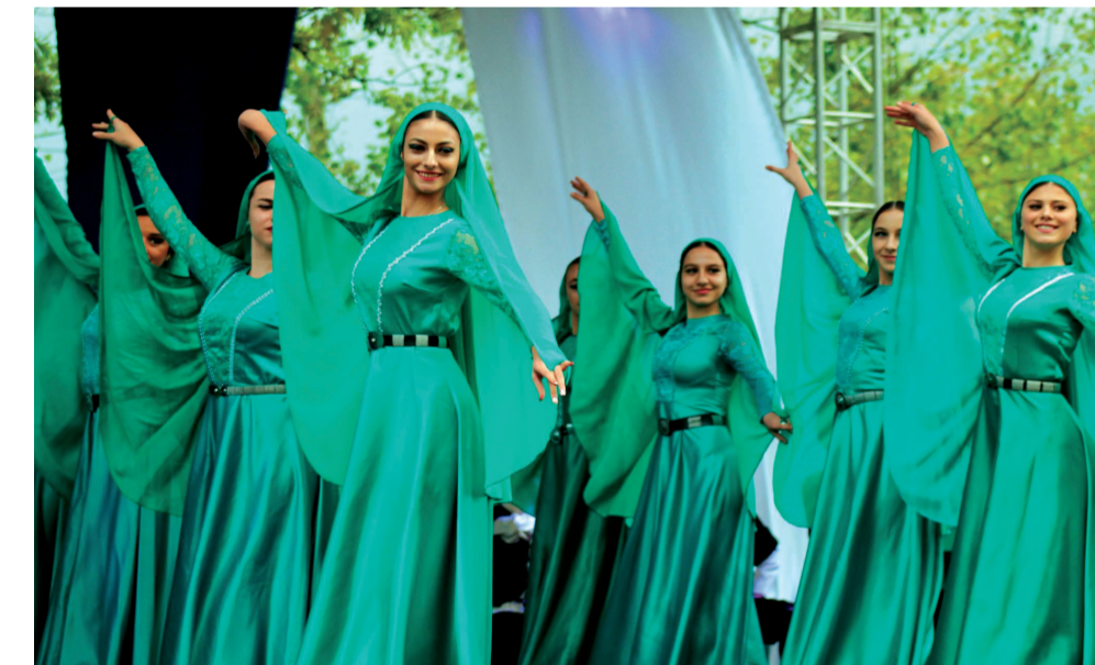
2010 წელს ჩაეყარა საფუძველი ხაშურქალაქობას. მეცხრე წელია აღვნიშნავთ ამ დღეს და ყოველწლიურად უფრო მოცულობითი ხდება ეს დღესასწაუ-

უხდებოდათ სცენარის შეცვლა. საბედნიეროდ, მათ ღირსეულად გაართვეს თავი ყველაფერს და უამინდობამ სრულებითაც ვერ დააატყო თავისი „მსახურალი“ ხელი დღესასწაულს.