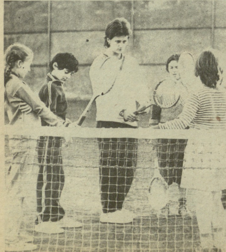
ჩოგბის სწორად დაკერა ჩოგბურთის ანახია. მათ გომამე სწორად ახხებენ ამ კეშმარტებს თავის აღხარდლებს.