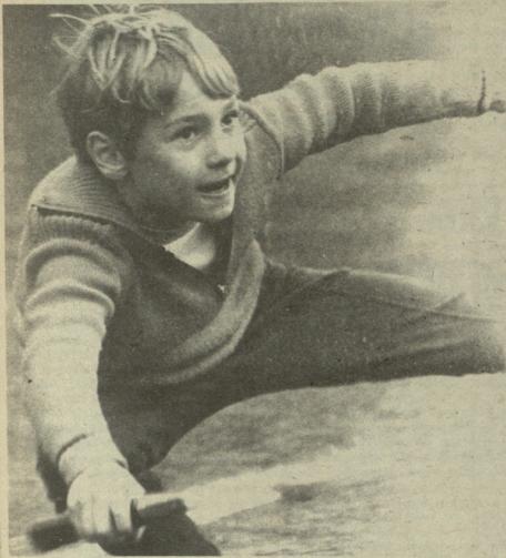
აქედანვე, ბავშვებიდანვე უკიდობა სპორტული ხასიათი.