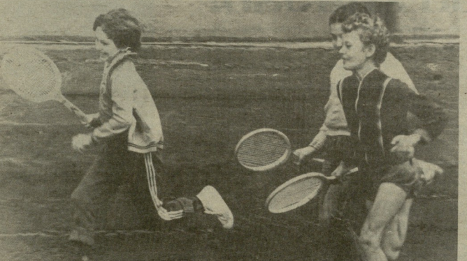
ჩქარა ხალხი ვარეიში დაიწყებამ

ჩახახა — ვერსიულანში დაიბადა ჩოგბურთის მეურლი კენტრი, რომელიც მანამდე იქცა პატარების საყვარელ ადგილად. ამ ზუსტად კიდევ უფრო გააღამაზეს და გააკოცავეს კორტები და სასახლო წლის დაწყებათან ერთად 800-მდე წინამორბედი სპორტის ბაღს კუთხეში შეუდგულ მეურლი ახანებს დღეს სპორტული პარკისთვის, თბილისის ძველ სპორტულ უბანს გაეცოცხლო მეტი ეხახვირევიდა და იცუთვნილა კლდე. რამდენიმე წლის წინათ, ამ, ერთ დღის გამოხადევატარ, უქმად მივდებულდ აფიცილი ახალი, ჭეშმარიტად სპორტული სიციცლები