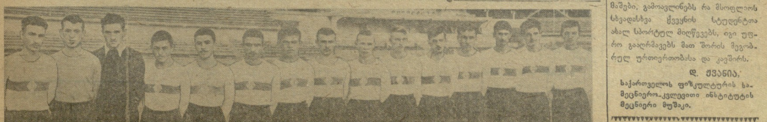
სწრაფად: თბილისის „ორი დინამოელი“ ფეხბურთელი გუნდი.