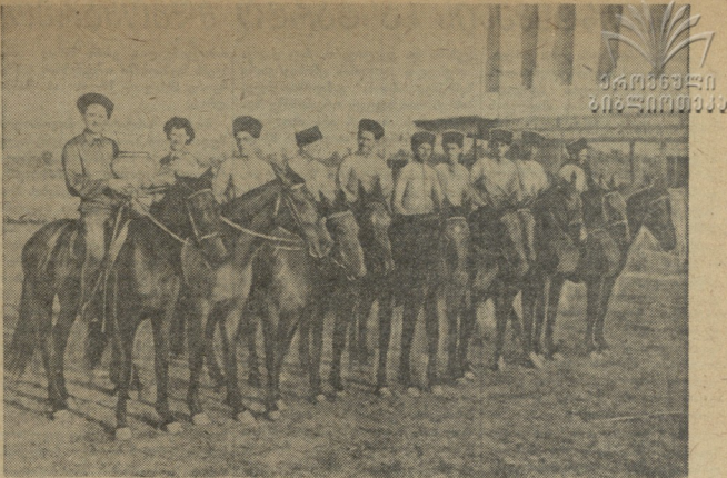
სპორტის რამონიანი რიგების განვითარების გზაზე

თითქმის ერთი დეკადაა ურბანული ოსკოპის განვითარების გზაზე