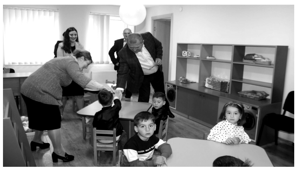
სურათზე: ტეზერში ახალი საბავშვო ბავშვის გახსნა აღსაზრდელს მუნიციპალიტეტის ხელმძღვანელებმა მიულოცეს.

- მინდა გითხრათ, რომ საკმაოდ კვალიფიციური კადრები გვყავს, სააღმზრდელო დაწესებულებებში. კადრებს გავლილი აქვთ შემდეგი ტრენინგები: ყველა აღმზრდელს - „სკოლამდელი ღირებულებების მართვა და თანამედროვე სტანდარტები“, აგრეთვე „სკოლისათვის მზაობის პროგრამის ანალიზი და სტანდარტები“, ექსტრემი და მზარეულებმა გაიარეს „ჯანსაღი კვების ორგანიზება სკოლამდელ დაწესებულებებში“, ყველა მეთოდისტმა გაიარა „აღმზრდელ-პედაგოგთა პროფესიული განვითარების ტრენინგ-მოღვაწეობა“. მეთოდისტებმა თბილისში გაიარეს ტრენინგ-კურსები ყველა დანარჩენმა კი - ადგილობრივად. თ. ახალკაცი