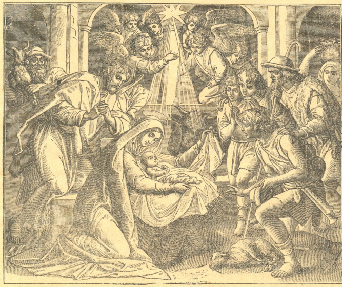
თაყვანს სცემენ ახლად შობილ მაცხოვარს ბეთლემის მწყემსები.