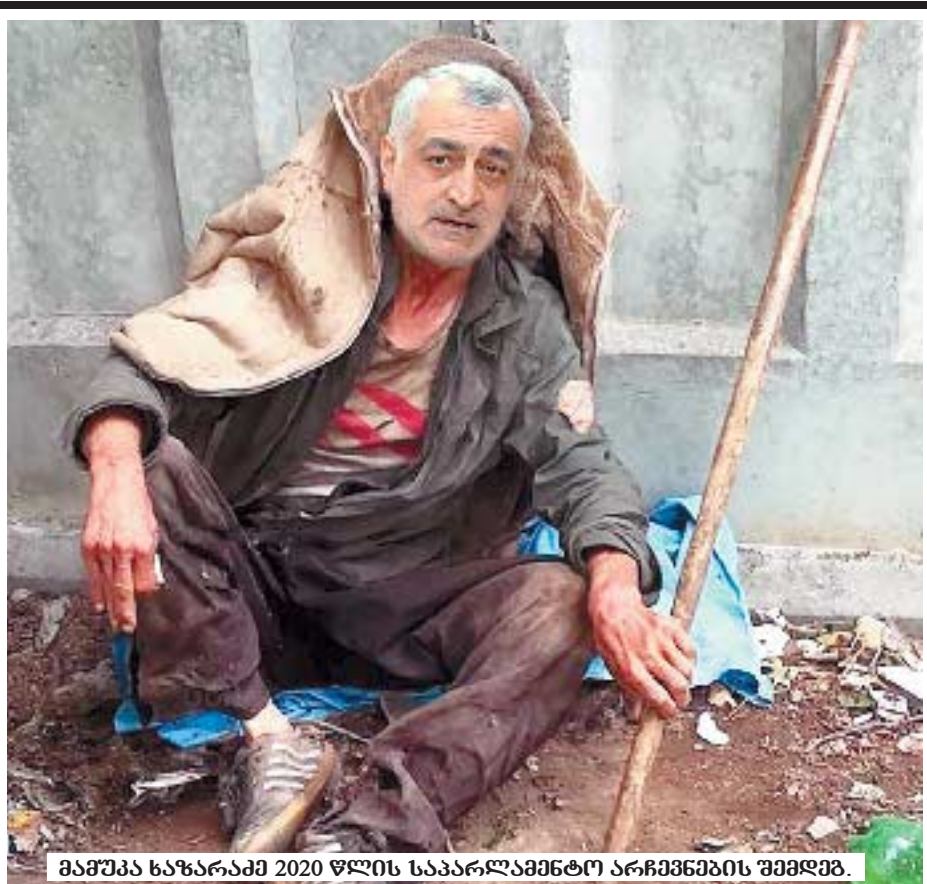
მამუკა ხაზარაძე 2020 წლის საპარლამენტო არჩევნების შემდეგ.