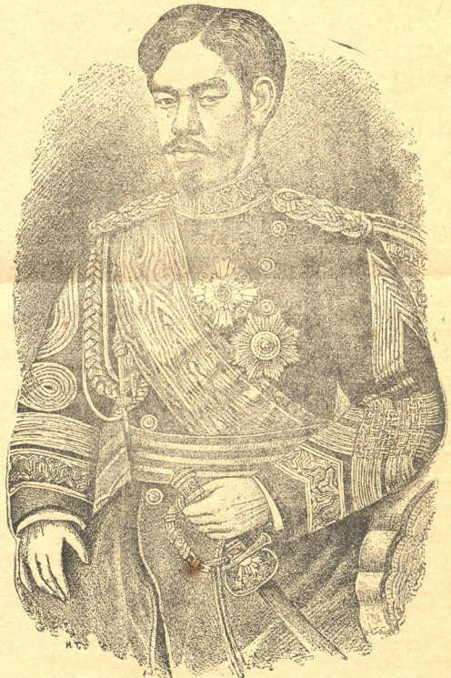
იანონიას იმპერატორა მუნსუკატო.