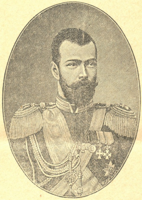
მისი იმპერატორებთა უდიდებულესობა იმპერატორა ნიკოლაჲს შერუე