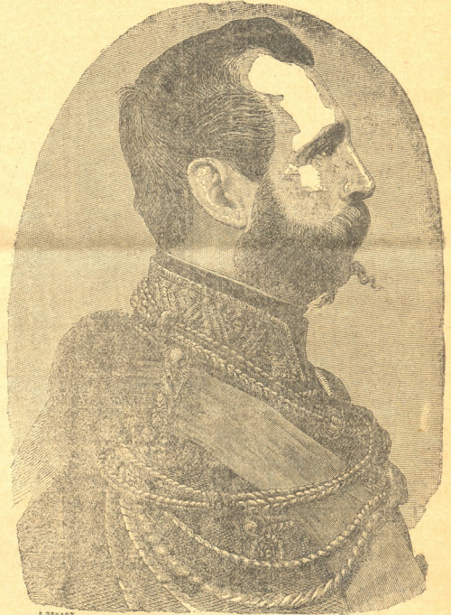
იმპერატორი ალექსანდრე მეორე.

ვიტყვი, რომ რუსეთის ღირსება სრულიად არ დაინარგება, თუ ომის დასასრულ ჩვენი ხელმწიფე ისეთ დადგენილებას მოახდენს, რომელიც საფუძვლად დაედება იაპონიასთან და კორეიასთან შეთანხმებას,—შეთანხმებას იმდენად მკეოდრსა და ორისავე მხარისთვის იმდენად სასარგებლოს, რომ ჩვენს მეფეს თავისუფლად შეეძლოს მთელი ძალღონე რუსეთის შინაურ ცხოვრების რეფორმას მოახმაროს. საქმის ასეთი დაბოლოება თავიდან აგვაცილებს იმ საშინელ ომს, რომლის ნ 6 წლის განგრძობას ასე გულგრილად თხოულობენ შოვინისტ-პატრიოტები.