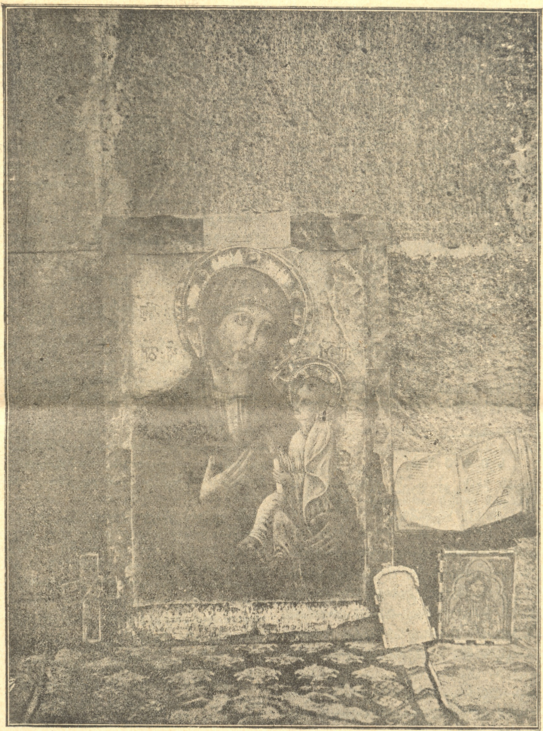
მეტეხის ღვთისმშობლის ხატი