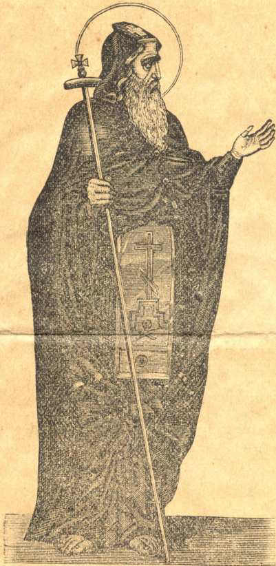
ღირსი დავით გარეჯელი.

განსაკუთრებით ღვთის-მსახ. ზეთის-კურთხევით.