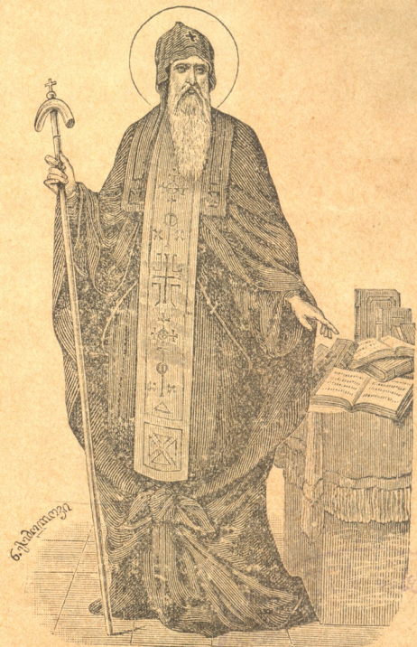
ნ. ი. ი.