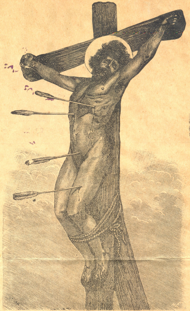
წმ. პირველ-მოწ. რაჟდენი.

განსაკუთრებითი ღვთის-მსახურება ღამის-თევით.