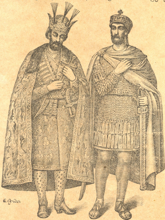
ნ. ი. ი.

განსაკუთრებით ღამის-თვევით ღვთის-მსახურება.