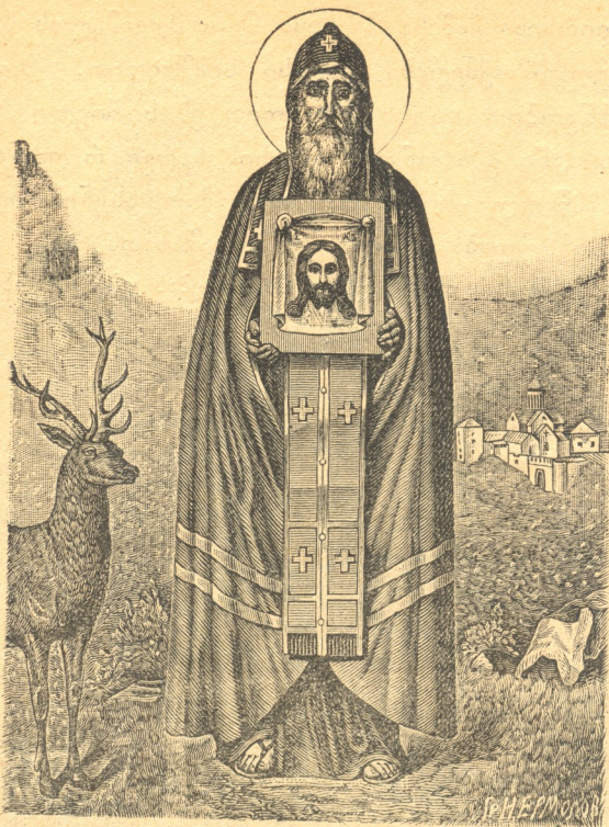
წმ. ანტონ მარტყოფელი.

იცვლებოდა დაიბარა, რომ დაემარჯათ ეკლესიის შესავალ კარებში, რათა შემსვლელთ და გამომსვლელთ ეთქირნათ მისი საფლავი. მეფე სოლომონ იმერეთისამ 80 წ. XVIII ს. დაკრძალა გელათის სობოროს ტრაპეზ ქვეშ.