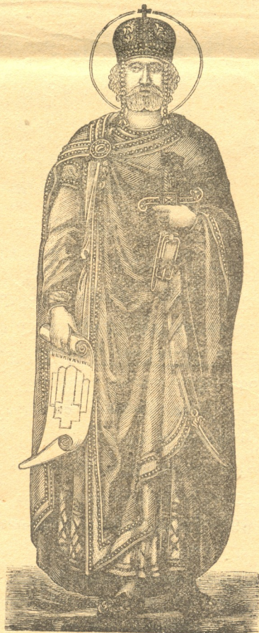
წმ. დავით აღმაშენებელი.