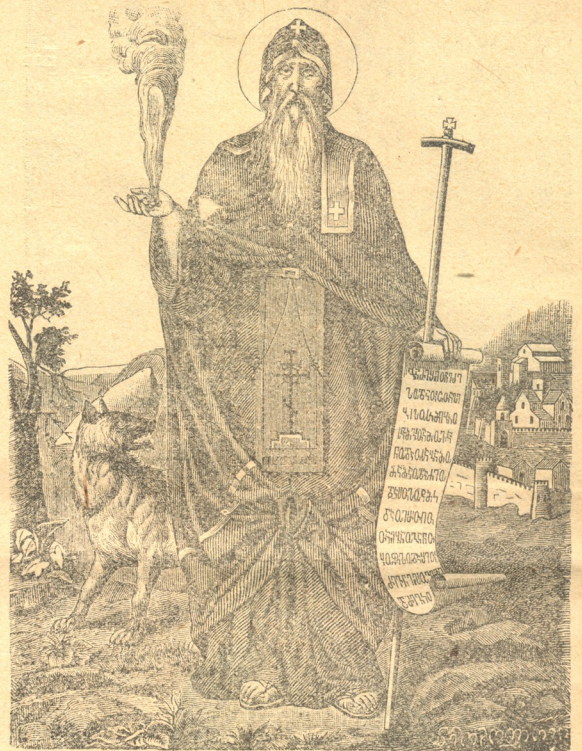
ღირსი შიო მღვიმელი.

ღამის თვეით ღვთის-მსახურებას უჩენს მარხვანში ყველიერის ხუთშაბათს.