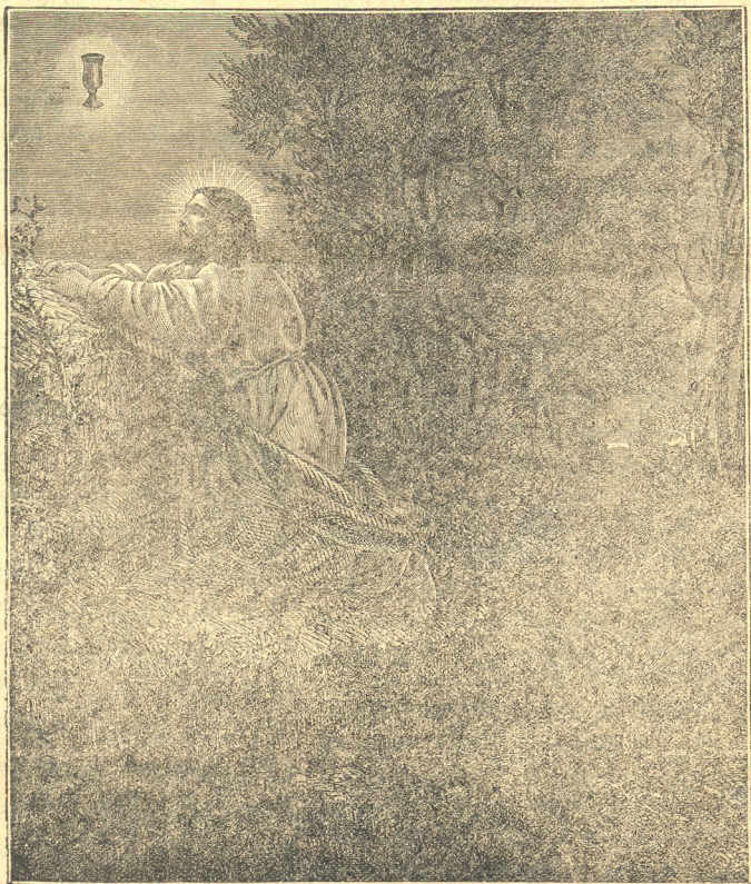
ლოაკვა გეთსამანიის ბაღში.

ჩვენ ზიზღსა გვრის იუღას ეს საზიზღარი საქციელი... მაგრამ უფრო ყურადღებით ჩაუკვირდეთ ჩვენს თავს, შევეკითხოთ ჩვენს სინდისს, ნუ თუ ჩვენც ხშირად არ ვბაძვთ მიმცემელ იუღას? ნუ თუ ჩვენც ხშირად არ შეგვიპყრობს ხოლმე ვერცხლის მოყვარება, სხვა-და-სხვა პიროვნული სარგებლობანი და არ ველატობთ თვით ჩვენს ძლიერ საყვარელ მახლობელთა-კი, მზად ვართ გავსწყვიტოთ ნათესაური კავშირი, ვიპირ-მოთნეთ და ვიცრუ-