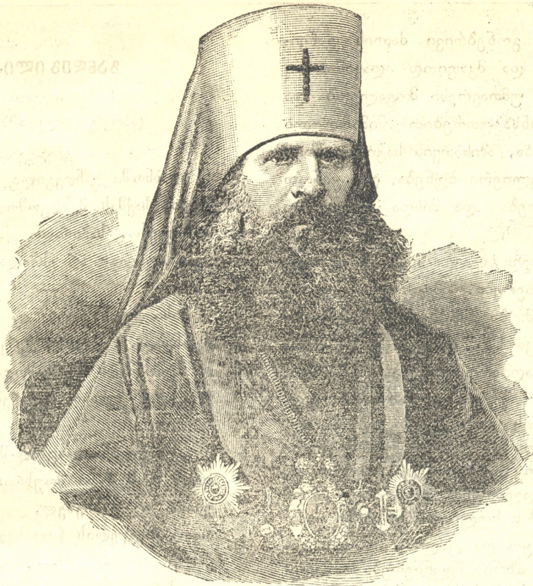
კეკელის მიტროპოლიტი ივანე ნაკე.