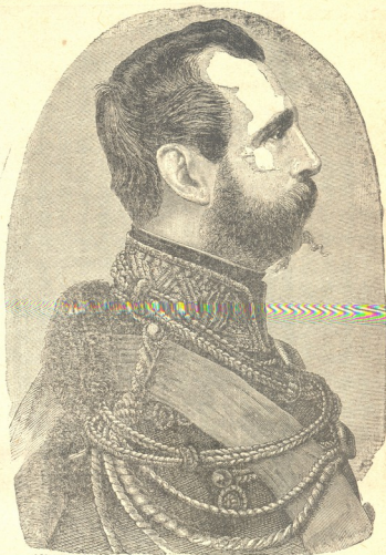
იმპერატორი ალექსანდრე II ტახტზე ასვლის დროს.

ერთი ჯერის დასადგბელით და მეორეს ხელში ეკავა აიაზმის წყლის ჭურჭელი; შემდეგ იდგნენ მღვდელმთავრები, დეკანოზები და სხვა სამღვდელთა. მისმა მალალ ყოვლად უსამღვდელთაგან მოსკოვის მიტრაპოლიტმა ვლადიმერმა ჯვარი გადასახა და აიაზმის წყალი ასხურა მათ უღიღებულესობათ.