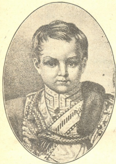
იმპერატორი ალექსანდრე II სიყმაწვილეში.