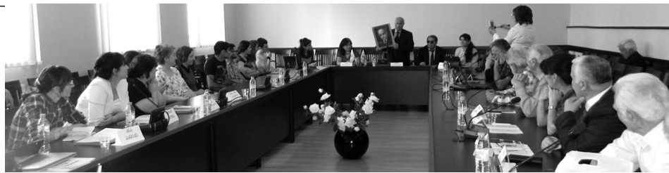
P.S. ონომასტიკური კონფერენცია სამცხე-ჯავახეთის სახელმწიფო უნივერსიტეტში უკვე ტრადიციად გადაქცეული, მაგრამ 2018 წლის კონფერენცია