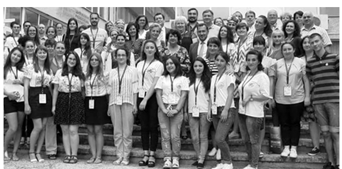
ზამთრის, ზაფხულის და შემოდგომის სკოლები, საერთაშორისო პროექტები და სემინარები

სამეცნიერო ბიბლიოთეკა უნივერსიტეტში ფუნქციონირებს თანამედროვე ტექნოლოგიებით აღჭურვილი სამეცნიერო ბიბლიოთეკა, რომელიც ჩართულია EBSCOHost-ის (სამეცნიერო ჟურნალების სრულტექსტიან მონაცემთა ბაზა) ელექტრონული რესურსების სისტემაში; ხელმისაწვდომია, აგრეთვე, ელექტრონული კატალოგი Openbiblio