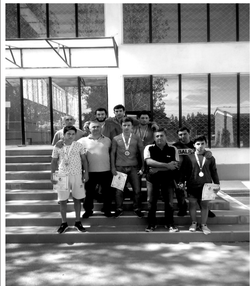
- ჭიდაობა -