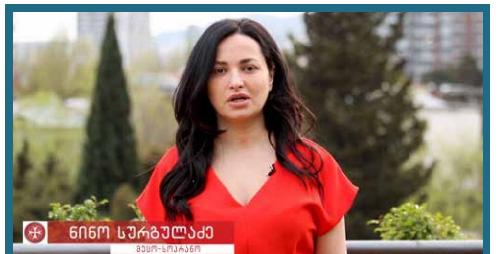
ნინო სურგულაძე: „ჩვენო საამაყო ფარისეალებო, თქვენ ხართ ჩვენი სამშობლოს და თითოეული ჩვენგანის სიამაყე, თქვენ არაერთხელ დაამტკიცეთ ქართული ჯარის სიმტკიცე და პროფესიონალიზმი, როგორც საერთაშორისო მისიებში, ასევე ჩვენი ქვეყნისთვის უმძიმეს წუთებში. მადლობას გიხდით სამსახურისთვის!“

„ამ დღეს სიმბოლურად შეიძლება ვუწოდოთ სამშობლოს დაცვის ვალდებულების დღე, იმიტომ რომ, დამოუკიდებელი საქართველოს პირობებში, სწორედ ამ ვალდებულებით შეიქმნა ქართული ჯარი და ეს ვალდებულება აიღო 28 წლის წინ უკვე აღდგენილი დამოუკიდებლობის პირობებში, ქართველმა ვაჟკაცმა, რითაც გადადგა ნაბიჯი იმ ტრადიციების გაგრძელებისკენ, რითაც ჩვენ, ქართველები, ოდითგან ვამაყობდით და დღესაც ვამაყობთ“. „მე მინდა, პირველ რიგში, თქვენთან